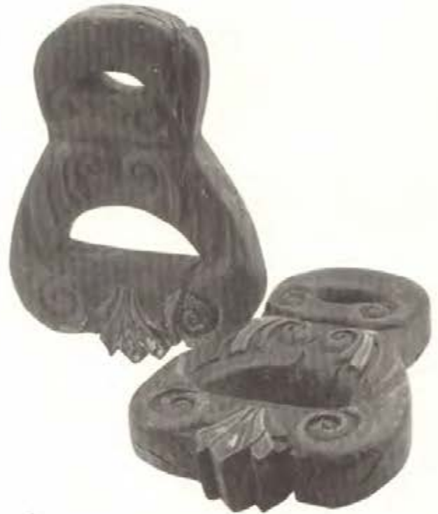
Estribos antiguos de madera.

tres haciendas de minas y otros tantos españoles que vivían en ellas. 11