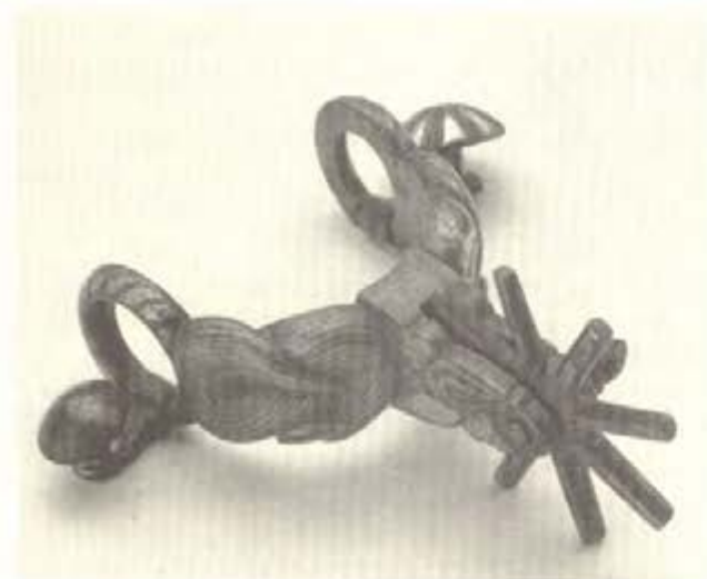
Espuelas de lujo de distintos tipos.

momentos y van sucediendo en una misma veta metales Ricos a pobres o pobres a ricos... 13