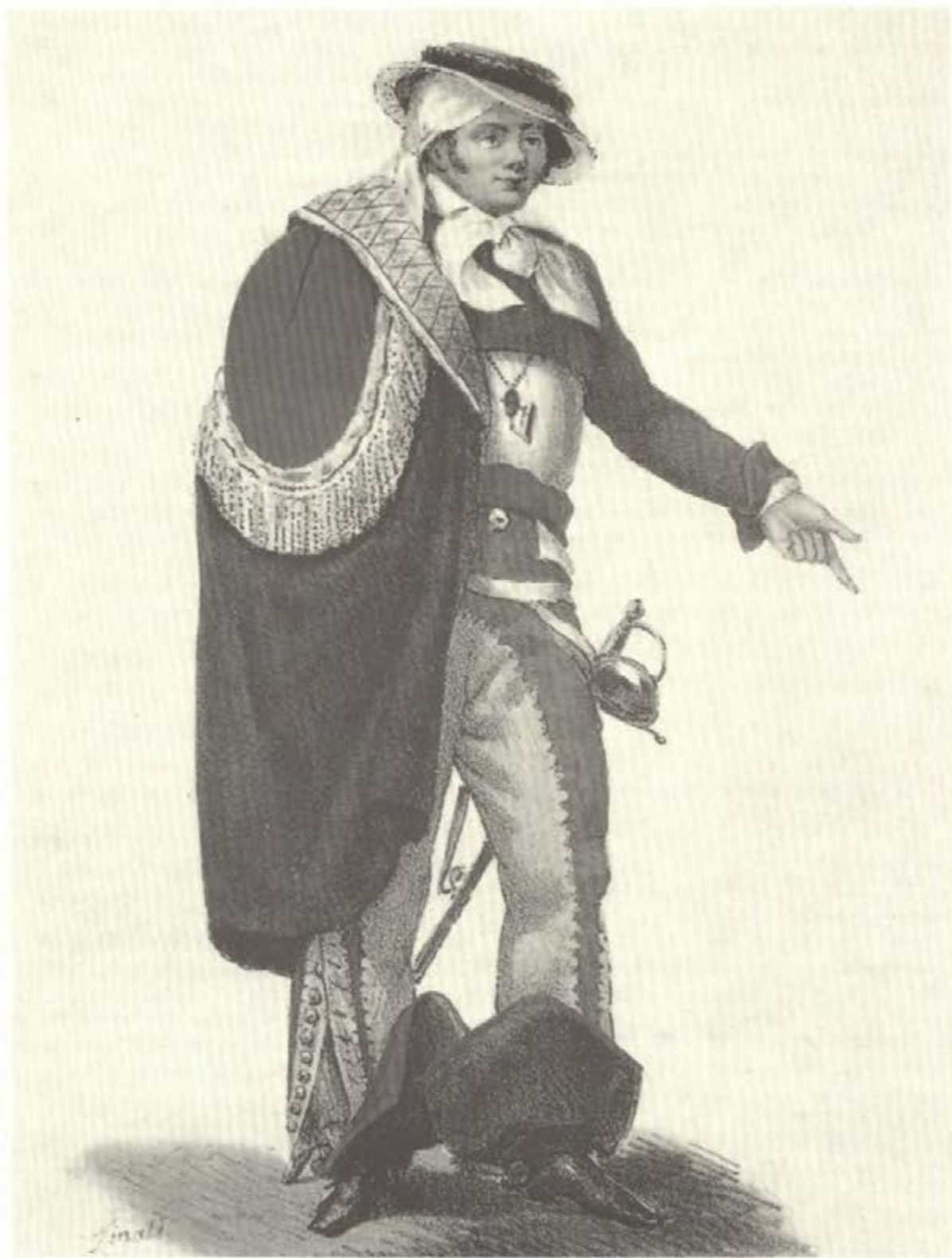
Hacendado , litografía de Claudio Linati.