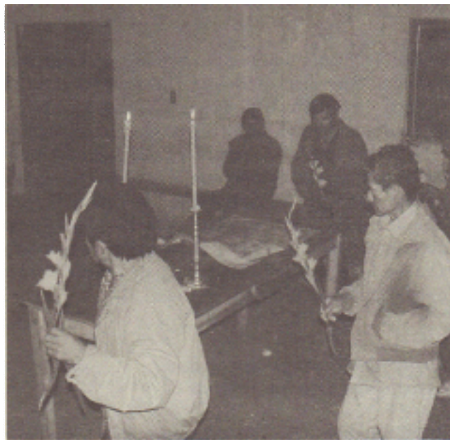
Danza ritual al Lienzo de Coachimalco .