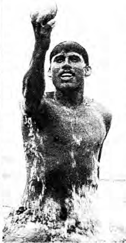
FOTOGRAFÍA: LOGON, REPROD. EN SUÁREZ DIEZ, 1991, PÁG. 44

La buena calidad y claridad de las reproducciones fotográficas del libro las convierte en fuente de información por sí mismas, más que en meras ornamentaciones. Por ello, unos pies con descripciones más detalladas y analíticas le hubieran dado a cada ilustración mayor importancia. En efecto, las fotografías demuestran el interés de los antiguos objetos de concha como fuente para el conocimiento histórico; pero como toda fuente, es más valiosa para los estudiosos si, v. gr. , va acompañada de un des-