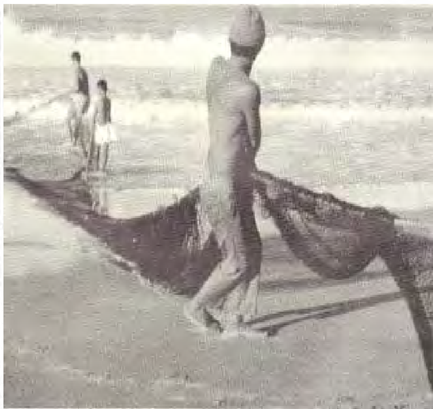
PESCADORES COSTEROS (FOTOGRAFÍA: LUDWIG IVEN, REPROD. EN SUÁREZ DIEZ 1991, PÁG. 36).

Para comenzar a "echar la aburridora", puede decirse que se trata de una obra brillante... por su papel brillante que tanto dificulta su lectura, de gran tamaño, profusamente ilustrada, con lujosa encuadernación y agradable a la vista por sus espectaculares fotografías a color y sus nítidos dibujos. En ella se muestra la preciada concha como objeto bello, sobre todo. Esto la inscribe dentro del género de libros de arte para coleccionistas, sin textos de naturaleza antropológica del todo como espera alguien inclinado al pensamiento además de la contemplación, pues las meras descripciones arqueológicas contenidas carecen por sí solas del poder de recreación y análisis histórico. Y es que el uso generalizado y en todo tiempo de la concha como ornamento, en sí mismo le da al libro —casi sin poder evitarlo— el atractivo propio del coleccionismo y la historia del arte. A cambio, perdió la oportunidad de recoger por vez primera