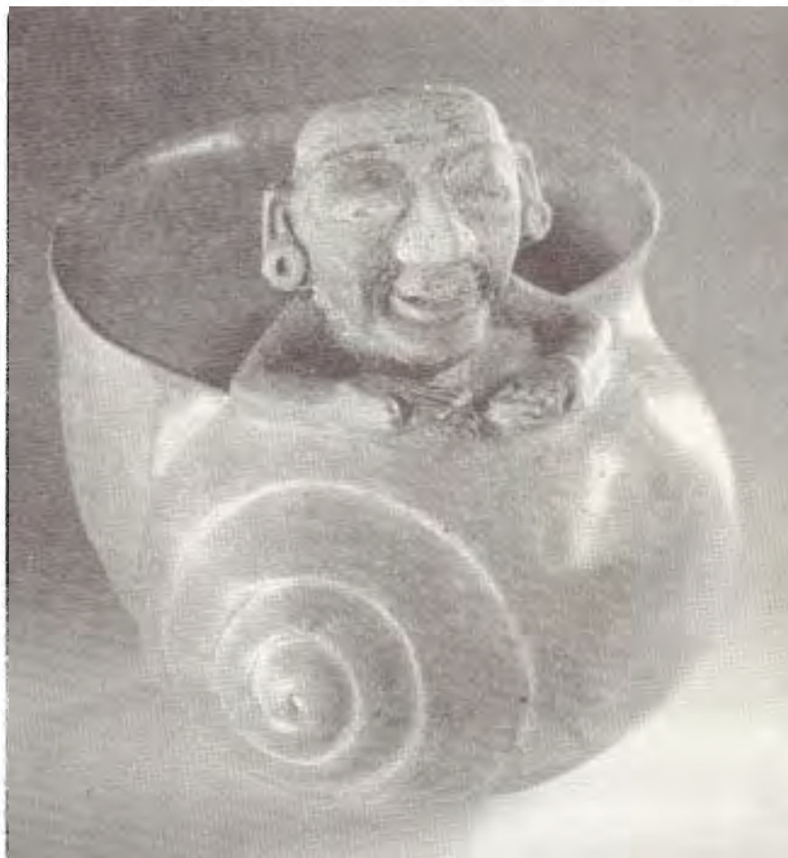
VASIJAS MAYAS EN FORMA DE CARACOL, DEL CUAL SALE (¿NACE?) UN HOMBRE, CONSERVADA EN EL MUSEO NACIONAL DE ANTROPOLOGÍA

pletas (como las llamadas arqueolítico y neolítico), como si la historia de las bandas humanas de la antigüedad hubiera girado obsesivamente en torno a las piedras. Otro cuento puede contarse con una visión más completa de los antiguos conjuntos tecnológicos. Después de todo, los lejanos ancestros debieron ser bastante menos simples de lo imaginado.