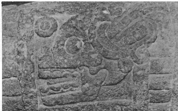
Otro ejemplo de numeral 1-muerte en una atadura del Museo Nacional de Antropología

y Cepactonal , inventores del calendario. 8