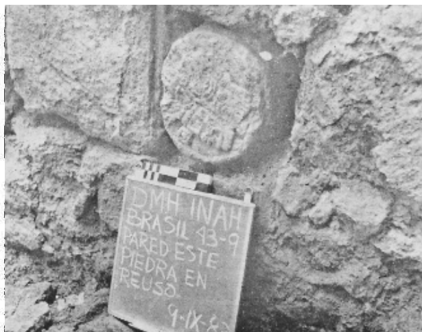
Detalle del xiuhmolpilli en el muro