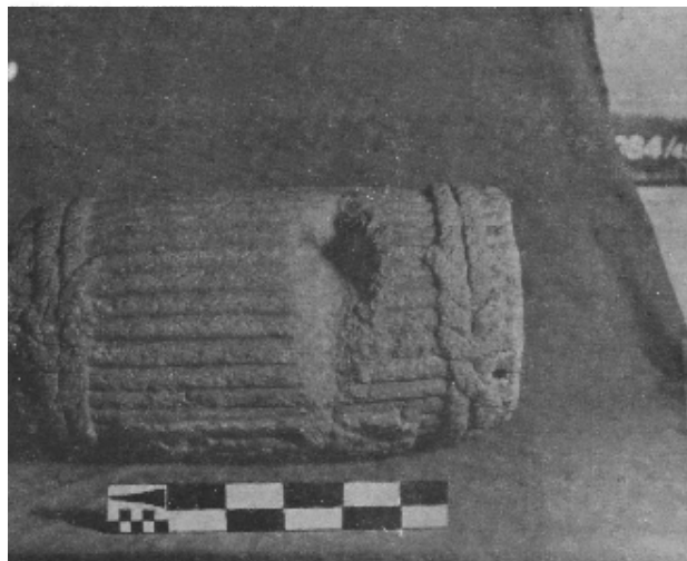
Atadura de la calle de Brasil; vista posterior. Nótese las representaciones de los nudos

espejo humeante en la sien formado por un círculo concéntrico, adornado con cuatro bolitas de plumas o algodón; del centro brotan volutas del humo y bajo la base del occipital fue colocado el numeral 1.