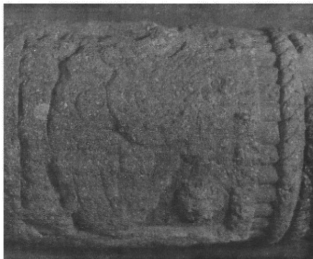
Atadura de la calle de Brasil; detalle del numeral 1-pedernal