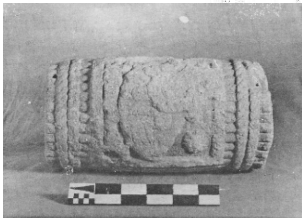
El atado de la calle de Brasil, visto de frente

En septiembre de 1986, mientras se retiraban los aplanados de una de las viviendas, los albañiles descubrieron que en el muro existía una "piedra grabada", e inmediatamente se dio parte a la Dirección de Monumentos Históricos del INAH.