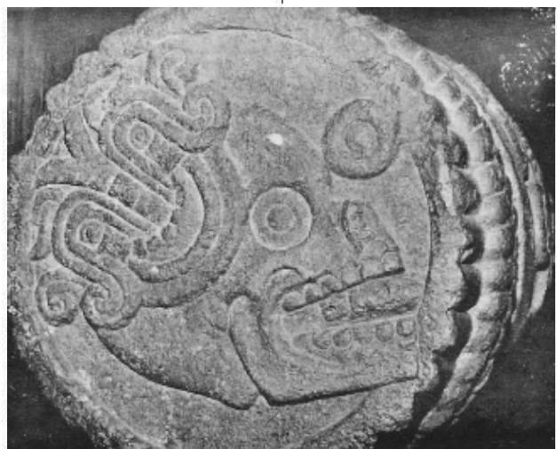
Numeral 1-muerte en una atadura del Museo Nacional de Antropología

Por otra parte, también se ha querido representar la "lluvia de fuego", en conmemoración a Tezcatlipoca , creador del fuego y regidor del ciclo de 52 años y, en consecuencia, de la ceremonia del Fuego Nuevo. Es por ello que en el Códice Borbónico Tezcatlipoca aparece junto a Quetzalcóatl , dios del tiempo, y junto a los ancianos Oxomoco