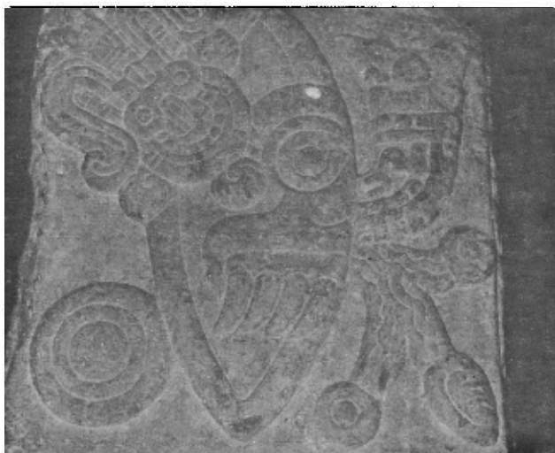
Representación del numeral 1-pedernal en el "Teocalli de la guerra sagrada". Museo Nacional de Antropología