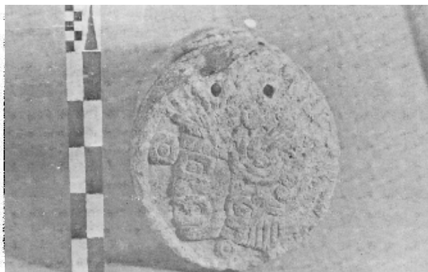
Perfil izquierdo de un personaje con numeral 1 en el atado de la calle de Brasil