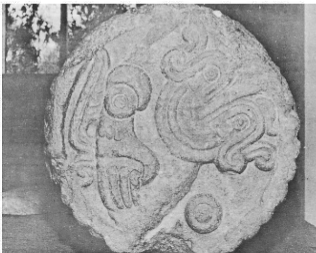
Atadura en el Museo Nacional de Antropología con la representación en una de sus caras del numeral 1-pedernal