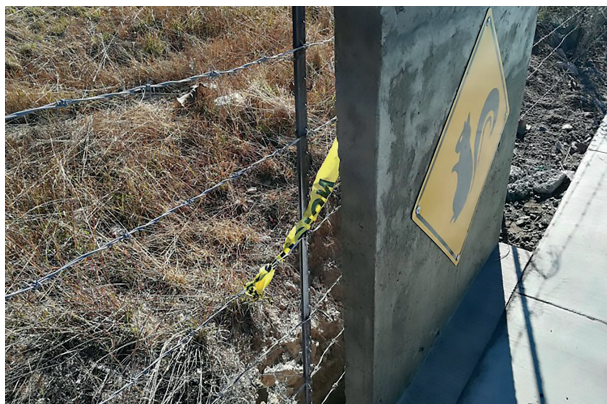
Figura 2. Paso de fauna.

pues atraviesa el ANP, el gobierno municipal quiso pavimentarlo y explicó que, para respetar el bosque, colocaría pasos de fauna. Se hizo una entrega simbólica en la colonia, que fue tensa, entre protestas por parte de algunos vecinos y la celebración de otros que opinaban que este camino era respetuoso de la fauna, al mismo tiempo que comunicaba a la ciudad con las nuevas colonias; sin embargo, los pasos de fauna resultaron ser pozos verticales con señalamientos para los animales.