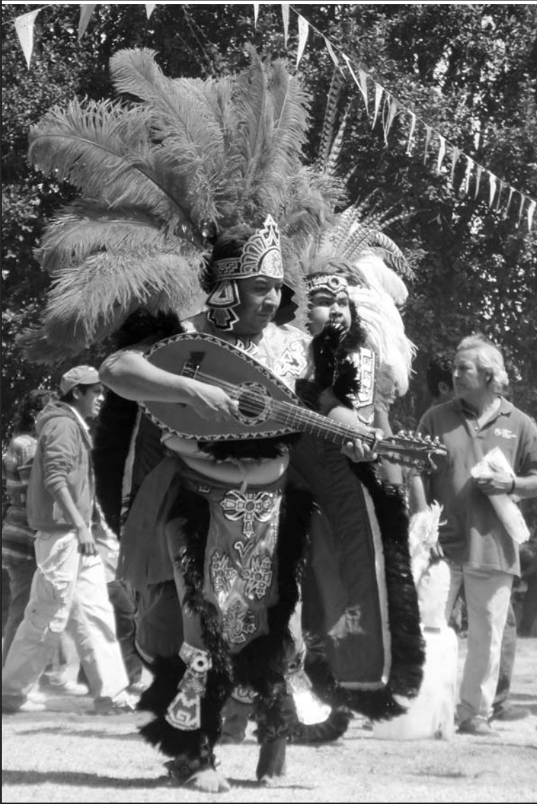
Fotografía 2. Conchero adorando la Santa Cruz. Cerro de Culiacán, mayo de 2011.