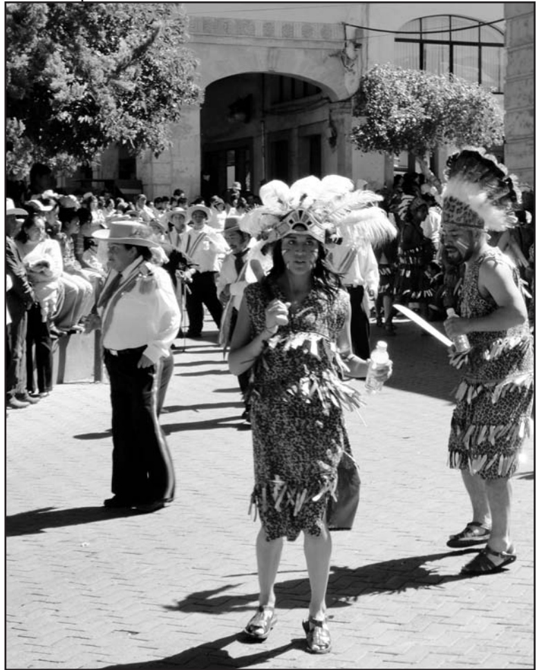
Fotografía 5. Rayados de San José Iturbide. San Luis de la Paz, noviembre de 2010.

En relación con la danza de Palo (de Paloteo o de Paloteritos), existen grupos desde Puruándiro, Villa Morelos y Huandacareo, Michoacán, hasta los municipios de Uriangato y Yuriria. No se interpreta en Moroleón, Santiago Maravatío, en Salvatierra, en Jaral ni en Valle