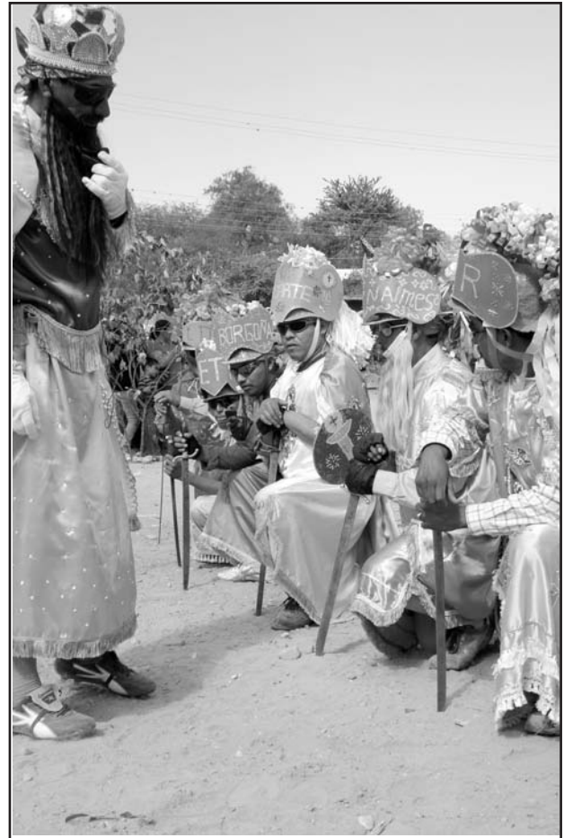
Fotografía 3. “Doce pares de Francia”, Dolores Hidalgo, marzo de 2011.