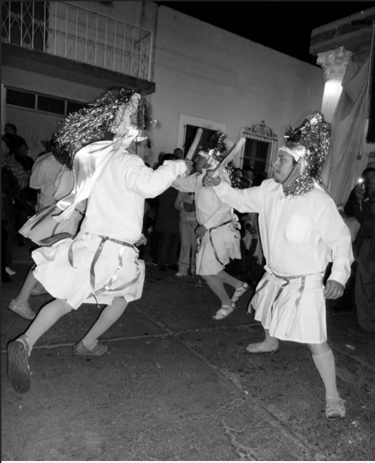
Fotografía 4. Palotereros en la fiesta de la Preciosa Sangre de Cristo. Yuriria, enero de 2011.