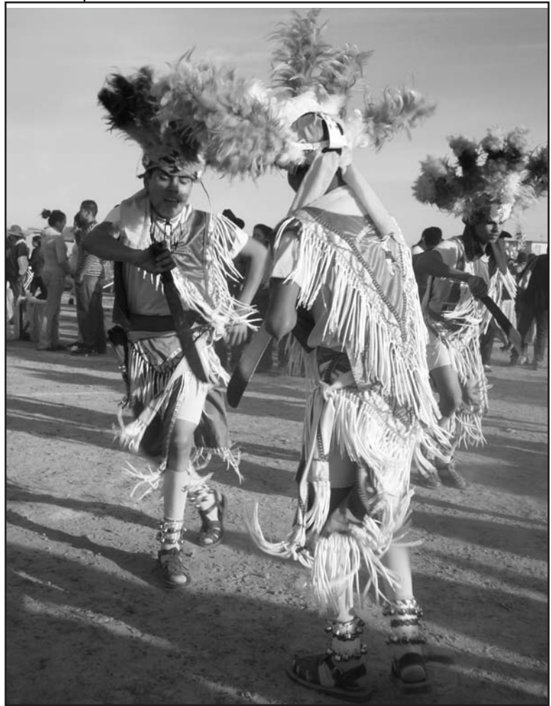
Fotografía 1. Broncos de León en la fiesta de San Miguelito. San Felipe, septiembre de 2011.

Una última delimitación es la que aparece en Breve historia de Guanajuato , la cual marca “tres regiones que