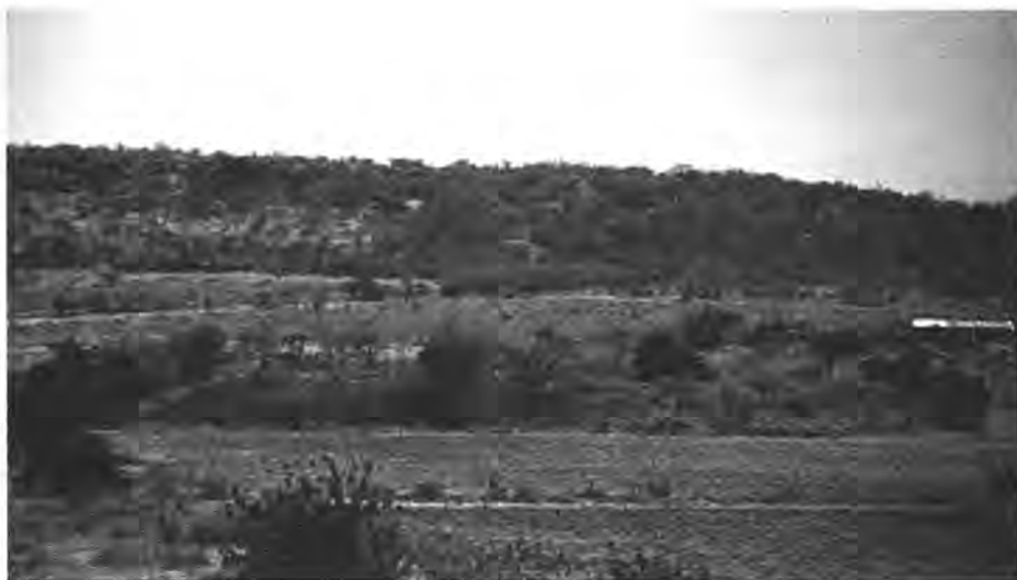
● Fig. 4 Conjunto El Cajete.

las estructuras del sitio Cañada de la Virgen, en San Miguel de Allende, Guanajuato, podría ser similar a la que obtuvimos en el conjunto Casas Tapadas de San Juan el Alto Plazuelas (Juárez, 1999: 45, fig. 3), pero sólo mediciones precisas en éste y otros sitios de la región podrán revelar si se trata de una tendencia generalizada y característica para este mismo corte temporal.