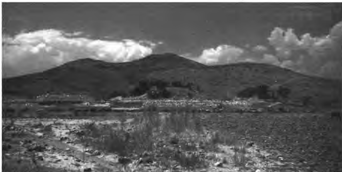
● Fig. 6 Vista panorámica del conjunto Casas Tapadas.

las alineaciones de la llamada familia de 17^\circ , 10 que al parecer señalaban fechas clave de un ciclo agrícola ritual o canónico (Šprajc, 2000a).