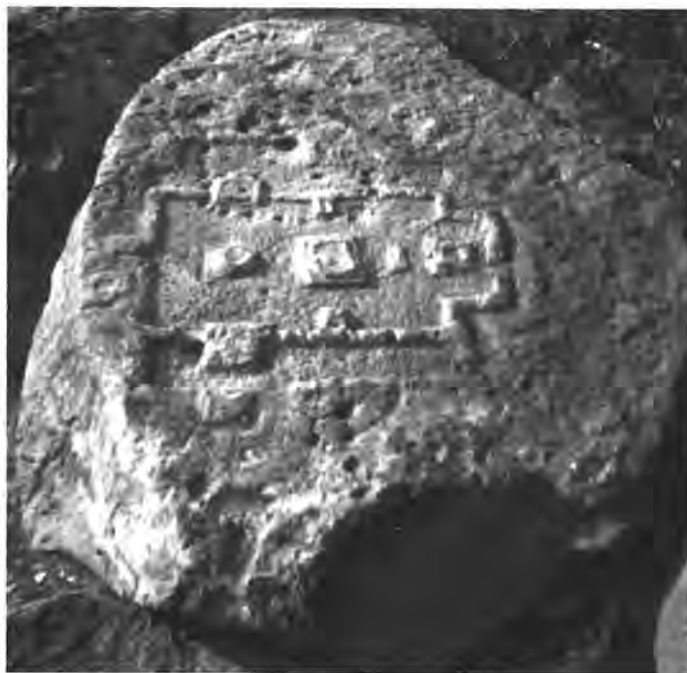
● Fig. 3. Maqueta núm. 2 de San Juan el Alto Plazuelas: representación arquitectónica del conjunto Casas Tapadas.

Su disposición recuerda al llamado Complejo de Los Tres Templos definido para Teotihuacan y asociado por algunos investigadores con cultos colectivos alrededor del cual se agrupaba el barrio (López Austin y López Luján, 1996). Por el momento, resultaría aventurado avanzar sobre cualquier explicación respecto a su presencia y función, debido a que no se han excavado. Sin embargo, queremos hacer hincapié que su configuración no responde a la arquitectura de patios hundidos o guachimontones, tradiciones que parecen conjuntarse en la región y caracterizarla.