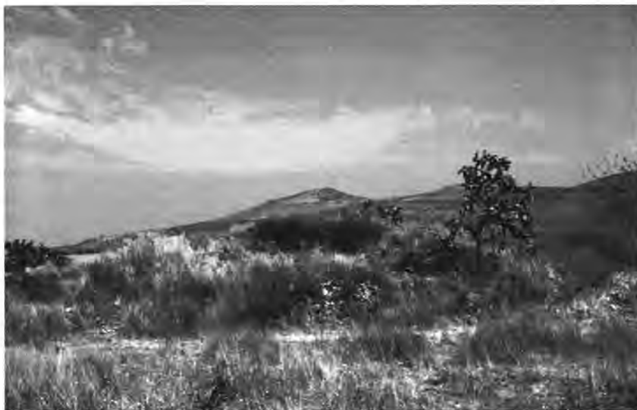
● Fig. 5 El Cajete; vista desde el centro de la estructura hacia el noroeste.

llegar a conclusiones más confiables, será indispensable contar con datos comparativos sobre los alineamientos en otros sitios contemporáneos de la región. 8