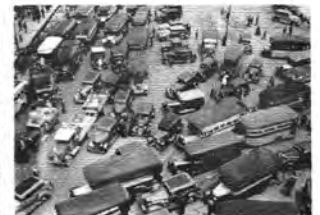
IMÁGENES DE LA VIDA COTIDIANA