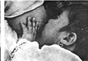
LA MIRADA DE TINA MODOTTI