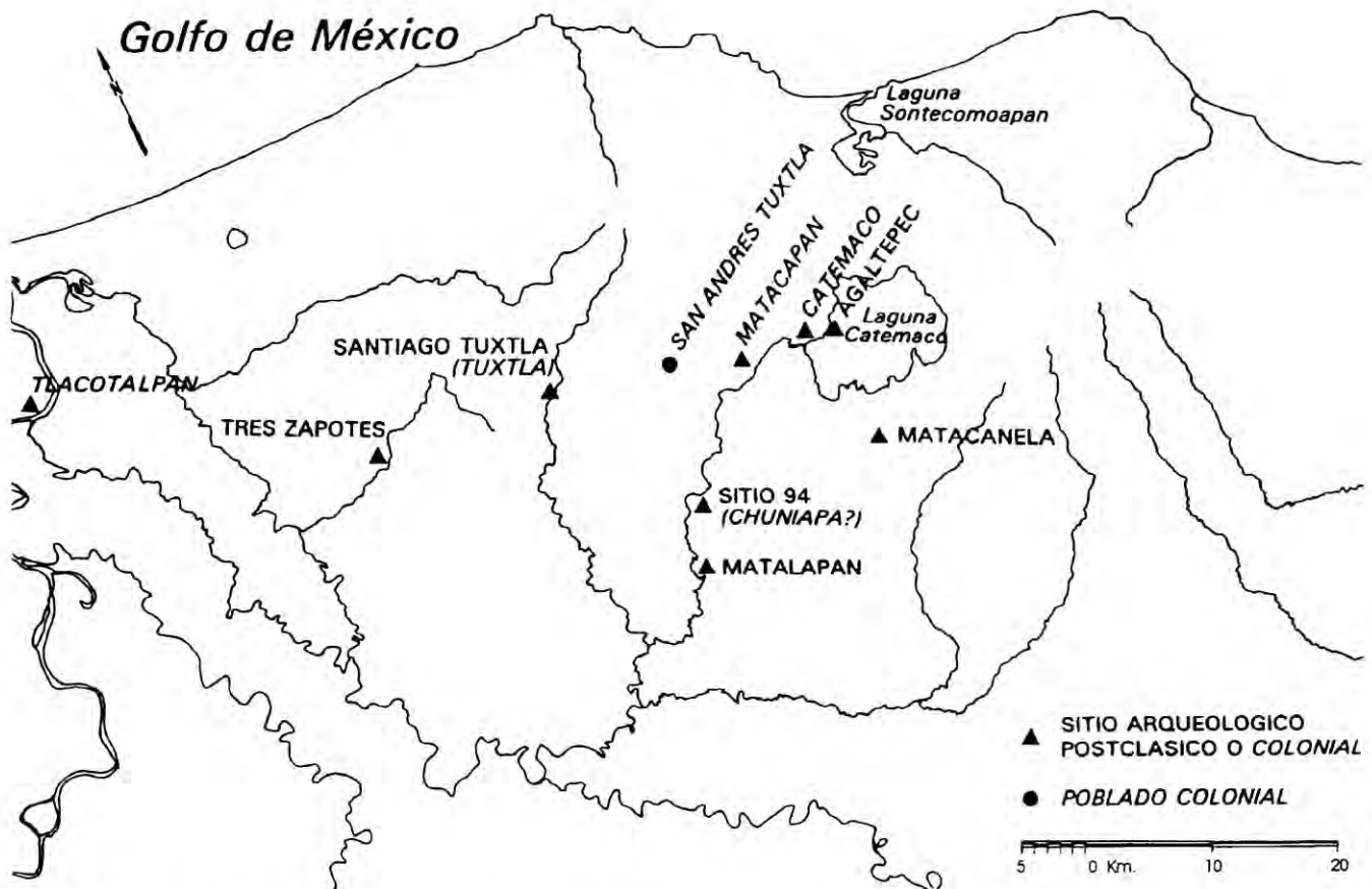
Figura 1. Mapa de sitios arqueológicos postclásicos y poblados del siglo XVI en la sierra de Los Tuxtlas.

del sitio, el cual abarcó 463 ha en este periodo (Ortiz y Santley, s.f.). Depósitos intactos del Clásico tardío han sido excavados en un contexto doméstico en la parte noroeste del sitio (pozo 67) (Santley y Ortiz, 1985), en un taller alfarero en la parte sureste del sitio (pozos 93-96) (Pool, 1990), y en Bezuapan, un sitio vecino ubicado al sureste de Matacapán (pozo 106) (Pool et al., 1993).