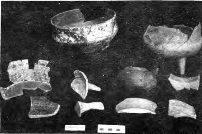
Figura 5. Grupo IV. Cerámicas de tradición mixteco-poblana. Tipos: 4. Policromo Laca; 19. Escolleras; 58. Policromo Firme; 72. Negro Pulido; 56. Negro Plomizo.