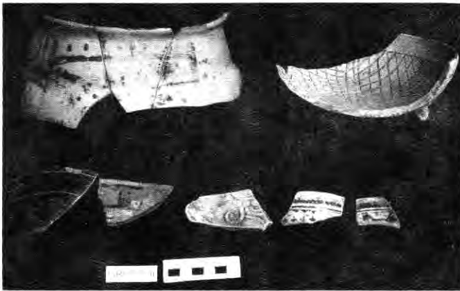
Figura 3. Grupo 11. Cerámicas de tradición costeña. Tipos: 53. Negro sobre Crema Huasteco; 27. Quiahuistlan; 16. Tres Picos; 65. Isla de Sacrificios; 71. Cerro Montoso.