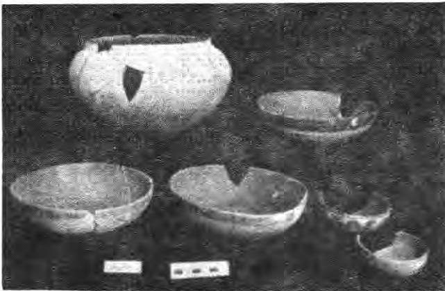
Figura 1. Grupo 1. Cerámicas de tradición local (pasta fina). Tipos: 18. Ollas Caoba Pintado; 9. Naranja Engobado; 10. Naranja y Café a Brochazos; 28. Naranja y Café a Brochazos esgrafiado; 13. Naranja Esgrafiado.