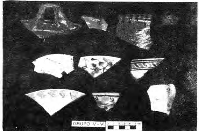
Figura 6. Grupo V. Cerámicas de tradición hispana. Grupo VI. Cerámicas de tradición contemporánea. Tipos: 50. Cerámica vidriada; 52. Cerámica hispana; 51. Loza actual.

ducción de alfarería, representada fuertemente por el grupo I, denominado "cerámica de tradición de pasta fina", conformado por los tipos cerámicos 9, 10, 11, 13, 14, 17, 19 y 28, que posiblemente fueron parte de ajuares suntuarios y de uso común dentro de la población; en estas vasijas de pasta fina se puede ver claramente la influencia de la Costa del Golfo y su estrecha relación con el grupo II.