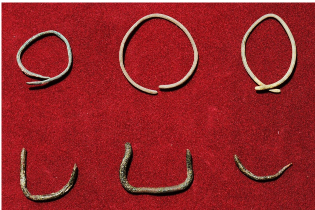
Fig. 3 Aros de metal encontrados en El Nacimiento del Mango y donados al Museo Arqueológico de Ayutla por Nabor Serrano Murguía.