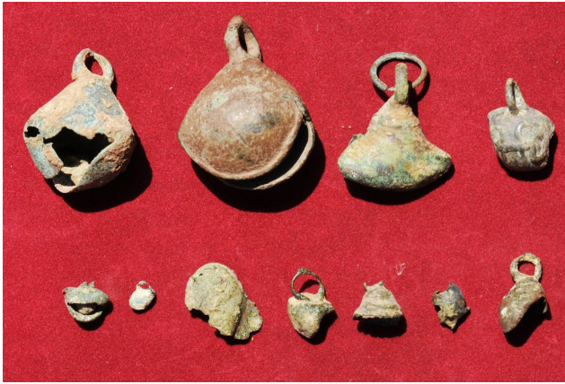
Fig. 1 Cascabeles de metal encontrados en El Nacimiento del Mango y donados al Museo Arqueológico de Ayutla por Nabor Serrano Murguía.