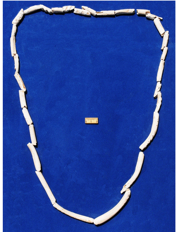
Fig. 4 Collar de cuentas de concha Glycymeris gigantea encontradas en El Nacimiento del Mango y donadas al Museo Arqueológico de Ayutla por Nabor Serrano Murguía.