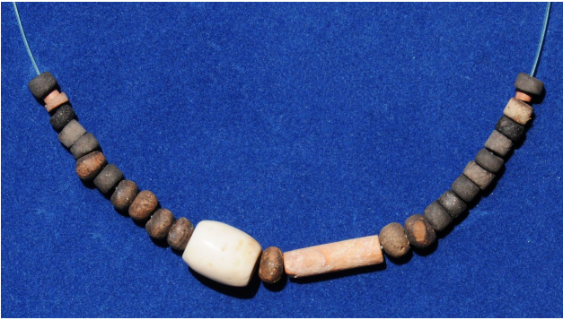
Fig. 6 Collar de cuentas de cerámica y de piedra encontradas en El Nacimiento del Mango y donadas al Museo Arqueológico de Ayutla por Nabor Serrano Murguía.