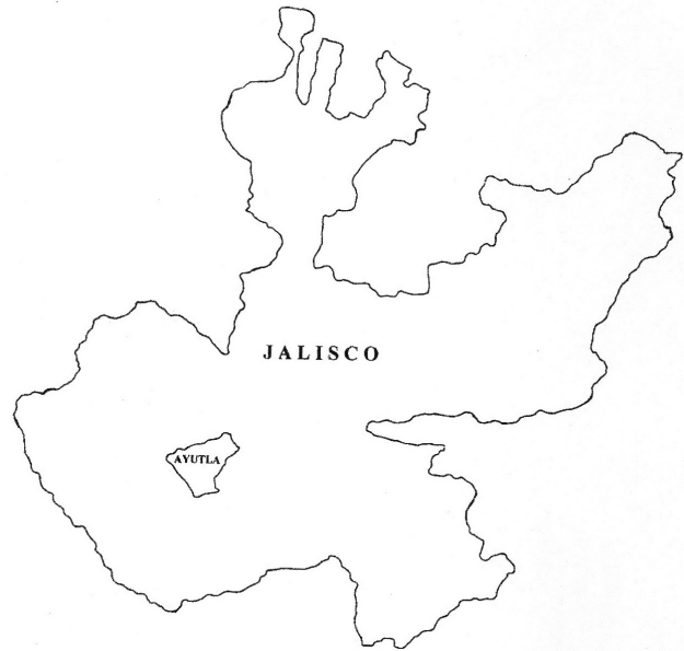
Fig. 7 La localización del municipio de Ayutla en el Estado de Jalisco.

Según Nabor, alrededor del año 1992, él se puso con algunos amigos a hacer un tanque para almacenar agua, a la derecha del ojo de agua y un poco más arriba. En el proceso ellos hallaron una laja de piedra muy grande y debajo de ella encontraron cenizas y un tiesto muy grande de cerámica. Usaron la laja en la construcción del tanque. Se pusieron a excavar en ese lugar encontrando numerosos tiestos, mismos que tiraron abajo por el declive hacia el arroyo. En el año 2000 decidieron limpiar el ojo de agua y construir un dique para detener el agua para abastecer a las vacas. Empezaron con palas a quitar el lodo al pie del acantilado y tirar el lodo abajo hacia el arroyo. Casi de inmediato, uno de ellos encontró un cascabel de metal. Entonces, empezaron a examinar con mucho cuidado el lodo que estaban quitando y así encontraron entre 20 a 30 cascabeles más, además de aproximadamente 30 aros de metal, así como las cuentas que Nabor usó para ensartar los tres collares (véase las figuras