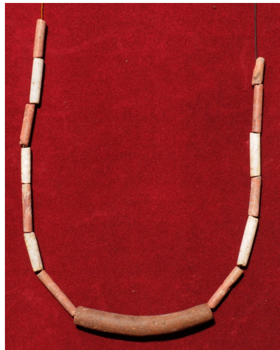
Fig. 5 Collar de cuentas de piedra encontradas en El Nacimiento del Mango y donadas al Museo Arqueológico de Ayutla por Nabor Serrano Murguía.