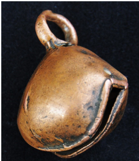
Fig. 2 Cascabel de metal encontrado en El Nacimiento del Mango y en la posesión de Nabor Serrano Murguía.