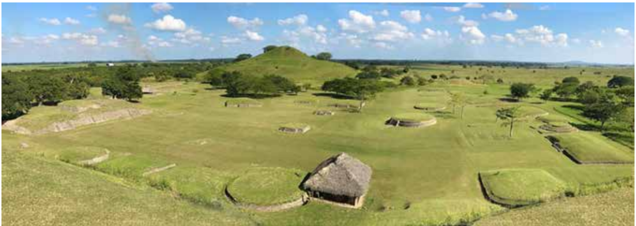
Fig. 5 Grupo A o Plaza Principal de Tamtoc.

La secuencia que proponemos para Tamtoc consiste más en una hipótesis para reordenar la escala temporal de los ciclos o procesos sociales ocurridos en su desarrollo histórico. Debemos admitir que aún se basa en datos escasos, pero sin duda resultará útil para plantear nuevas hipótesis que guíen a una mejor comprensión de los componentes considerados esenciales para la evolución social.