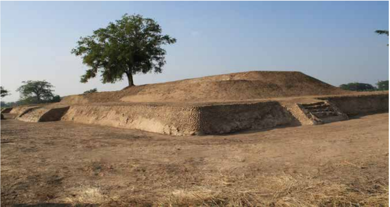
Fig. 4 Sitio Rancho Aserradero.

procedente de una ofrenda al pie de Piedras Paradas, en la plaza principal de Tamtoc. En este trabajo de investigación, de poco más de una década, mostramos nuevas evidencias arqueológicas de los cambios y transformaciones culturales que hemos recuperado tanto en la superficie como en las excavaciones de algunos sitios asentados en la región del Tamaón. Específicamente, nuestra propuesta se basa en contextos arqueológicos, información estratigráfica y fechamientos de C^{14} procedentes, principalmente, de excavaciones en tres sitios del sistema urbano de Tamtoc: Ejido Aserradero, Conjunto Norte Rancho Aserradero y en distintos sectores del núcleo urbano de Tamtoc.