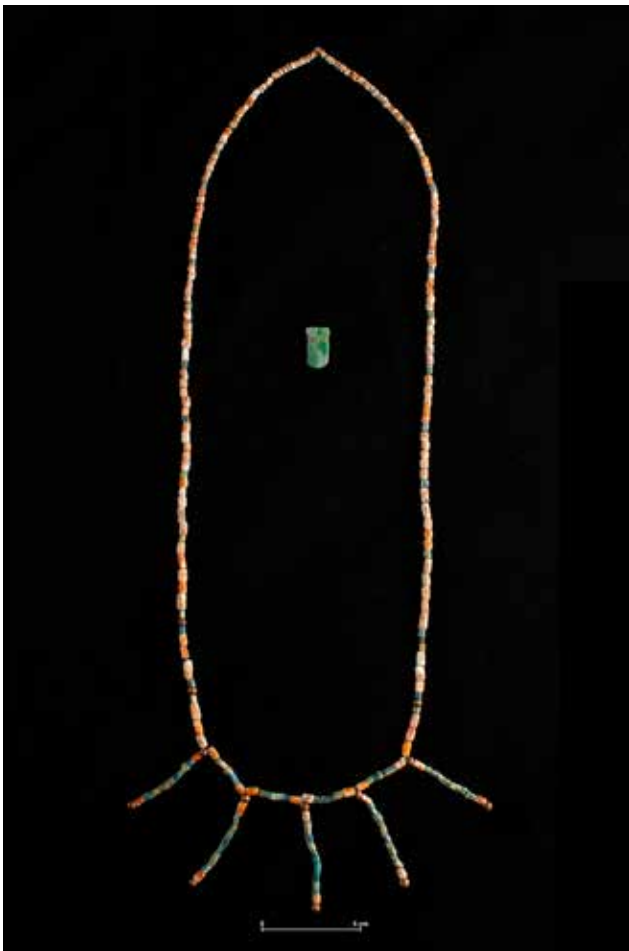
Fig. 6 Collar con cuentas de vidrio tipo Nueva Cádiz de Murano, Italia.

La mayoría de los artículos que se presentan en este número de Arqueología se refieren al último periodo de ocupación de Tamtoc, del que de manera preliminar se puede afirmar que las sociedades urbanas asentadas en los márgenes del río Tampaón estaban organizadas bajo un sistema sociopolítico regional, con entidades urbanas relativamente independientes una de otra. Estos asentamientos organizaban las actividades rituales, económicas de subsistencia, de producción de bienes de intercambio que penetraron en mercados panregionales que abarcaron regiones fuera de la región Huasteca. Es notable el incremento y la intensidad del intercambio de productos provenientes de regiones como la costa del Golfo, la costa del Pacífico, Puebla y la Cuenca de