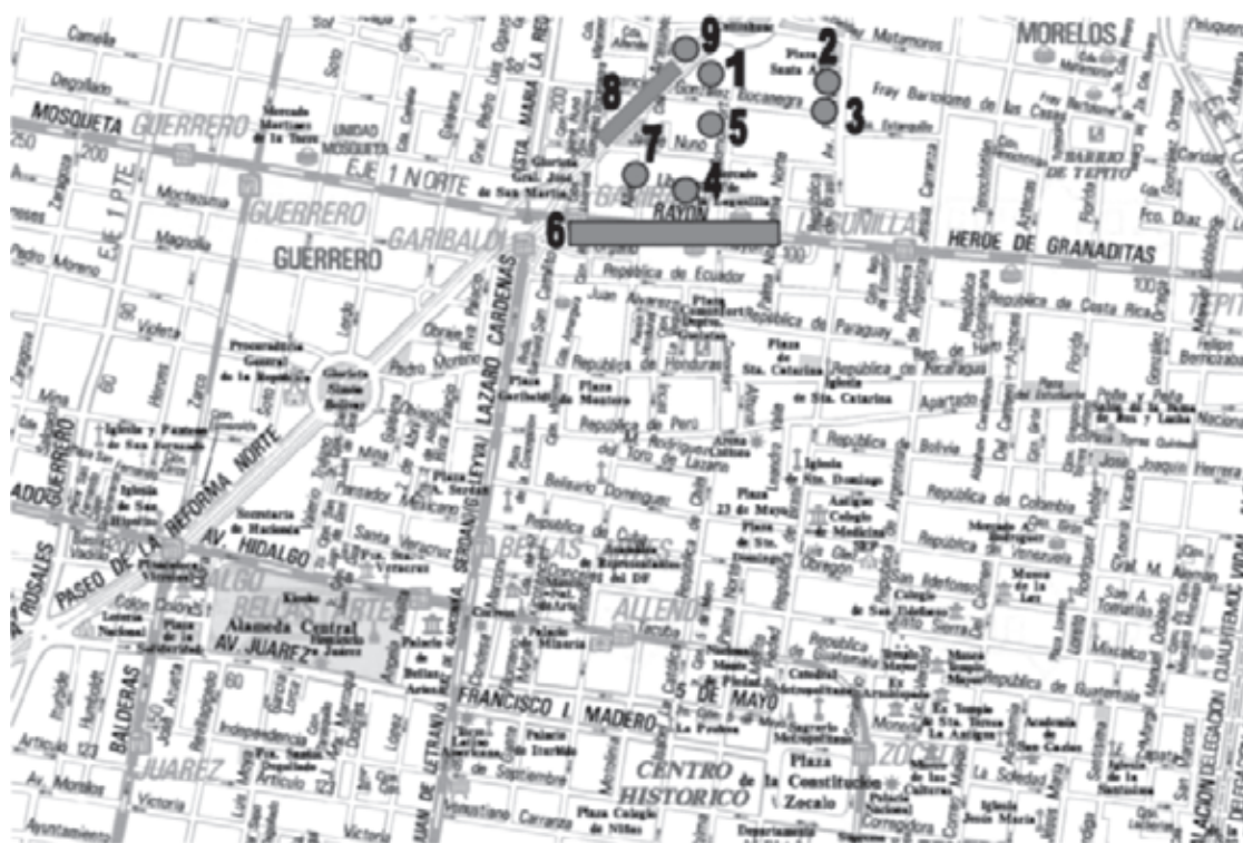
● Fig. 2 Ubicación de las investigaciones arqueológicas realizadas en el área de estudio (mapa tomado de Guía Roji , 1987): 1) Escuela Jaime Nunó. 2) González Bocanegra 73. 3) Línea 8. 4) Línea B. 5) Artesanos y Reforma. 6) Plaza de Santa Ana 12. 7) Libertad 35. 8) Allende 107. 9) Jaime Nunó 47.

posteriormente el horno fue cubierto y el espacio se destinó a casa habitación.