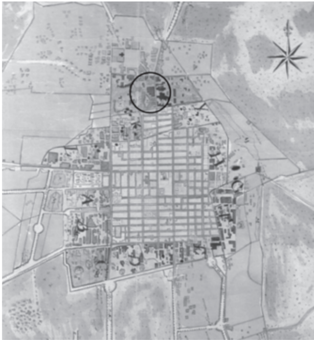
● Fig. 4 Ubicación de la zona de estudio en el plano iconográfico de Ignacio Castera (1793).