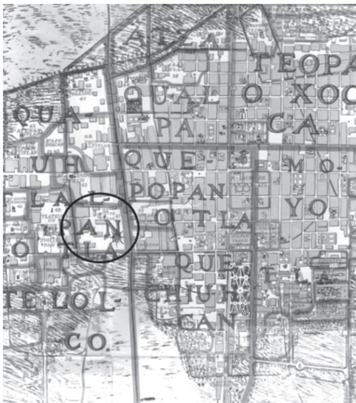
● Fig. 1 Localización del barrio de Atezcapan (tomado de Caso, 1956: plano 1).

Durante el asedio de las tropas españolas a Tlatelolco en 1521, Atezcapan volvió a ser testigo de una batalla (Cortés, 1974: 175, 176; Sahagún, 1975: 847) librada en el camino que llevaba al tianguis y corría por lo que en la actualidad sería la acera poniente de la calle de Allende (Sánchez y Mena, 2001a: 139-143), sitio en el que Alva Ixtlilxóchitl (1975: 471) menciona que “...dejaron una puente mal segada a donde es ahora San Martín barrio de Tlatelulco”, donde Cortés fue herido y casi hecho prisionero por los mexicanos, siendo rescatado por Ixtlilxóchitl —de acuerdo con Sahagún ( op. cit. ) y Alva Ixtlilxóchitl ( op. cit. )— o por Cristóbal de Olea en la versión de Díaz del Castillo (1972: 309) y Cortés ( op. cit. : 176, 177); sin embargo, tomaron varios españoles —entre ellos Cristóbal de Guz-