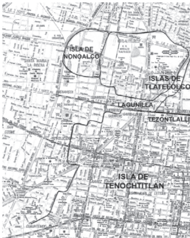
● Fig. 5 Propuesta del límite oriente de la isla de Tlatelolco con base en la información arqueológica.

la primera mitad del siglo XVI cerca de la orilla poniente del Lago de Texcoco, en una zona descrita como terrenos pantanosos o cenagosos[...]" (Calnek, 1992: 157-177).