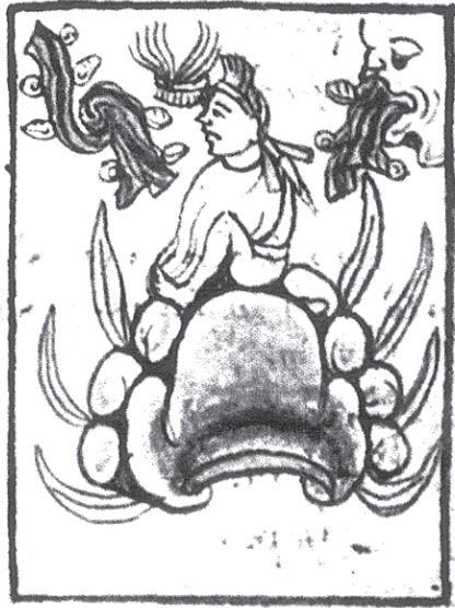
● Fig. 1 El dirigente Xelhuan en el lugar de penitencia: Atlauimolco, Quetzaltepec y Tempatzacapan. En este último se dividirán los nonoualca-chichimeca del territorio conquistado (Kirchhoff et al. , 1976: f. 3r, ms. 54-58, p. 8).

licio: “Luego ya se van los teouaque [...] Luego ya se van los cozcateca [...] Luego ya se van los chalchiuhcalca, los tzoncolihque” (Kirchhoff, 1976:138), los teouaque, los cozcateca y los chalchiuhcalca, “los tzoncolihque”.