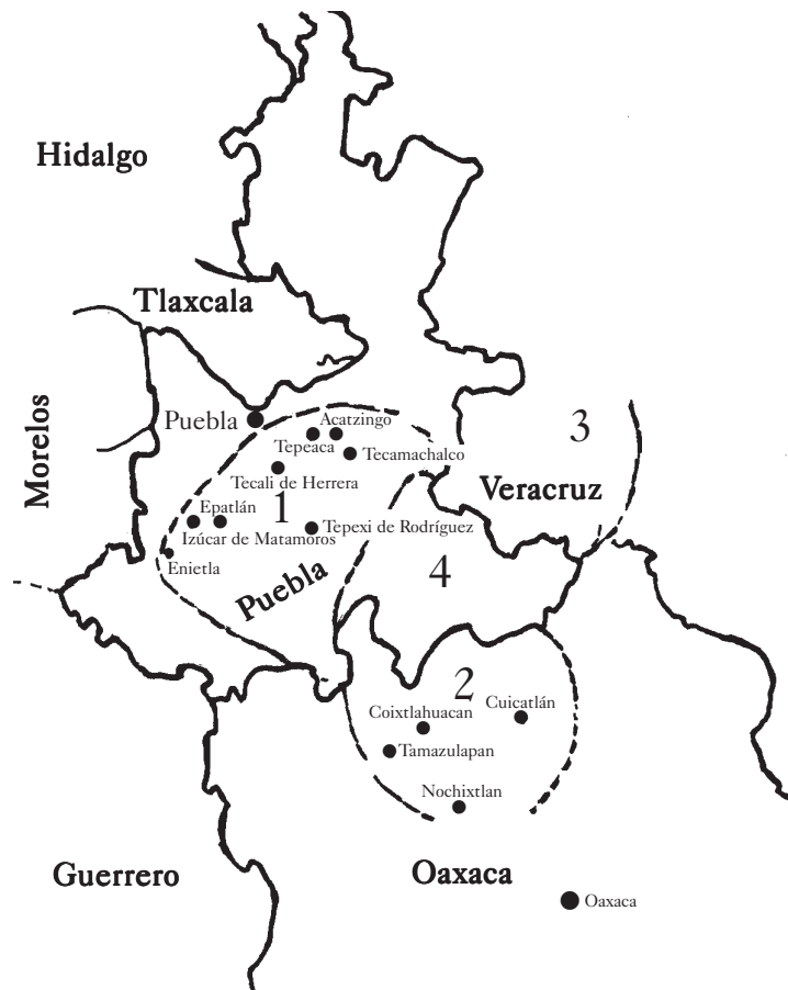
● Fig. 2 Provincia de Tepeaca. 1. Provincia Tepeaca. 2. Provincia Coixtlahuacan. 3. Provincia Veracruz.

Es inconcebible pensar que Tehuacán estuviera formada por señoríos independientes y que no tributaran a los mexicas, ya que su conquista —según las fuentes históricas— les costó trabajo a los aztecas, quienes tuvieron que hacer más de un intento para lograrlo. Fue Moctezuma I (Castillo, 1999:1876-1877) quien en 1456 logró este objetivo, logrando el sometimiento del señorío y la continuación de sus conquistas hacia el sur, principalmente hacia Coixtlahuaca; los trabajos arqueológicos en la zona de Tehuacán demuestran una clara presencia mexicana y una dominación de esta cultura a mediados del siglo XV.