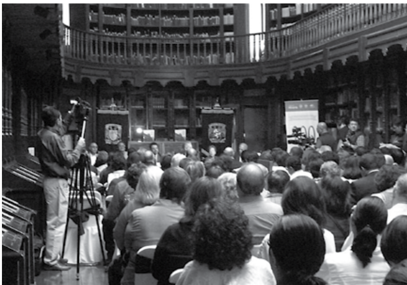
Figura 1. Asistentes a la presentación del libro 200 años del Palacio de Minería. Su historia a partir de fuentes documentales .

dero corpus científico y crítico de la historia en dos vertientes, tanto de la disciplina a que ha estado dedicado, es decir, la ingeniería en diversas ramas, como a la historia de la construcción, no sólo la estética, sino también de la técnica, los materiales y la mano de obra.