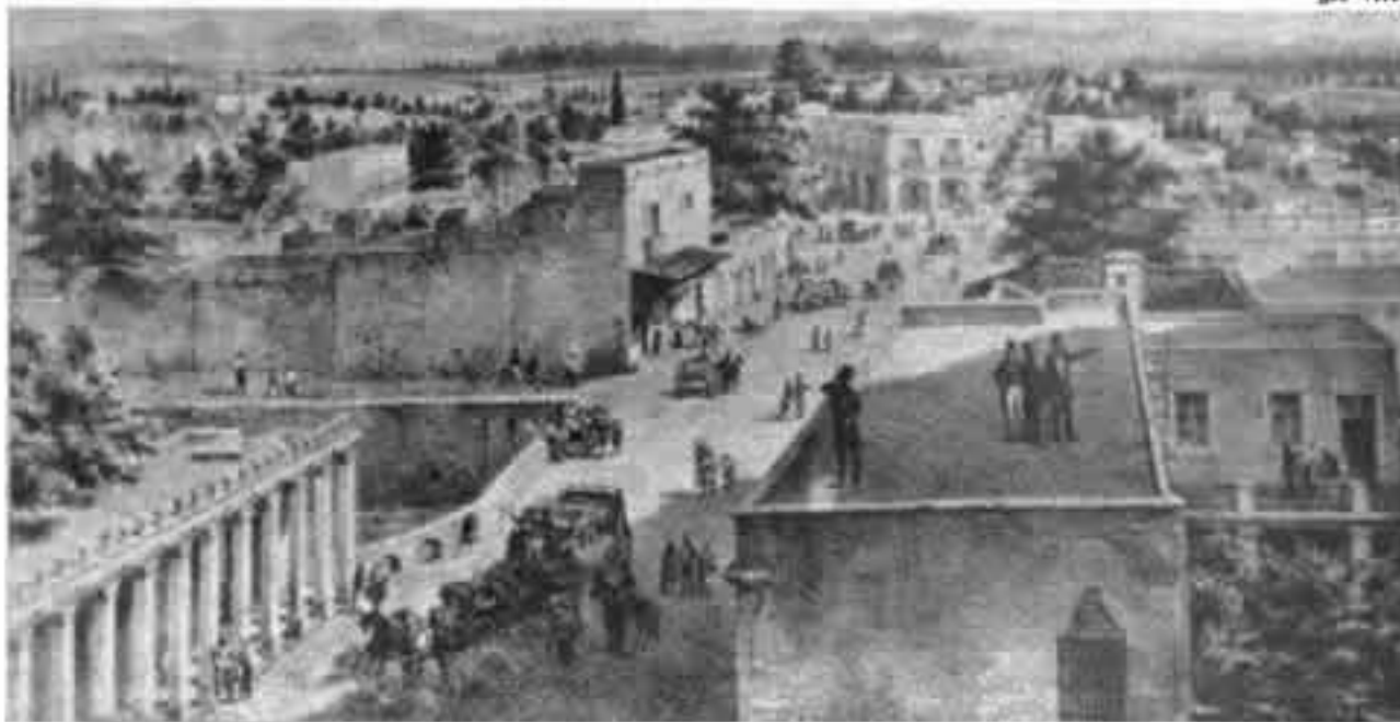
Aspecto de Tacubaya a mediados del siglo XIX.

Desde el siglo XVI, existieron en Tacubaya siete barrios, cada uno con su iglesia. Hoy sólo quedan cuatro y son: la del barrio de Tlaca-teco, la de Zihuatecpa, la de Nonoalco y la de San Miguel Culhuacatzingo. De los otros tres barrios de Tezcacuaco, Huitzilán y Santiago Tequisquihuac ya no quedan restos de sus iglesias.