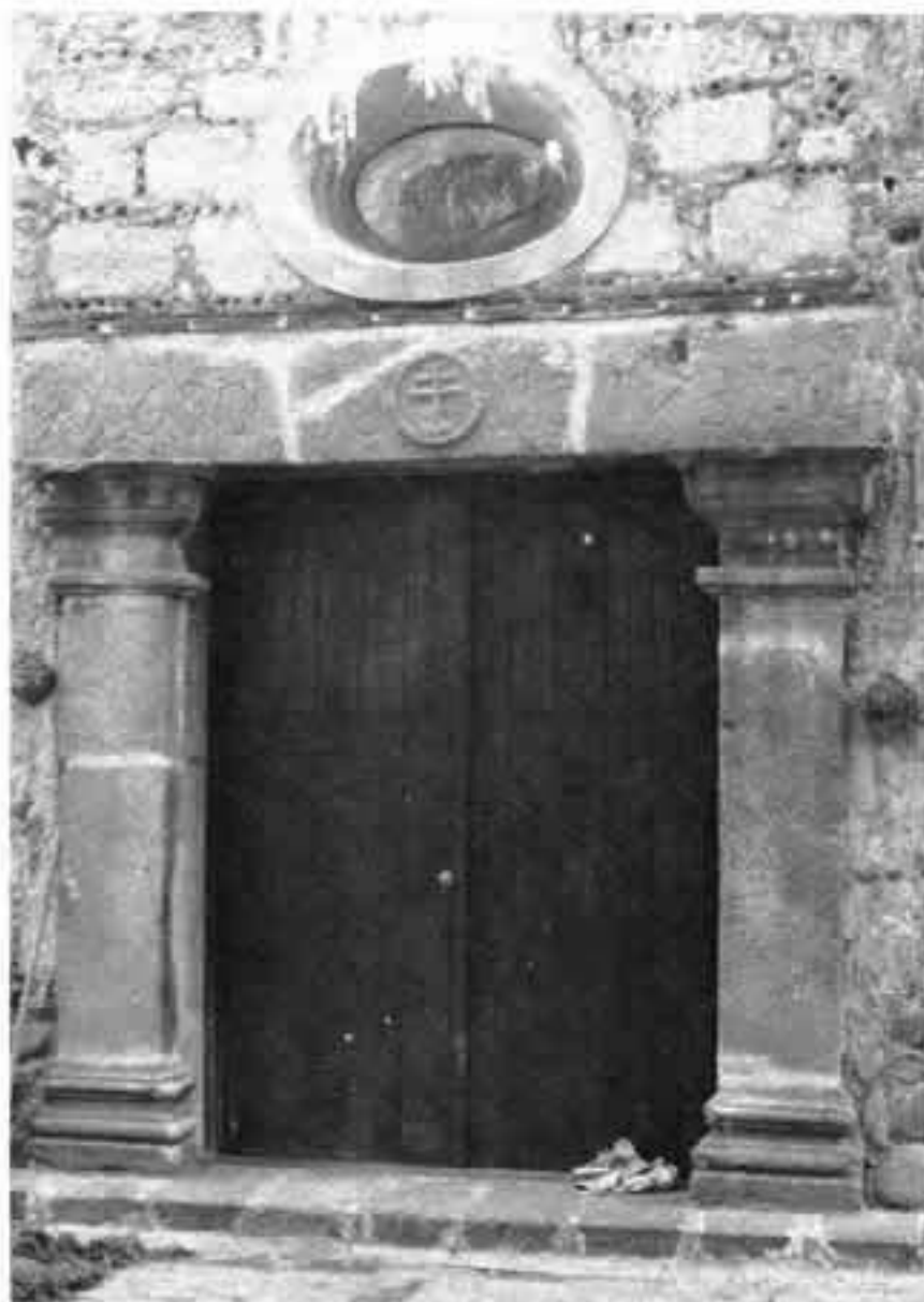
troje de Santa Rosa. Portada con inscripción.

En 1944 fueron declarados Monumentos Coloniales "el molino de Santo Domingo, con