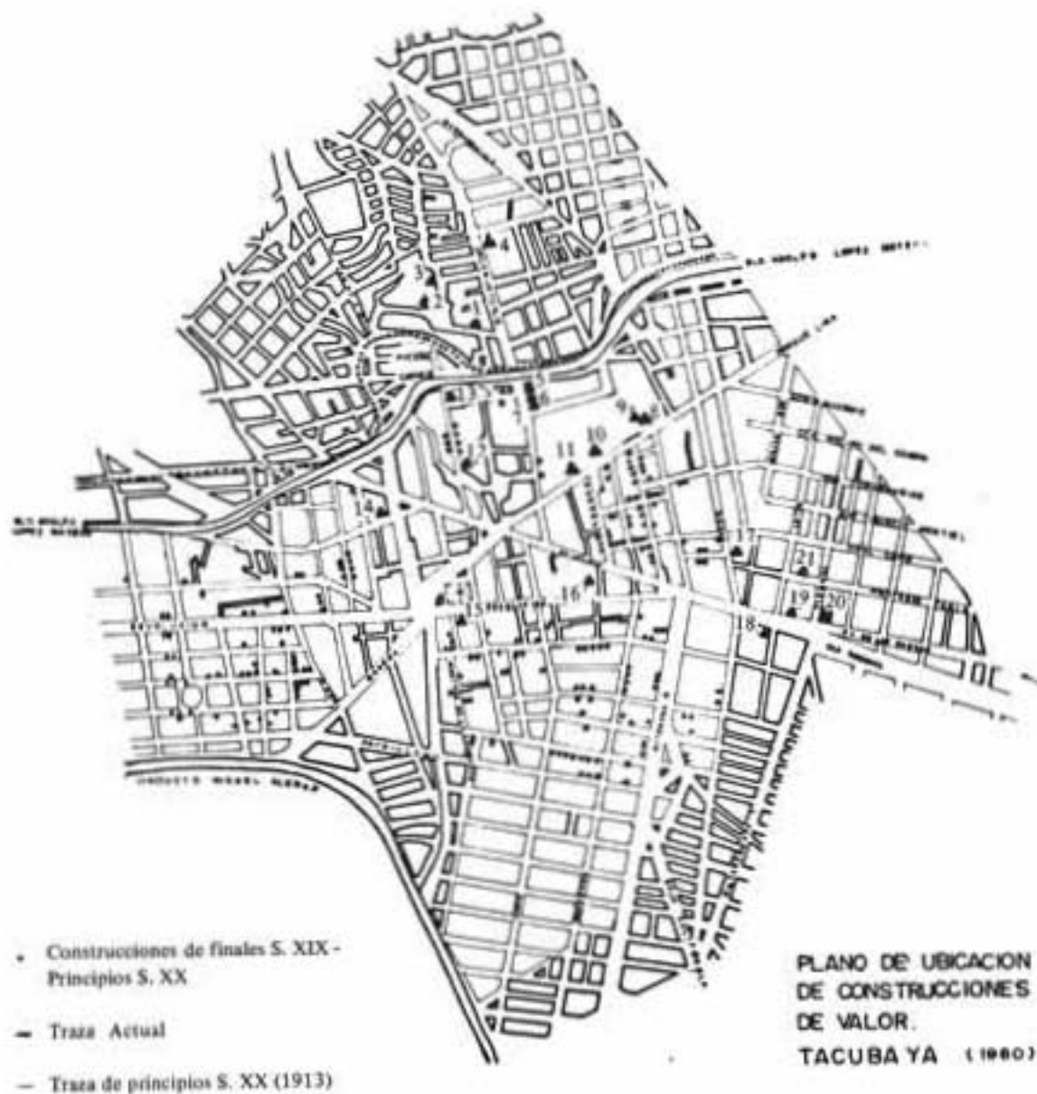
PLANO DE UBICACION DE CONSTRUCCIONES DE VALOR. TACUBA YA (1980)