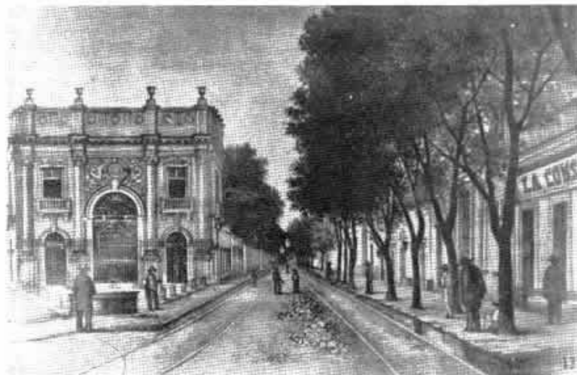
Casa de los Mier y Celis, hacia finales del siglo XIX.

Se tienen noticias de la existencia de otras nueve casas de campo, de las cuales sólo queda el testimonio de los historiadores o bien, el de algunas litografías antiguas, estas son: la casa Jamisson, Beistegui, Escandón, Bardet, Iturbe