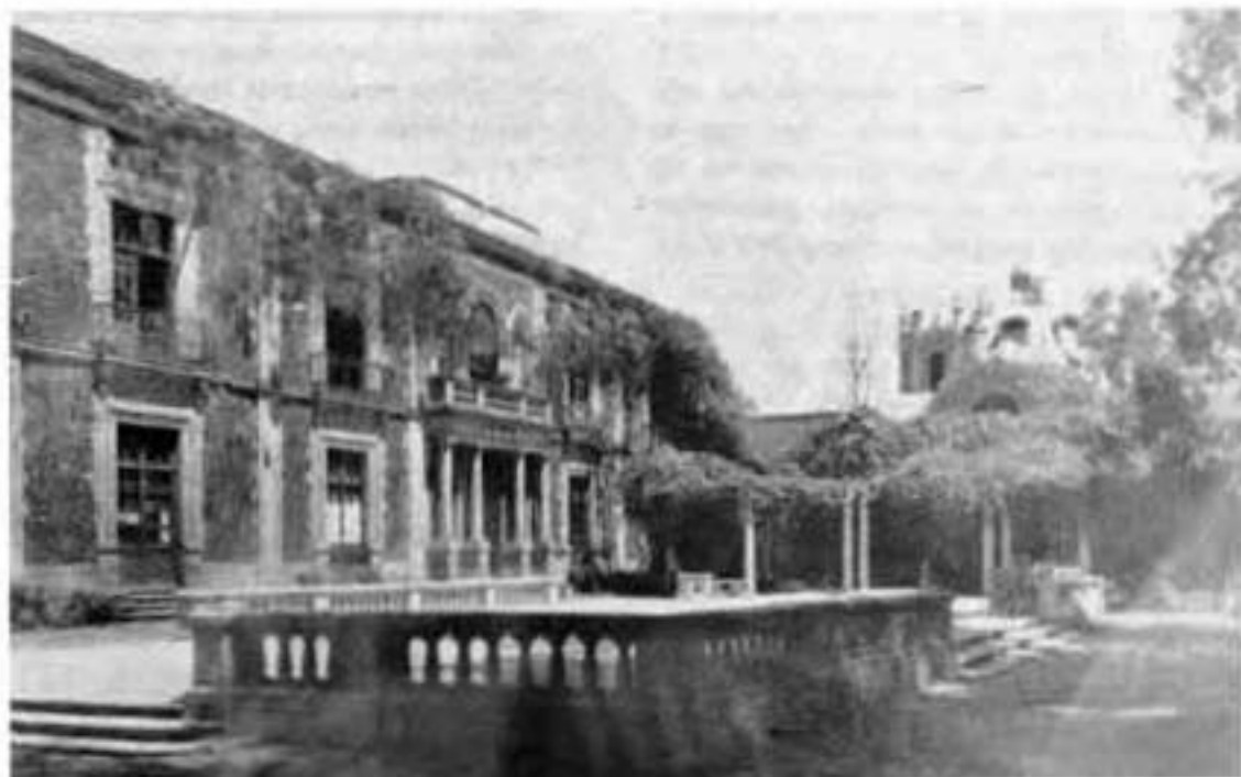
Casa del Parque Lira.

permanecen una barda, la balaustrada de la entrada, una columnata y, en el jardín, una fuente. De las modificaciones del siglo XIX subsiste la casa que ahora constituye la fachada hacia la avenida Parque Lira, que tiene los vanos tapiados, pero conserva un excelente arco encasetonado con decoraciones en fierro que marca el acceso. En el jardín se encuentran dos arranques de arcos, al parecer, también del siglo XIX. Actualmente su uso es de parque público y está inscrito en el catálogo de monumentos coloniales de 1956.