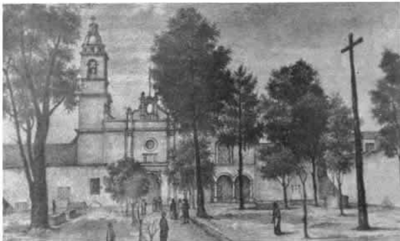
Convento de Santo Domingo, hacia mediados del siglo XIX.

La iglesia, de una sola nave, formada por ocho entrejes y presbiterio presenta coro, está