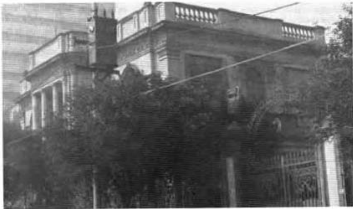
Protasio Tagle núm. 94.

portal de Cartagena, que estuvo ubicado en la avenida Parque Lira número 171 y Jalisco 214, y el mirador almenado que se encontraba en la Alameda de Tacubaya, ubicado en la avenida Revolución número 4 y la calle de 20 de Noviembre.