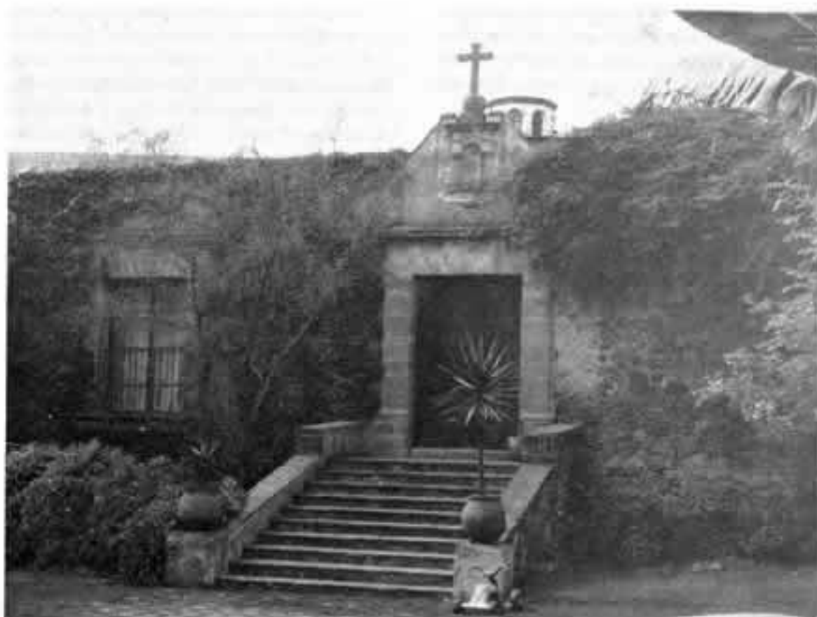
Troje de Santa Rosa.

capilla y troje de Santa Rosa con portada, escalera y nicho, toma de agua y estanque con inscripción, Molino de San José y Molino de Abajo". La zona de los molinos, considerada como típica, ha sido restaurada recientemente convirtiéndose en zona habitacional de calidad; conserva restos de las trojes y de otras construcciones antiguas.