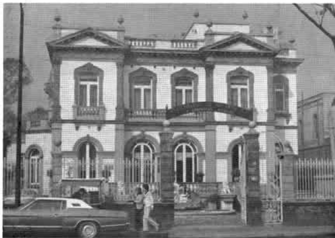
Av. Pedro Antonio de los Santos 84, esquina Tornell.

De los inmuebles que estaban registrados en el catálogo de 1956 han desaparecido los siguientes: la ex-garita de Belén; un nicho que se encontraba en la avenida Jalisco número 128, esquina con Mercado de Rufina número 4; el