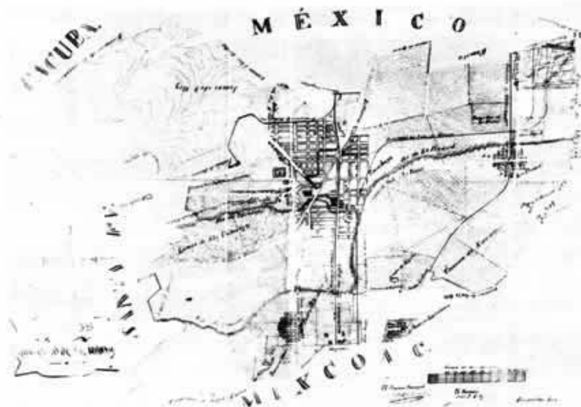
Plano del Municipio de Tacubaya, 1891. Enrique Fabri.

formó parte del Marquesado del Valle de Oaxaca, extendiéndose hasta Coyoacán. Posteriormente comprendió las haciendas de la Condesa, la de la Teja y parte de la de Chivatito. Hacia mediados del siglo XIX se empezaron a fraccionar las haciendas, proyectándose en 1858 la primera colonia en parte de los terrenos de la hacienda de la Condesa. Existe un plano que data de 1897, en el cual se observa que el municipio de Tacubaya se extendía hasta las hoy colonias Nápoles, Narvarte y Doctores. A principios de este siglo estaba for-