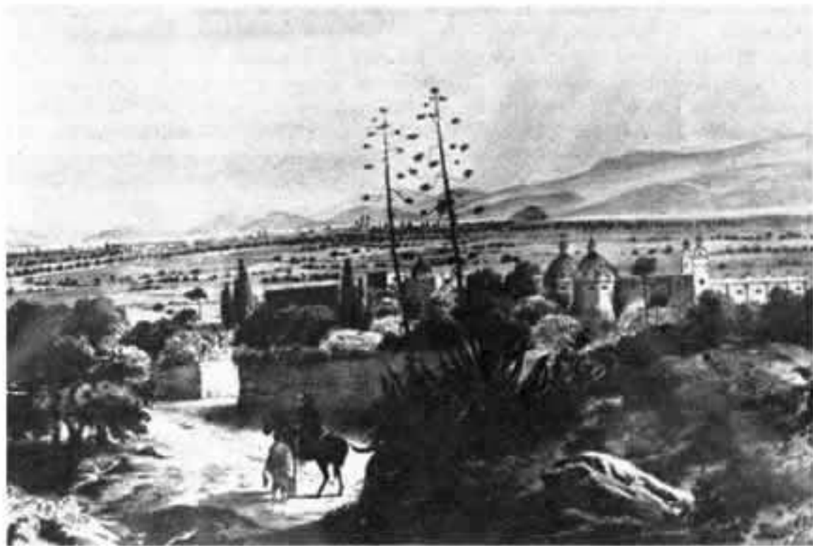
Iglesia de San Diego, Siglo XVIII.

Presenta muchas modificaciones la iglesia en el interior. Consta de una sola nave con cinco entrejes, sobre el crucero se levanta una cúpula. En el lado sur del crucero hay una capilla. Actual-