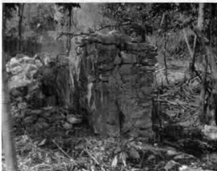
Jamba del acceso norte de la capilla, Xcaret, Quintana Roo.

del árbol de zapote, ocupación que entonces cobró gran auge por la creciente demanda de la industria chiclera.