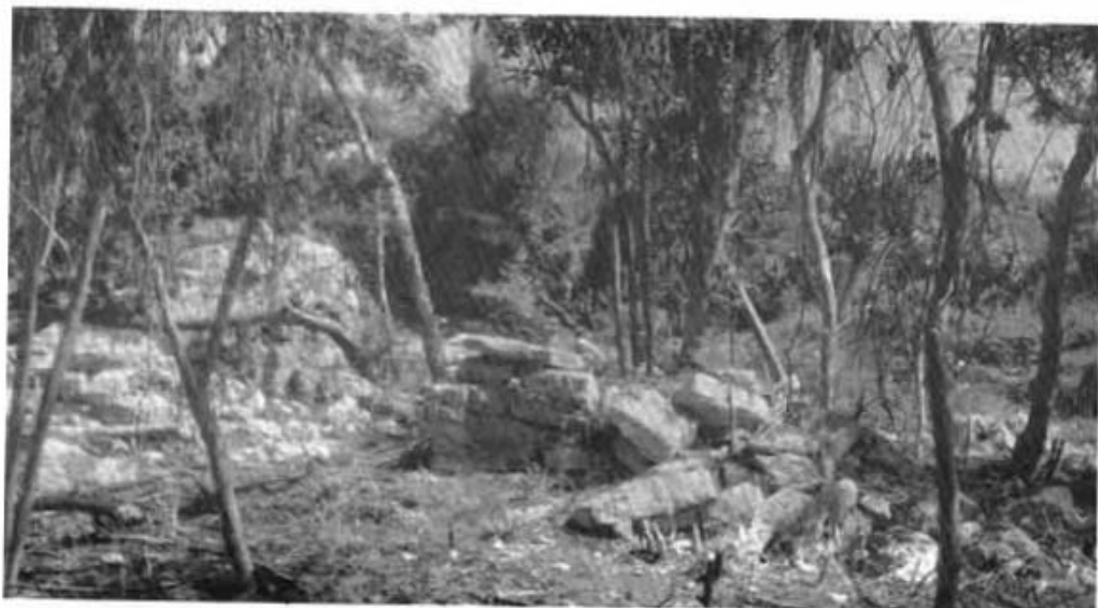
Un aspecto del altar mayor, Xucet, Quintana Roo.

en la costa la tierra adentro como seys ocho leguas y menos ay... 12