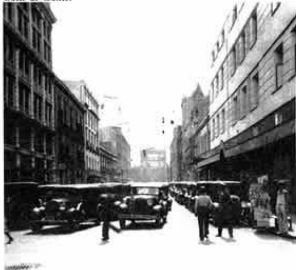
Calle de Gante.

Correo Mayor número 10 (región 06 manzana 003). Correo Mayor número 11 (región 06 manzana 002). Correo Mayor número 12 (región 06 manzana 003). Correo Mayor número 18 (región 06 manzana 020). Correo Mayor número 22 (región 06 manzana 020). Correo Mayor número 30 (región 06 manzana 022). Correo Mayor número 49 (región 06 manzana 040). Correo Mayor número 50 (región 06 manzana 039). Correo Mayor número 57 (región 06 manzana 043). Correo Mayor número 59 (región 06 manzana 043). Correo Mayor número 60 (región 06 manzana 045). Correo Mayor número 62 (región 06 manzana 045). Correo Mayor número 74 (región 06 manzana 072). Correo Mayor número 101 (región 06 manzana 089). Correo Mayor número 105 (región 06 manzana 089). Correo Mayor número 106 (región 06 manzana 088). Correo Mayor número 112 (región 06 manzana 088). Correo Mayor número 116 (región 06 manzana 091). Cruces número 5 (región 06 manzana 045). Cruces número 7 (región 06 manzana 045). Cruces número 8 (región 06 manzana 046). Cruces número 9 (región 06 manzana 045). Cruces número 10 (región 06 manzana 046). Cruces número 11 (región 06 manzana 045). Cruces número 12 (región 06 manzana 046). Cruces número 20 (región 06 manzana 071). Cruces número 21 (región 06 manzana 072). Cruces número 29 (región 06 manzana 076). Cruces número 31 (región 06 manzana 076). Cruces número 32 (región 06 manzana 077). Cruces número 35 (región 06 manzana 076).