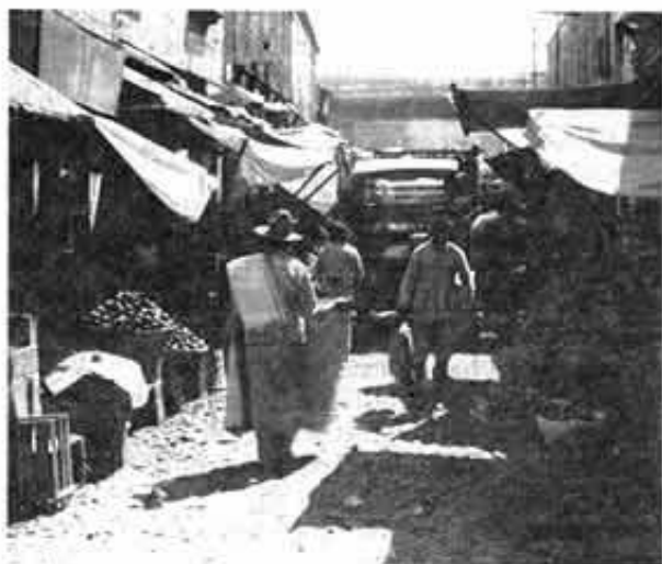
Callejón Santo Tomás.

Que a partir de los primeros años del siglo XIX, en la Ciudad de México han tenido [lugar] algunos de los acontecimientos más importantes de la historia nacional, que van desde las luchas