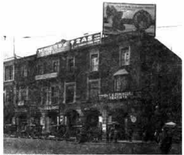
Av. Francisco I. Madero.