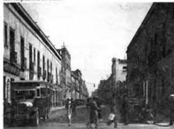
Av. República de Cuba.