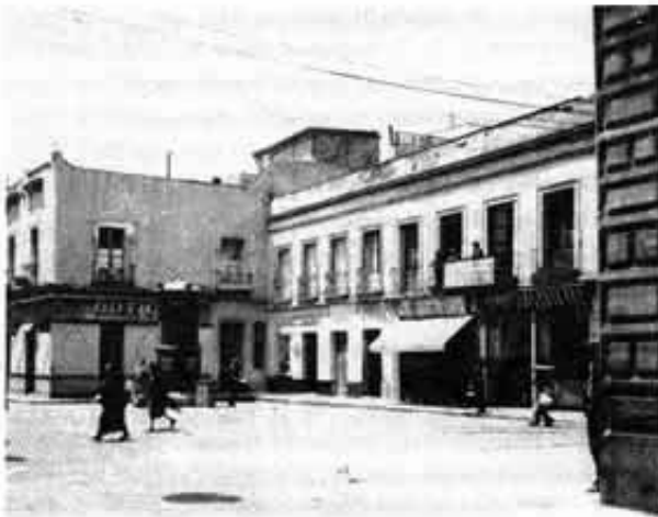
Calle Emiliano Zapata.