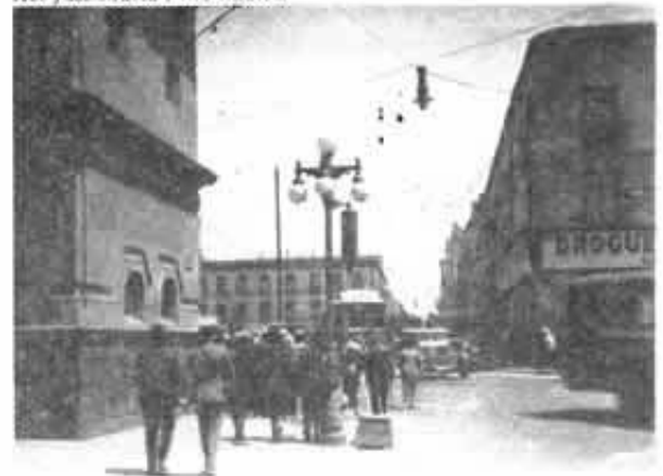
Av. José María Pino Suárez.