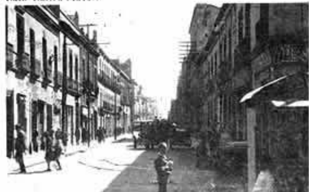
Calle Correo Mayor.