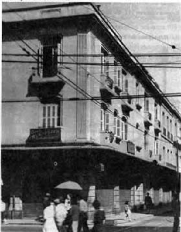
Av. República del Salvador.

República de Brasil número 69, Templo de Santa Catarina Mártir (región 04 manzana 061). República de Brasil números 81 y 85 (región 05 manzana 079). República de Brasil número 87 (región 04 manzana 060). República de Colombia número 2 (región 04 manzana 081). República de Colombia número 4 (región 04 manzana 081). República de Colombia número 5 (región 04 manzana 082). República de Colombia número 6 (región 04 manzana 081). República de Colombia número 7 (región 04 manzana 082). República de Colombia número 9 (región 04 manzana 082). República de Colombia números 12 y 14 (región 04 manzana 081). República de Colombia número 13 (región 04 manzana 082). República de Colombia número 16 (región 04 manzana 081). República de Colombia número 17 (región 04 manzana 082). República de Colombia número 20 (región 04 manzana 081). República de Colombia número 21 (región 04 manzana 082). República de Colombia número 22 (región 04 manzana 081). República de Colombia número 24 (región 04 manzana 081). República de Colombia número 26 (región 04 manzana 081). República de Colombia número 27 (región 04 manzana 082). República de Colombia número 28 (región 04 manzana 081). República de Colombia número 30 (región 04 manzana 081). República de Colombia número 32 (región 04 manzana 081). República de Colombia número 35 (región 05 manzana 127).