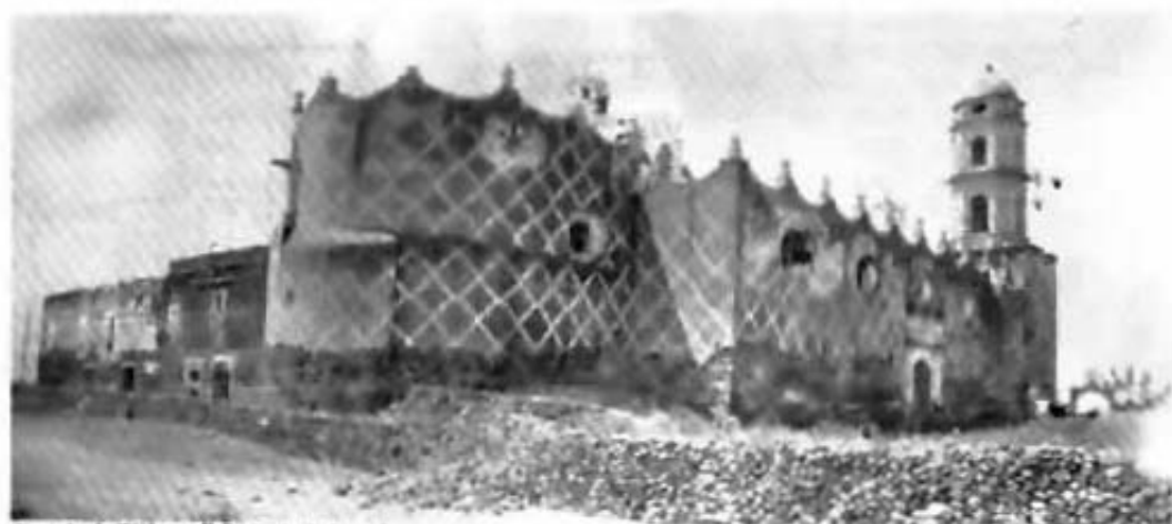
Templo de Tláhuac, D.F. (Fachada lateral)