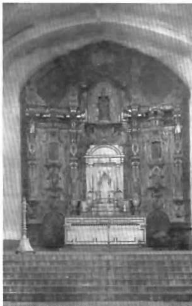
Retablo del templo, Tláhuac, México.