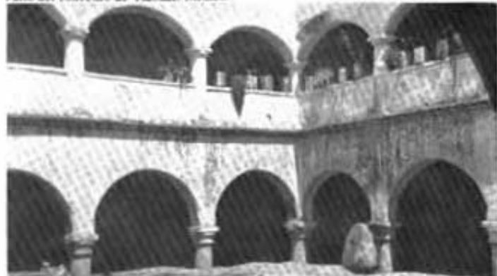
Patio del convento de Tláhuac, México.

Actualmente se encuentra abierta al culto.