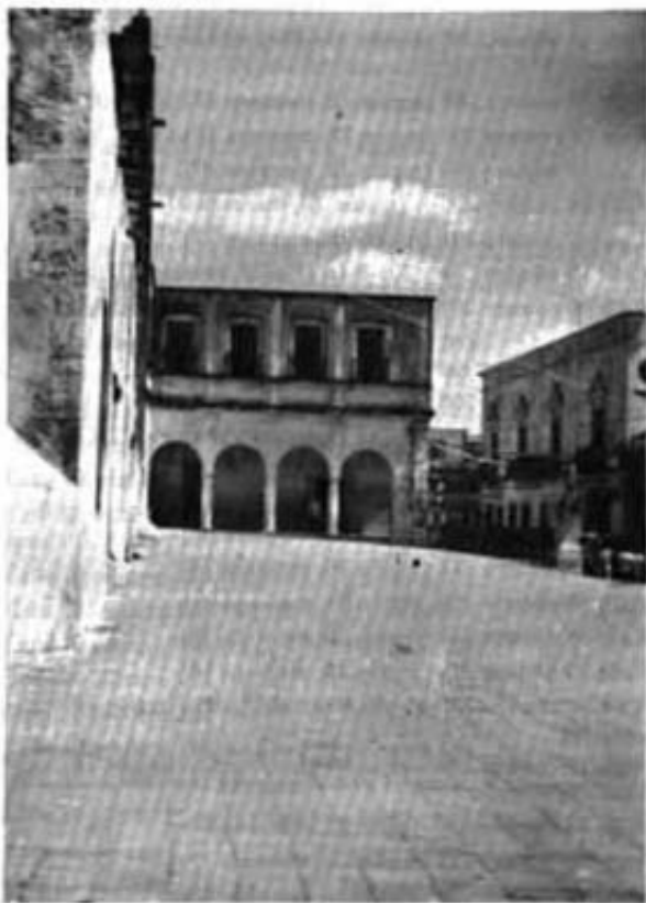
Catedral de Campeche.

Calle 10 número 435 (región 2A, manzana 24). Calle 10 número 443 esquina Corregidora (región 2A, manzana 24). Calle 10 números 449 y 449A (región 2A, manzana 23). Calle 10 número 453 (región 2A, manzana 23). Calle 10 número 455 esquina Ascencio (región 2A, manzana 23). Calle 10 número 467 (región 2A, manzana 22). Calle 10 número 469 esquina Victoria (región 2A, manzana 22). Calle 10 número 473 (región 2A, manzana 21). Calle 10 número 479 (región 2A, manzana 21). Calle 10 número 481 (región 2A, manzana 21). Calle 10-A número 4 (región 3A, manzana 08). Calle 10-B número 26 esquina Cantera (región 3A, manzana 15). Calle 10-B número 37 (región 3A, manzana 22). Calle 10-B número 39 (región 3A, manzana 22). Calle 10-B número 40 (región 3A, manzana 14). Calle 10-B número 42 (región 3A, manzana 14). Calle 10-B número 45 (región 3A, manzana 22). Calle 10-B número 47 esquina F. Zarco (región 3A, manzana 22). Calle 10-B número 49 esquina Calle 41 (región 3A, manzana 21A). Calle 10-B número 53 (región 3A, manzana 21A). Calle 10-B número 55 (región 3A, manzana 21A). Calle 10-B número 57 (región 3A, manzana 21A).