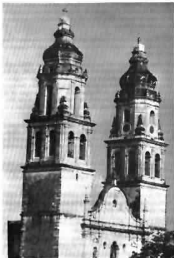
Torres de la Catedral