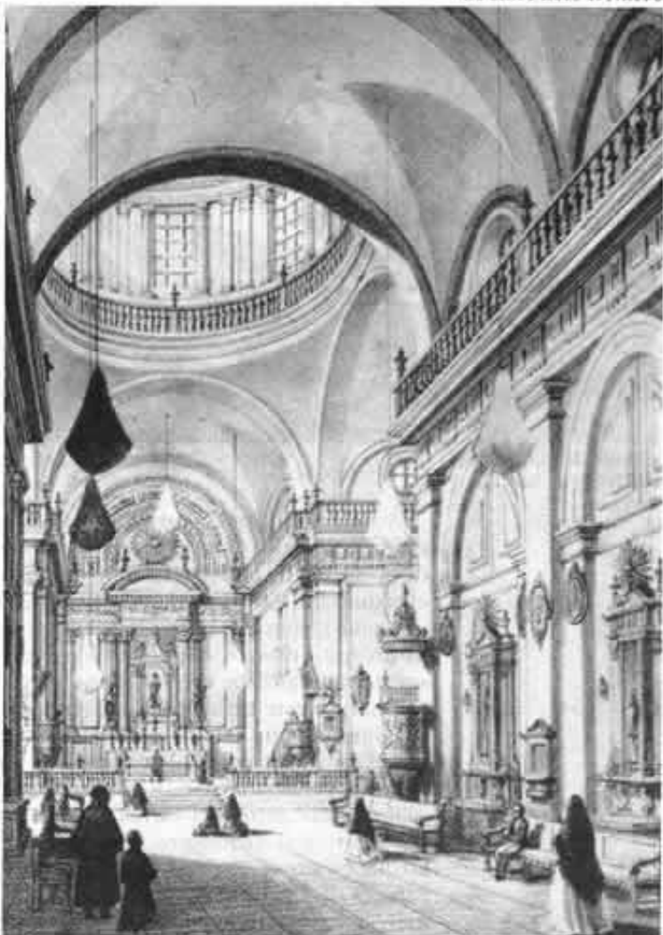
Interior del Templo de San Pablo el Nuevo