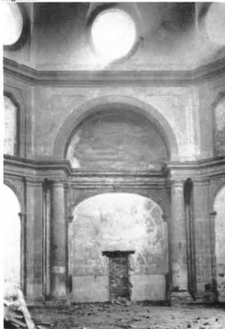
Interior de la Capilla de Santa María Magdalena

antigua, estar mal construída desde el principio y ser necesario echarle todos los techos altos y bajos que estan podridos, y apollillados; y de no hacerlo no se adelanta cosa alguna componiendo unos, y dejando otros que dentro de corto tiempo serán también necesarios, y más cuando en comenzando a moverlo por estar las mezclas ya atequescitadas, y medidas, y ser en gran parte adobe casi será necesario hacerlo de nuevo y así les es mas útil a los interesados en el concurso no se gaste en su composición, se avalue en el estado actual, se venda o se trate de reedificarla de nuevo dándole al destino que mejor parezca. Es cuanto debemos informar a Vuestra Señoría sobre el particular.