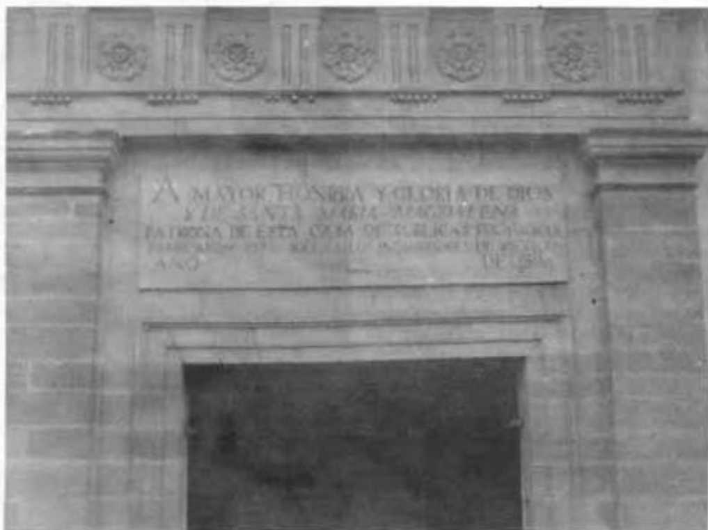
Capilla de Santa María Magdalena, detalle