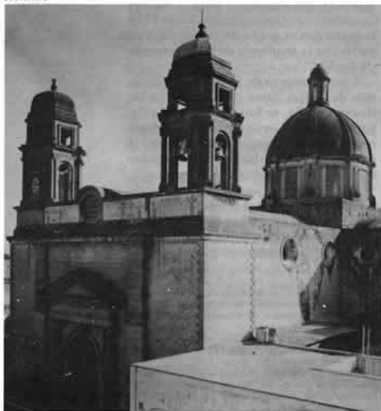
Templo de San Pablo el Nuevo

...la dirección de los estudios de su profesión, al cuidado de los profesores que estuviesen bajo sus órdenes y al adelanto y conducta de los alumnos". 11