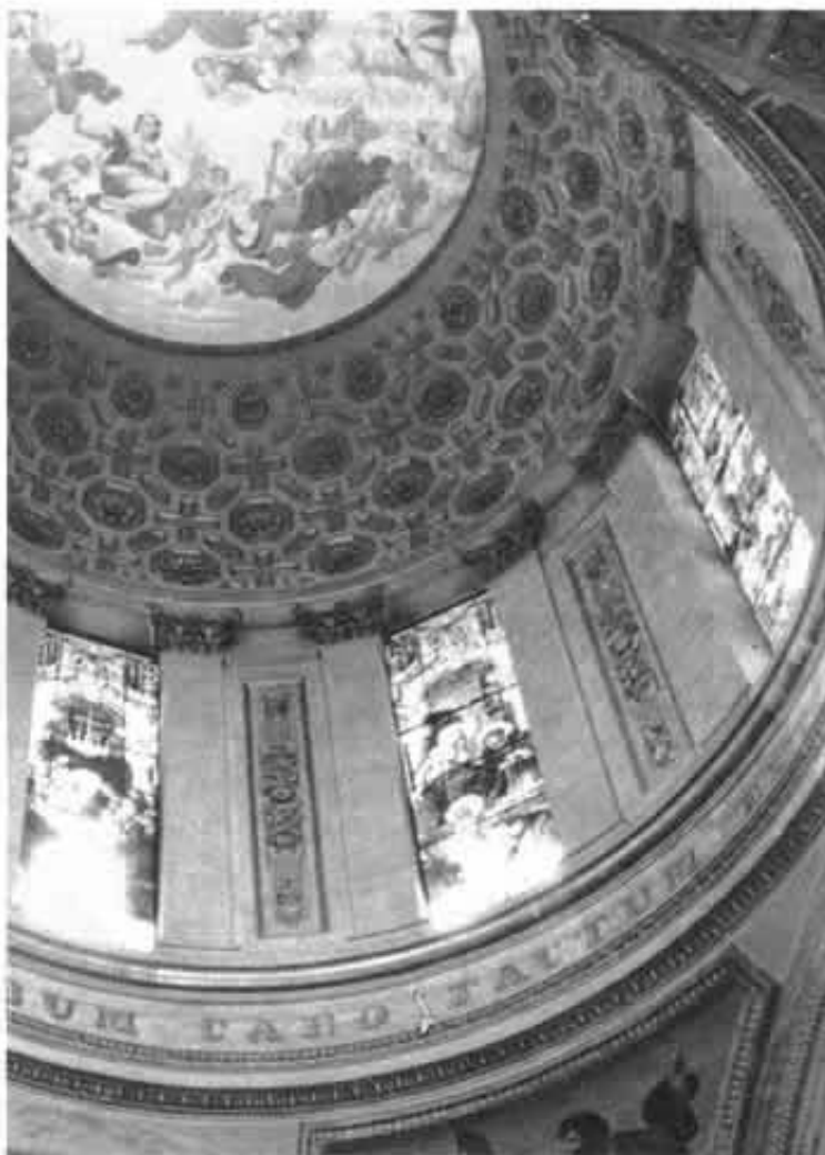
Cúpula de la capilla del Señor de Santa Teresa

Asimismo, trabajó con arquitectos de gran prestigio; como el maestro mayor de la ciudad de México, Ignacio Castera; el arquitecto y escultor Manuel Tolsá, el ingeniero Miguel Costanzó y con José Buitrón y Velasco, arquitecto agrimensor y académico de mérito, entre otros. Al final de este artículo se presenta un documento que data de 1809, año en que González Velázquez trabajó con Buitrón Velasco (véase Documento 3).