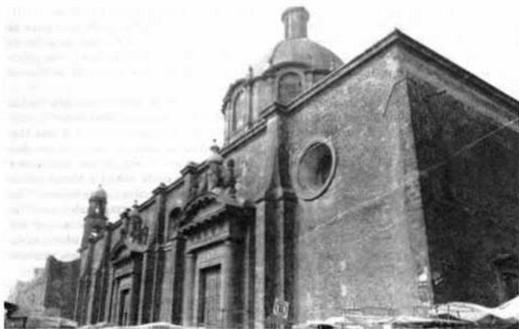
Templo de Jesús María