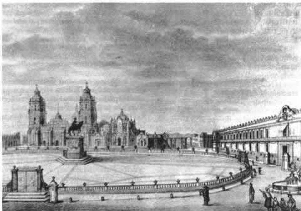
Plaza mayor de la ciudad de México