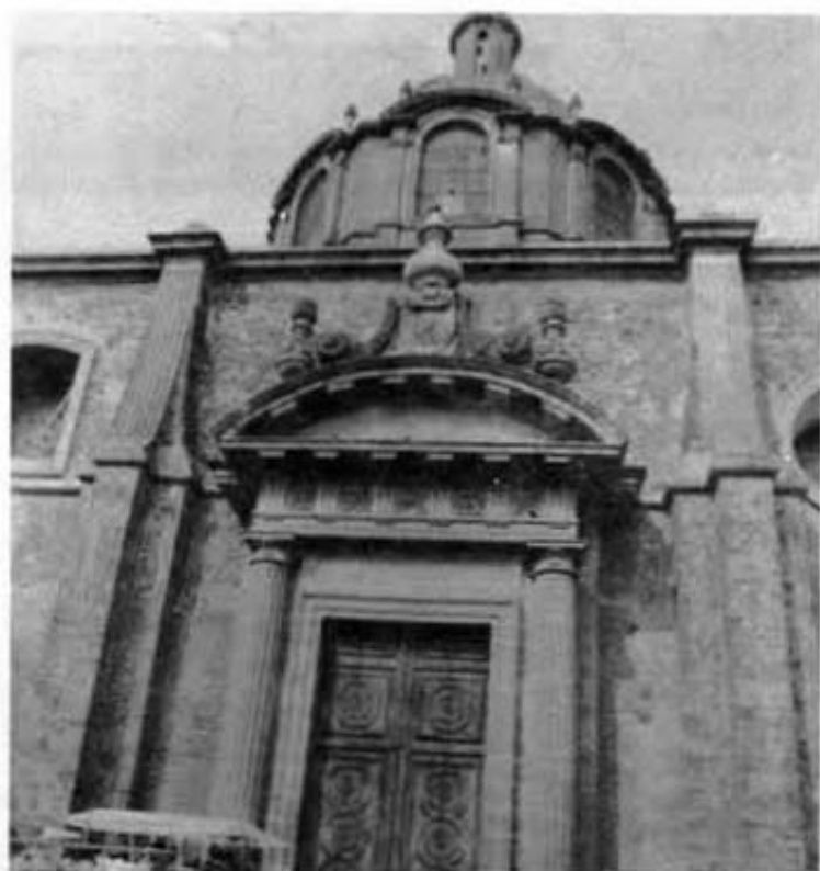
Portada del Templo de Jesús María