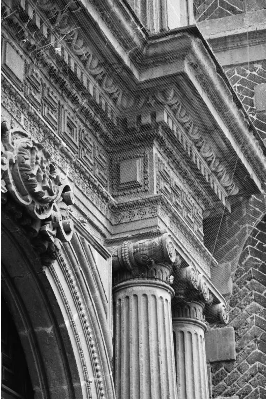
Figura 7. Portada de la Virgen de Guadalupe (detalle del primer cuerpo), iglesia del convento de San Bernardo. Fotografía de Cristina Ratto, 2017.