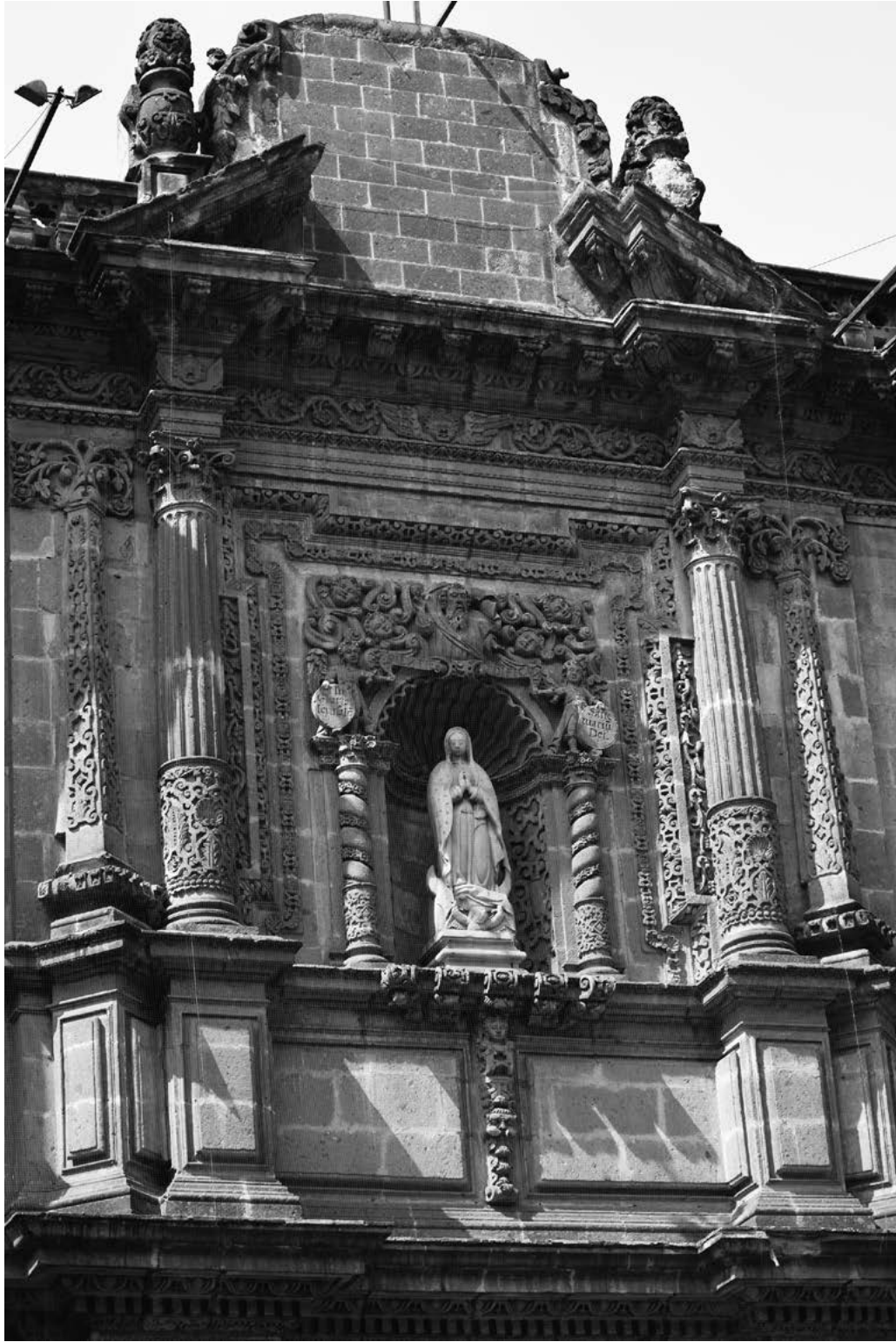
Figura 9. Portada de la Virgen de Guadalupe (segundo cuerpo), iglesia del convento de San Bernardo. Fotografía de Cristina Ratto, 2017.