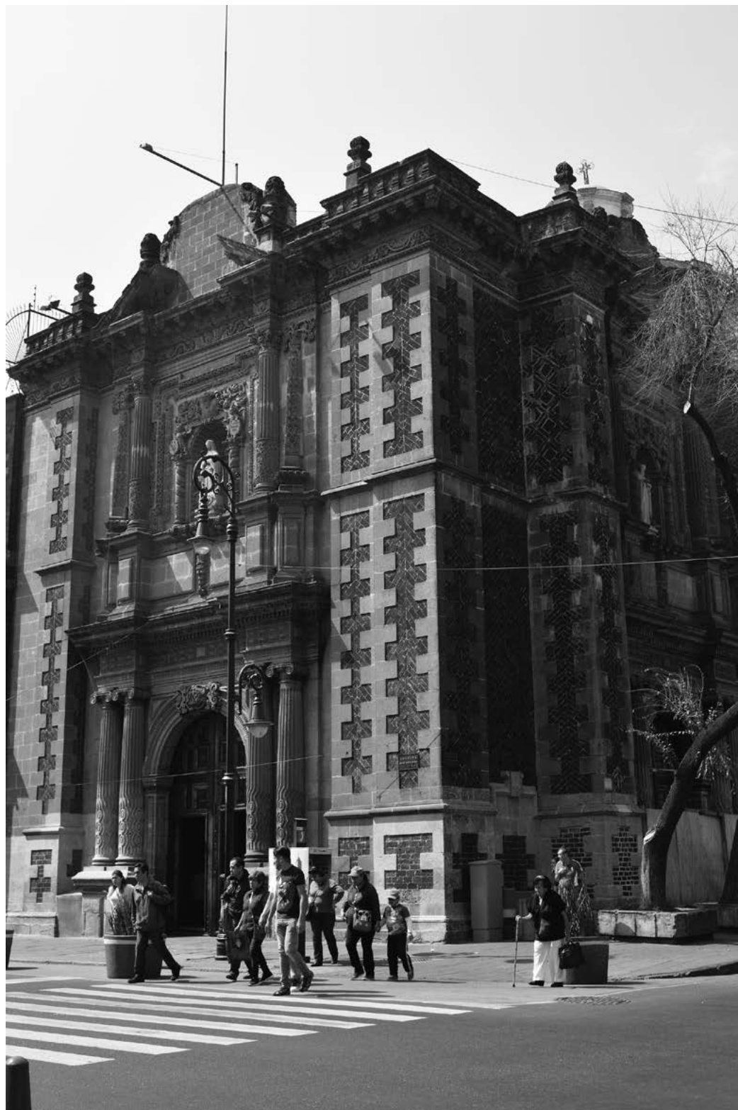
Figura 4. Iglesia del convento de San Bernardo. Fotografía de Cristina Ratto, 2017.