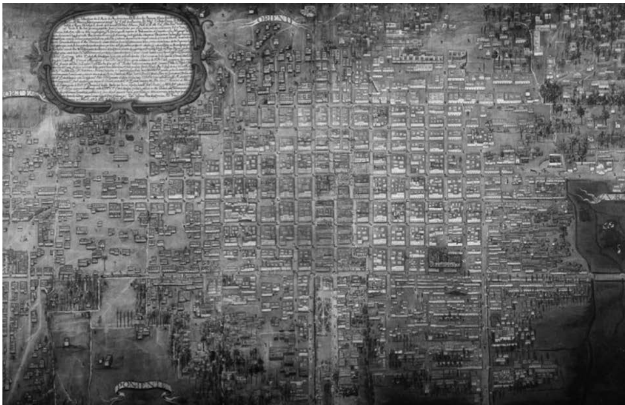
Figura 1. Pedro de Arrieta, Plano de la Ciudad de México , 1737, Museo Nacional de Historia, Castillo de Chapultepec, INAH.

po Aguiar y Seijas, el virrey Conde de Galve y doña Elvira de Toledo —la virreina en su balcón— convi- vieron con una multitud ansiosa y curiosa que des- bordaba las calles y se complacía en el tumulto: