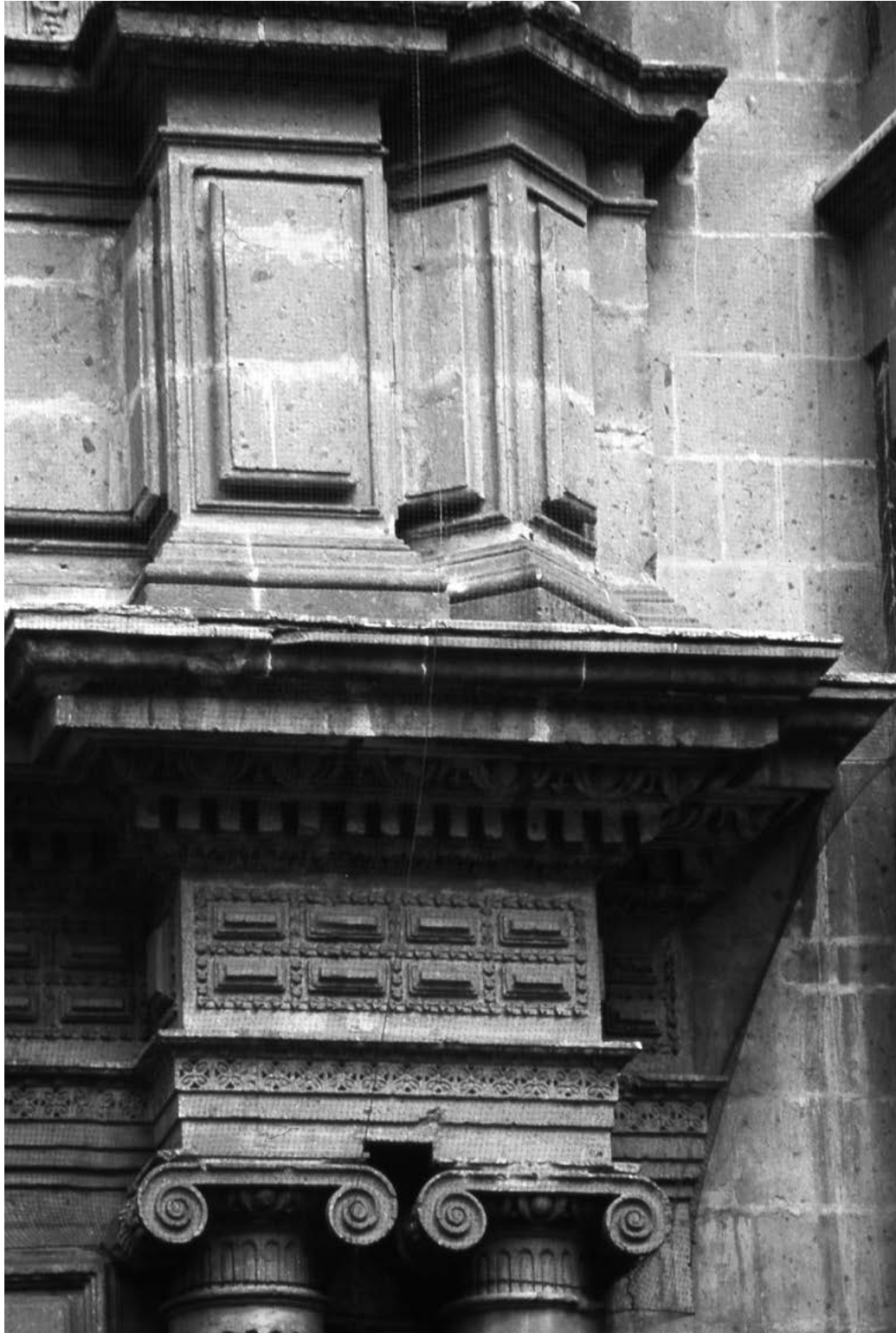
Figura 8. Portada de la Virgen de Guadalupe (detalle del primer cuerpo), iglesia del convento de San Bernardo. Fotografía de Cristina Ratto, 2000.