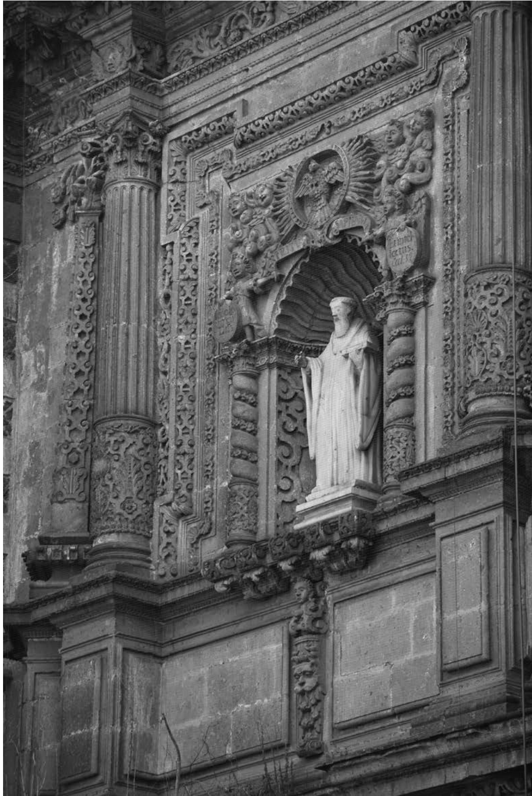
Figura 10. Portada de san Bernardo (segundo cuerpo), iglesia del convento de San Bernardo. Fotografía de Cristina Ratto, 2017.