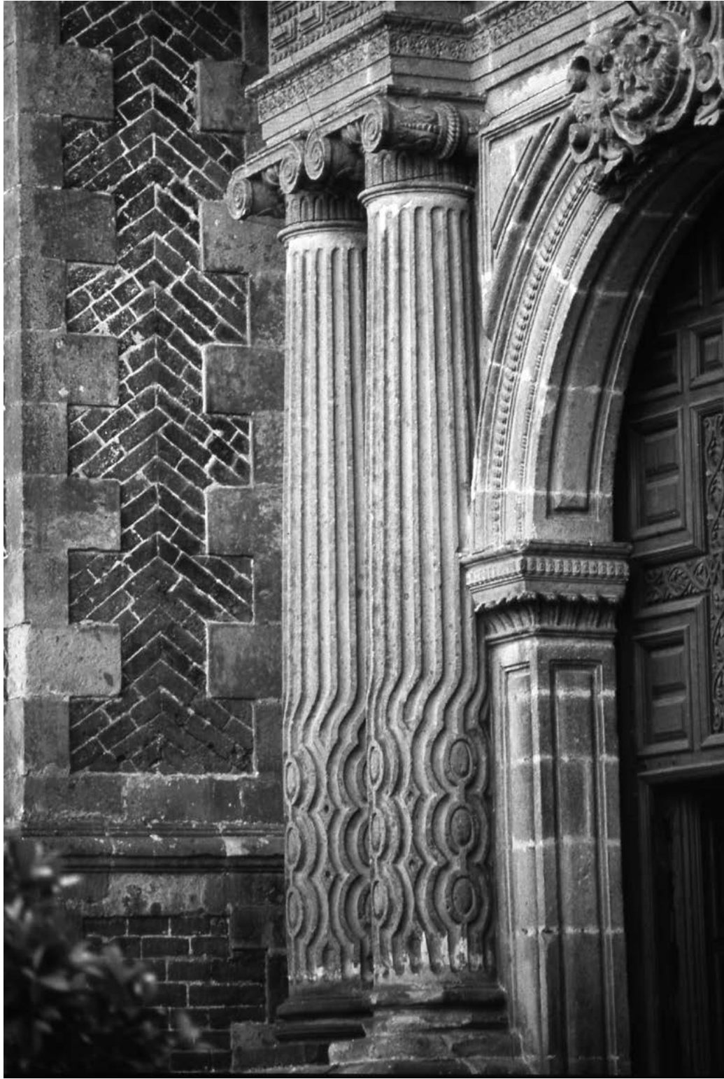
Figura 6. Portada de la Virgen de Guadalupe (detalle del primer cuerpo), iglesia del convento de San Bernardo. Fotografía de Cristina Ratto, 2000.