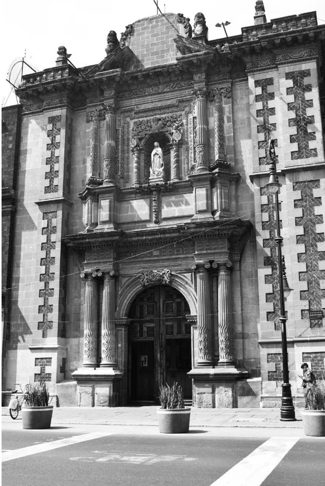
Figura 5. Portada de la Virgen de Guadalupe, iglesia del convento de San Bernardo.