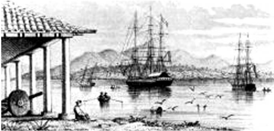
Figura 1. Puerto del Realejo de la Posesión.

Fue visitador de Guatemala hacia 1576, y ese mismo año envió una Carta Dirigida al Rey Felipe II ; 2 ese documento destaca por referir gran parte de las lenguas que se hablaban en la actual América Central durante el siglo XVI. 3 Su nombre se asoció al de Diego López de Trujillo en Honduras, conquistador y colonizador de la provincia de Tegucigalpa, desde el Cabo Camarón hasta el río San Juan.