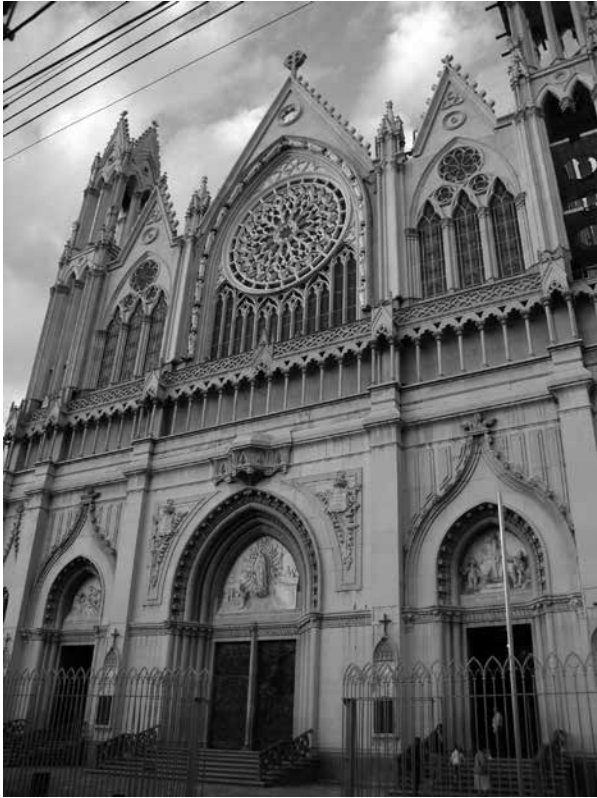
Figura 4. Imagen de la fachada principal del templo del Sagrado Corazón de Jesús, en León, 2010.