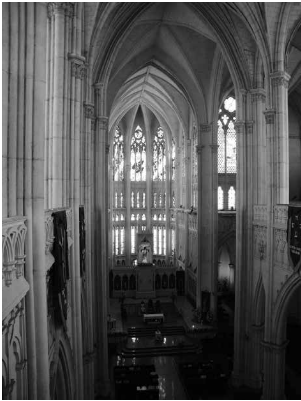
Figura 2. Imagen de la nave central del templo del Sagrado Corazón de Jesús, en León. 2010.

Jalisco, las torres góticas de la catedral de Guadalajara, proyecto del arquitecto Manuel Gómez Ibarra y realizadas entre 1849 y 1854; la imitación de una de esas torres, construida en 1872 en la parroquia de Santa María de la Purificación en el Real de Minas de Guachinango; 30 la torre campanario construida en 1875 en la parroquia de San Francisco de Asís de Ahualulco de Mercado; 31 la especie de torre nártex de la iglesia parroquial de San Luis, Obispo de Toluca, en San Luis de Sayotlán en el municipio de Tuxcueca, terminada en 1885; 32 la portalada de la fachada del templo del Sagrado Corazón de Tecolotlán, datada entre 1868 y 1894, 33 y la fachada