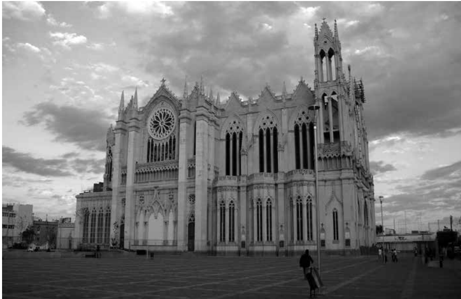
Figura 1. Vista exterior del templo del Sagrado Corazón de Jesús, en León. 2010.

coincidir con la expansión de no pocas ciudades y con los procesos de embellecimiento de éstas. 6 Los templos religiosos aprovecharán esa circunstancia para dotarse de plazas en sus frentes redefiniendo la idea del atrio y abriendo el templo a la mirada de los ciudadanos, que también son feligreses. Una apertura que recalca el carácter protagónico como factotum social de la Iglesia.