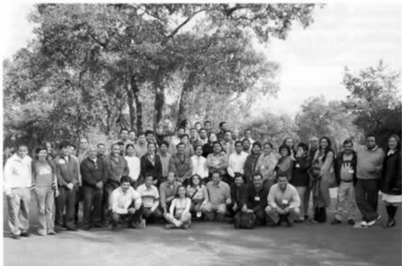
Grupo SICHAL.

fue analizado por los integrantes del taller a fin de plantear propuestas y dar referencias operativas para la aplicación de los planes concernientes a la reubicación de terminales urbanas, transporte turístico, construcción y manejo de mercados minoristas para reubicar ambulantes, propuestas de vivienda en áreas de valor patrimonial y en relación