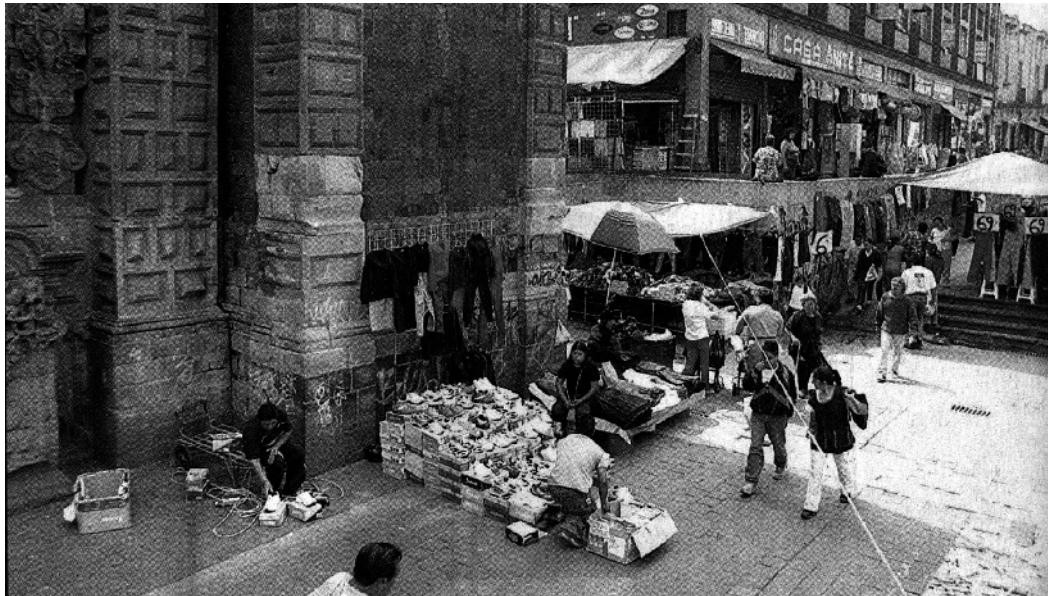
Figura 2. Portada del templo de la Santísima Trinidad, invadido por vendedores ambulantes. Periódico Reforma , Sección B, sábado 19 de febrero de 2005.