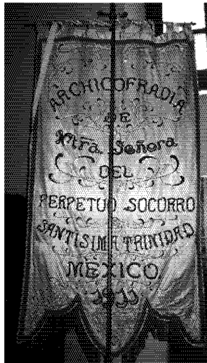
Figura 7. Estandarte de la archicofradía de Nuestra Señora del Perpetuo Socorro. Seda rosa con bordados de plata.