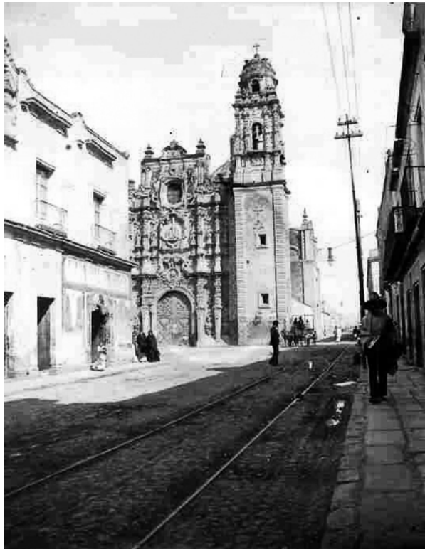
Figura 1. Templo de la Santísima Trinidad (1892), ciudad de México.

E n el corazón de la ciudad de México, hacia el oriente, destaca el templo de la Santísima Trinidad, el cual desde 1567 —año de su fundación— ha desafiado la ruina y los siglos para dejar su impronta en las instituciones religiosas que ha alojado en sus recintos, pero también en el corazón de todos aquellos vecinos que tuvieron por morada a su barrio.