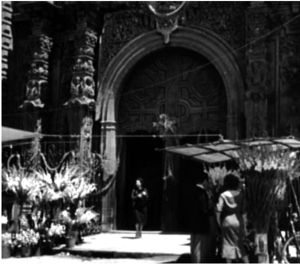
Figura 4. Foto de cuando se filmó la película De carne somos (entre 1952 y 1955), proporcionada por un vecino de la Santísima Trinidad, a quien agradecemos su atención.

poder civil: el 25 de junio de 1856 Miguel Lerdo de Tejada promulgó la Ley de Desamortización de los Bienes de la Iglesia; el 30 de julio del mismo año se expidió el correspondiente reglamento, en donde se dio noticia de que la Santísima