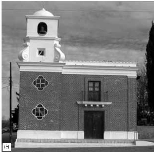
Figura 4. (a) Ures y (b) Bacoachi, que a pesar de las modificaciones contemporáneas que presentan, conservan elementos de ladrillo característicos de la misión franciscana.

la pérdida de las temporalidades a partir de la expulsión de los jesuitas, las dificultades para mejorar la precaria situación de las misiones, así como las muchas necesidades que no se han podido mantener, primero por la irregularidad y después por la supresión del sínodo, y reitera lo deplorable del sistema misional, así como la enorme necesidad de reparar las pérdidas de las temporalidades: “pero que no se encuentra sugeto que los administre, con el celo, pureza, y legalidad que corresponde”.