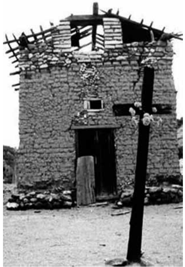
Figura 6. Presento esta iglesia de fábrica jesuita con la finalidad de dar idea del aspecto físico en que pudo estar la obra material a la entrega a la orden franciscana; se pueden distinguir diferentes deterioros provocados por la falta de protección superior, inferior y de todos los muros que incluso ya ocasionaron un fuerte debilitamiento de éstos, además de provocar grietas superiores y socavar en la parte inferior del muro, a pesar de la primitiva protección a base de piedras. Iglesia de San Antonio Guazarachi, Chihuahua. Misiones Coloniales de Chihuahua.

ro— éstas eran la parte fundamental y germen de la evangelización, y en mi opinión reflejo de la sustentabilidad y progreso de la misión. A continuación presento tres descripciones del siglo XVIII, que considero aportan otros elementos importantes para su seguimiento, la primera corresponde a la