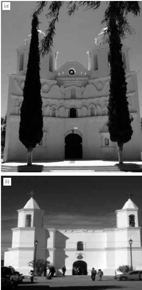
Figura 5. (a) Bacadeguachi y (b) Aconchi, donde se aprecian elementos curvilíneos en fachadas y una ornamentación interior con un sello muy particular, que seguramente fue realizada por mano de obra indígena.

ro— éstas eran la parte fundamental y germen de la evangelización, y en mi opinión reflejo de la sustentabilidad y progreso de la misión. A continuación presento tres descripciones del siglo XVIII, que considero aportan otros elementos importantes para su seguimiento, la primera corresponde a la