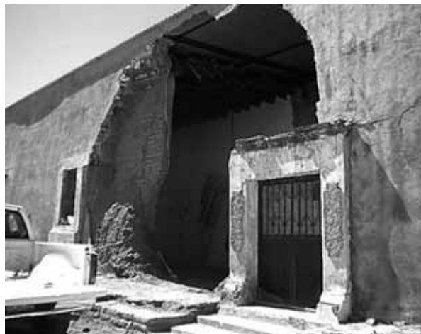
Figura 3. En la iglesia de la misión de Ónavas, localizada en la Pimería Baja, se observan actualmente deterioros irreversibles y alteraciones a la fábrica de la iglesia. Fotografía Centro INAH Sonora, Ónavas, noviembre de 2011.

En general la fábrica era con base en muros de adobe, en varios casos recubiertos de ladrillo y acabado de estuco; por lo que se refiere a las cubier-