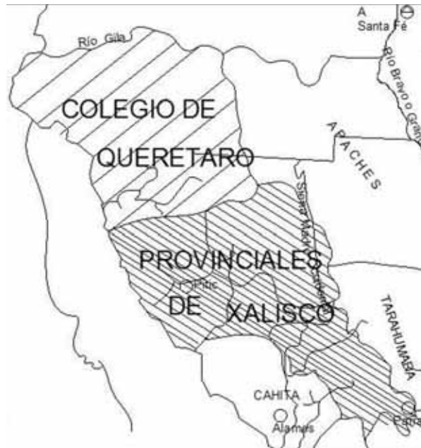
Figura 1. La entrega y distribución de las misiones jesuitas y sus temporalidades a la orden franciscana se realizó de la siguiente manera: la Pimería Alta bajo la tutela del Colegio de Propaganda Fide de Queretaro y la Pimería Baja y Opatería para los franciscanos de la provincia de Jalisco.