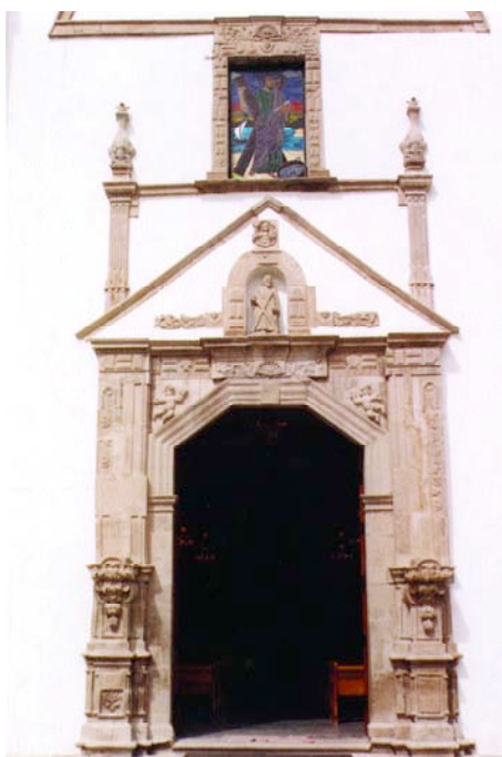
Coordinación Nacional de Monumentos Históricos Fotografía de Carlos Segura

Bajo el amparo de las casas conventuales franciscanas funcionaron las cofradías, asociaciones de fieles que proporcionaban a sus miembros o integrantes asistencia o “seguridad espiritual y ayuda”, además, de encargarse de la organización de fiestas y de la cooperación para cubrir los gastos de sepelio; suministraba “servicios de auxilio para los enfermos pobres, de cuidado de los ancianos, de atención a niños huérfanos...”. 13