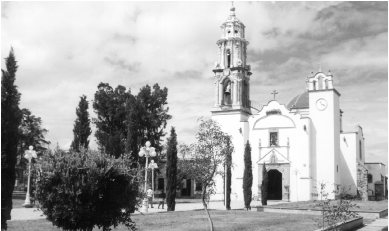
Coordinación Nacional de Monumentos Históricos Fotografía de Carlos Segura

Al igual que los conventos franciscanos de San Antonio de Padua de Texcoco, San Miguel de Coatlinchán y el de San Luis Huexotla, construidos en tierras del antiguo señorío de Texcoco, el de San Andrés Chiautla tuvo su biblioteca o “librería”. Los libros que conformaban su acervo fueron los siguientes: