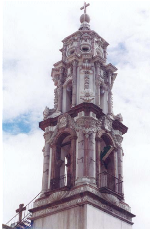
Coordinación Nacional de Monumentos Históricos Fotografía de Carlos Segura

adorno de la parroquia”, 26 esto nos lleva a considerar que ya se habían emprendido obras en el templo o estaban por efectuarse. Desafortunadamente, el documento no es muy claro al respecto. Es de esperar, que la consulta de otros fondos documentales nos permita ampliar y profundizar sobre la historia del templo.