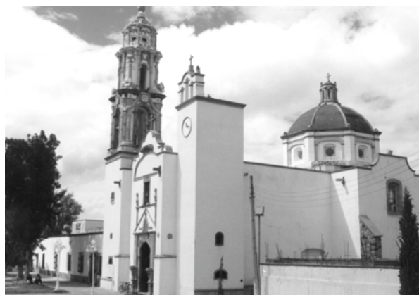
Coordinación Nacional de Monumentos Históricos Fotografía de Carlos Segura

No dan otra cosa los dichos barrios, [ni pollo, ni] almuerzo, sino sólo lo dicho. 5