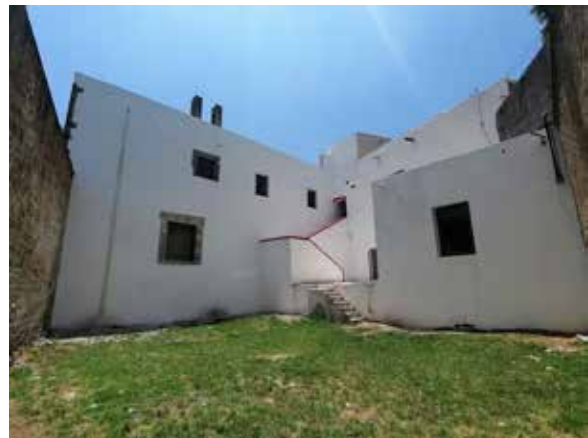
Antiguo hospital de la Encarnación. Antes y despues.

De las 53 obras que serán financiadas por FONDEN, en el 2018 fueron contratadas 23 obras por adjudicación directa, con un monto total de: $9,691,623.95 todas ellas concluidas en su totalidad al día de hoy.