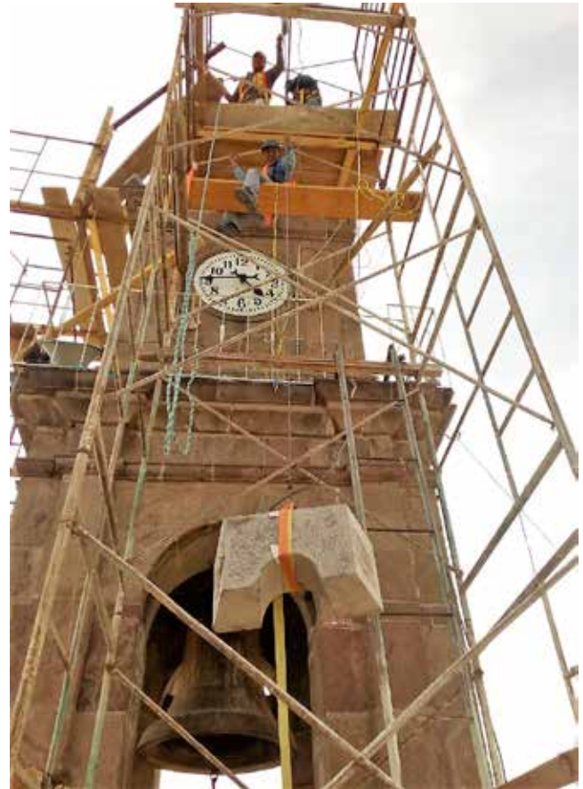
San Jerónimo Zacualpan, proceso de obra.

Los inmuebles históricos dañados tienen distintos usos; sin embargo, los que sufrieron más y mayores afectaciones fueron los de uso religioso, es decir: templos, capillas, casas curales, etc. los cuales representan el 91 % de los inmuebles históricos dañados, con un total de 122 edificios afectados.