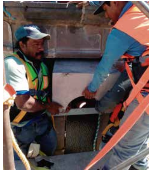
San Jerónimo Zacualpan, trabajadores.

Las acciones por parte del Instituto Nacional de Antropología e Historia (INAH) a nivel nacional fueron inmediatas, para lo cual se inició el monitoreo, principalmente con personal del área de monumentos históricos y de restauración, a fin de establecer la comunicación con las autoridades eclesíásticas e integrar las brigadas de supervisión para realizar el censo de monumentos históricos dañados en el estado y elaborar los dictámenes y presupuestos de cada uno de los 134 inmuebles censados. Durante las primeras semanas de noviembre se hicieron los recorridos de reconocimiento de daños con los ajustadores del seguro de bienes patrimoniales contratado por el INAH y, posteriormente, durante los meses de noviembre y diciembre, se realizó el proceso de conciliación con la aseguradora. Como resultado de este periodo de conciliación, se concluyó con el reconocimiento de daños por sismo en 129 inmuebles de los cuales, solo 5 de ellos no fueron reconocidos con daños causados por sismo.