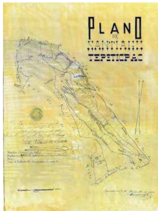
Plano del territorio y límites de Santiago Tepeticpac de 1893.

En el plano se indica el nombre de las barrancas y cerros, muestra las colindancias y límites con los pueblos vecinos y aparecen dos iglesias “viejas”, la de San Marcos Contla y la de Santiago.