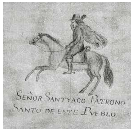
Patrono del pueblo de Santiago Tepeticpac.

ca: “El pueblo de San Tadeo”. A la derecha de este pueblo está dibujada una barranca que baja desde el norte, pegada al lado poniente del mapa; a un costado de dicha barranca están tres letreros que dicen lo siguiente: “Esta es la barranca que baxa del lugar que le nonbran Potrero Hondo, otro que dice Temaskalatlat y uno más que dice: lyndero de pueblo de San Ambrosyo Texantla”.