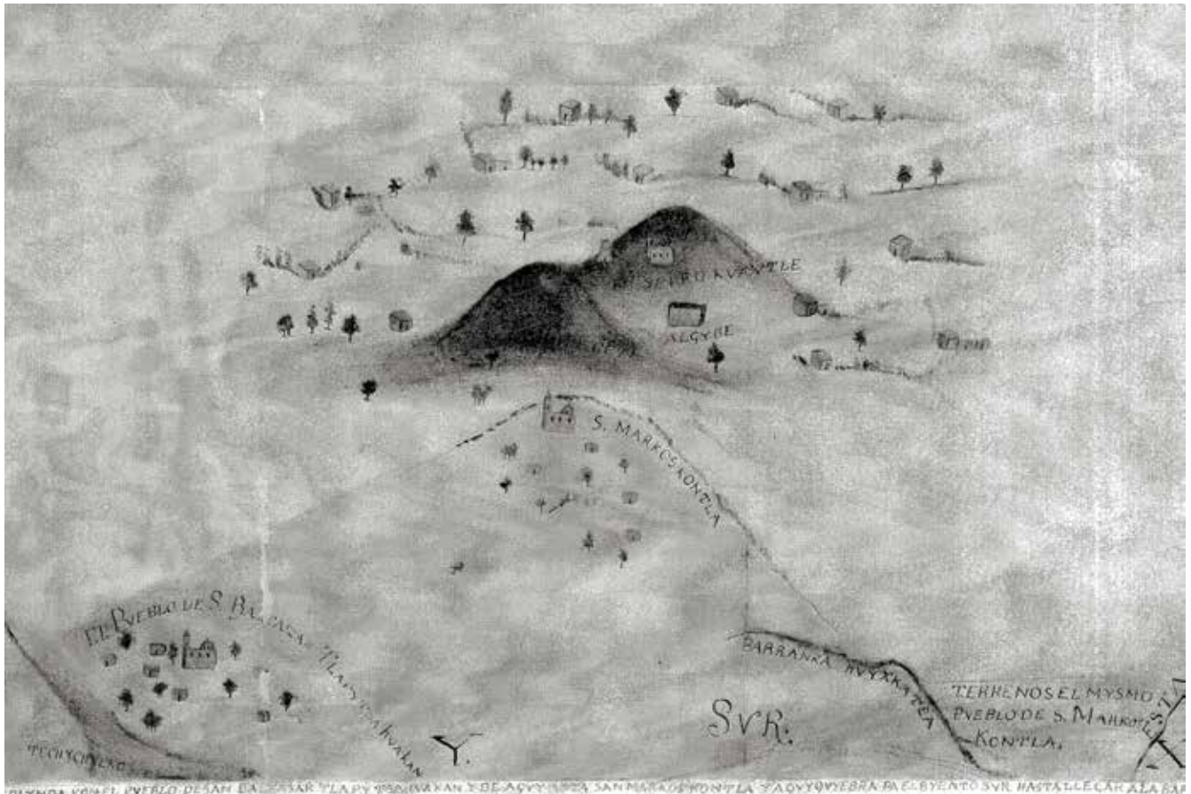
Mapa de 1761 que marca los linderos y colindancias del pueblo de Santiago Tepeticpac.

Abajo y al centro del mapa está el respectivo letrero indicando el sur, otra barranca que nombran “Huyxkatea” y un letrero que menciona que se trata de terrenos del pueblo de “San Marcos Kontla”, al pie del cerro de San Marcos.