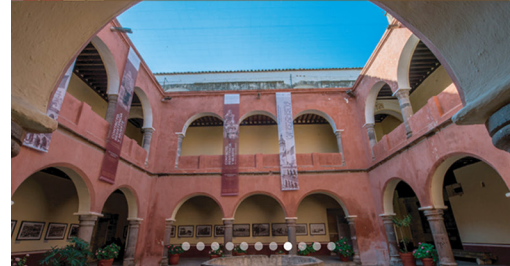
MUSEO Y TEATRO TLANECHTICALLI San Pablo Del Monte #culturalmexico

“LA IDEA DE INCLUSIÓN VA MÁS ALLÁ DE LA ACCESIBILIDAD”