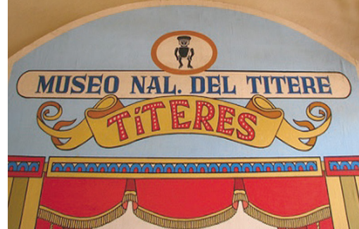
San Pablo Del Monte TL