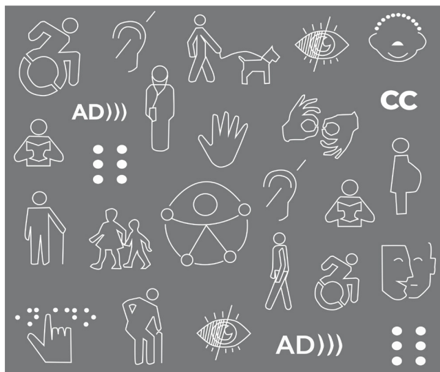
Pictogramas de discapacidad y servicios

Debemos aprovechar oportunidades como una nueva exposición temporal o las renovaciones de una parte de las salas permanentes, estos son momentos donde podemos aplicar parámetros de diseño inclusivo, aún para convencer si es necesario, a quienes tengan la responsabilidad técnica y política, de la necesidad y las ventajas de hacerlo. Para el diseño inclusivo es necesaria la participación activa del público y el diseño de colecciones y exposiciones basadas en las características de éste. Además, planear un programa inclusivo que supere las barreras que impiden la participación y el aprendizaje de todas y todos, enfocándonos en aquellos que son vulnerables a la marginación y exclusión, independientemente de su comunidad, género, sexo, discapacidad o nivel escolar, para así evitar caer en una museografía accesible pero no inclusiva que no está pensada para todas las personas, situación de los museos mexicanos “inclusivos”.