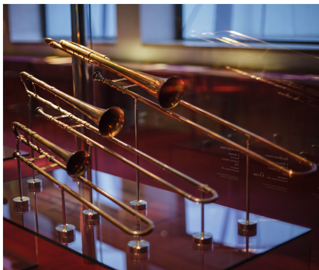
Sacabuche, Wikimedia Commons, 2014

En la Nueva España el uso del sacabuche se extendió por diversas regiones, como bien lo cuentan Díaz del Castillo, Sahagún, Torquemada y otros, no había iglesia en ciudades pequeñas o grandes que no tuvieran sus músicos ejecutantes del sacabuche, principalmente a donde habían los monumentales órganos, pues entre la múltiple sonoridad del órgano y las tonalidades del sacabuche existe un cierto maridaje, no obtenido así, por ejemplo, con el acompañamiento del trombón, ya que el sonido del sacabuche emparenta en antigüedad con los sonidos del órgano; una singular complicidad sonora encontrada en alianza con los gruesos muros, naves y cúpulas de los viejos templos que, al unísono con los feligreses, el humo de ceras y los aromas florales, ofrecen íntimas plegarias.