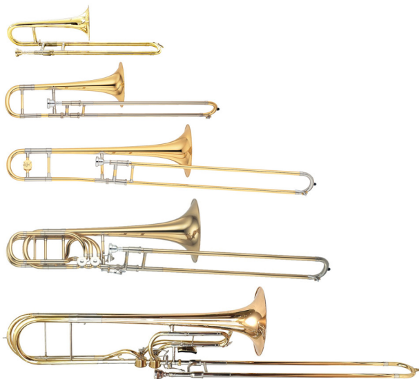
Sacabuche, 2008

denominadas tradicionales, pues es en las localidades y poblaciones recónditas en donde suele preservarse el pasado, en este caso, musical.