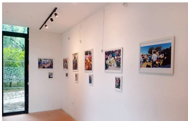
Imágenes de la exposición fotográfica “Comiendo en comunidad. Imágenes del territorio, las cocinas y comidas de México”. Nativitas, Tlaxcala, 2024.