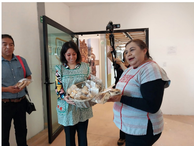
Grupo de Investigación Multidisciplinaria Vida y Cocinas. Nativitas, Tlaxcala, 2024.

Con énfasis en la relevancia que cobra el tema de la cultura alimentaria en nuestro país, la Secretaría de Cultura del Gobierno de México, a través del Instituto Nacional de Antropología e Historia, de su representación en Tlaxcala, la Escuela Nacional de Antropología e Historia (ENAH) y el Museo de sitio de la zona arqueológica de Xochitécatl, presentan la exposición fotográfica “Comiendo en comunidad. Imágenes del territorio, las cocinas y comidas de México”.