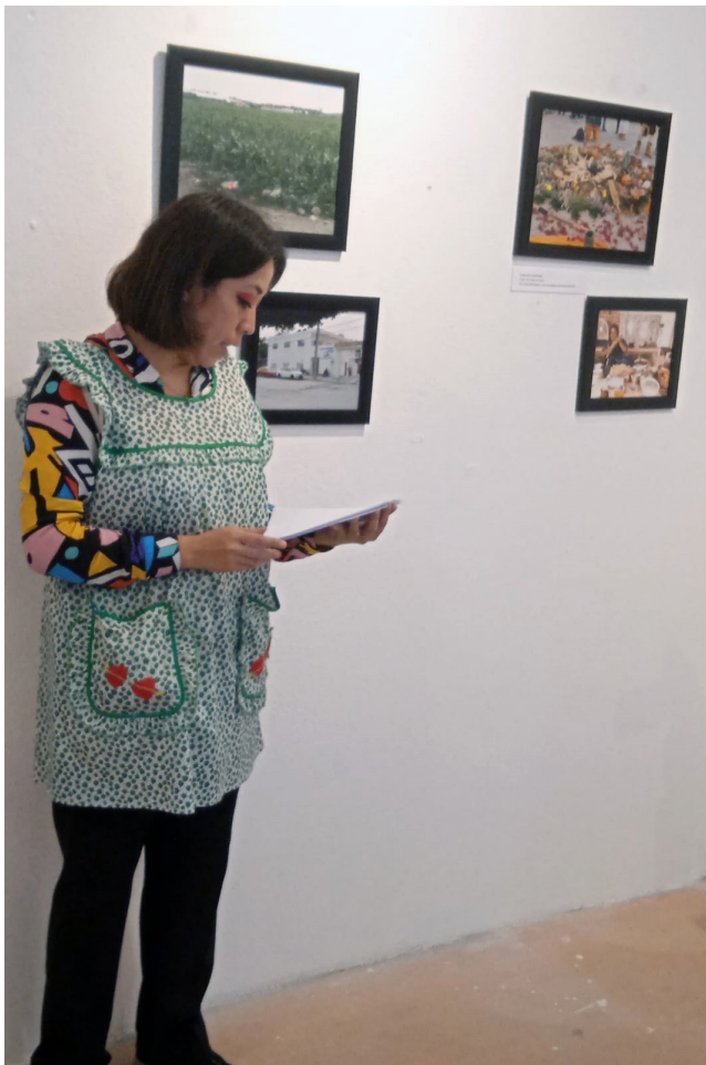
Grupo de Investigación Multidisciplinaria Vida y Cocinas. Nativitas, Tlaxcala, 2024.

Las imágenes corresponden a la colección generada por el grupo a través del Seminario permanente “La investigación histórico – antropológica de la comida. Metodología y Heurísticas”, perteneciente a la Dirección de Etnología y Antropología Social (DEAS) de la ENAH. Engloban un trabajo multidisciplinario a lo largo de una década, y la celebran con esta muestra.