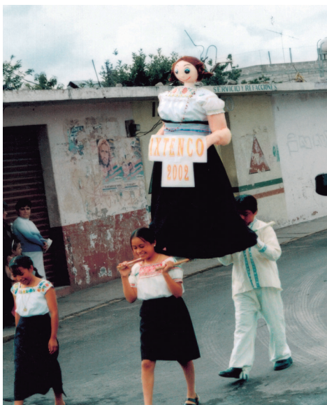
Muñeca con vestimenta tradicional en el desfile de feria.

No es solo la energía cuántica lo que se involucra, sino sobre todo la conciencia de lo que se cree, se dice y se piensa, verbigracia, lo que ocurre en un ritual a la Madre Tierra o a la lluvia. Cualquiera puede poner a prueba que, con la imaginación y la conciencia, entendiendo a la conciencia como la capacidad de tener autoobservación, y a la imaginación como una capacidad del cerebro que trasciende al cerebro, estaremos en la potencialidad del viaje interdimensional y quizá, con suerte, podamos reconsiderar la personificación de la naturaleza sin, supuestamente, perder el equilibrio mental ni condenarnos a un fuego interminable. En otras palabras, si la física cuántica puede ayudar a Occidente en la comprensión de la naturaleza como una persona, es debido a los aspectos imaginativos y conscientes que se involucran en la realización de los ritua-