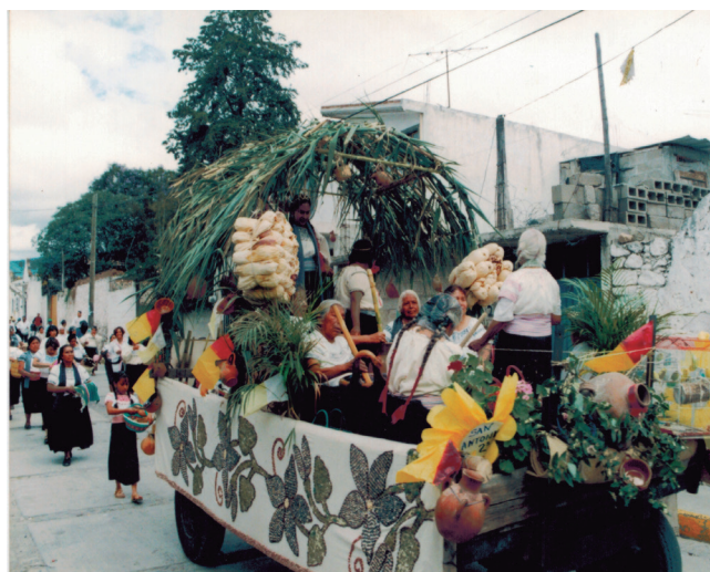
Carro alegórico en el desfile de feria.

predatorio de los recursos naturales, que ha seguido la iglesia católica desde hace varias décadas.