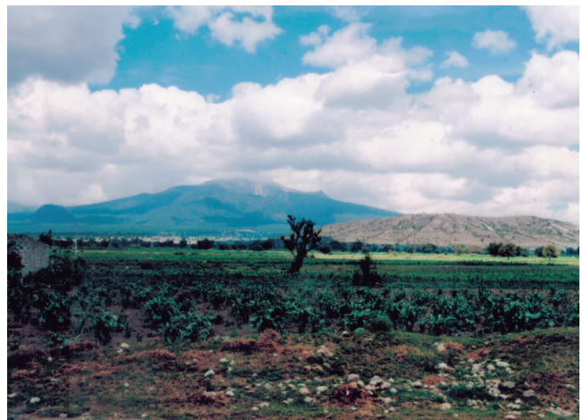
Panorámica de La Malinche.

Como ya vimos en la desafortunada Bolivia, donde un grupo de fanáticos e intolerantes ha tratado de borrar toda huella de un gobierno indígena promoviendo en particular el retorno a la “guía de la Biblia”, pero la del siglo XVI, porque su intención es cubrir la reconquista espiritual con la muerte del infiel. Cinco centurias después de la conquista española, la Pachamama sigue siendo vista hoy como la imagen “del embaucador”. Es decir, parece que hubo una involución, pero esto es una mentira, pues en realidad sí hubo un avance de la conciencia que le permitió llegar al poder político a los “idólatras”, mientras que la resistencia a esos cambios, persiste en la sacra estratificación social.