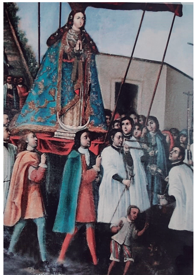
Exvoto de la bajada de la Virgen de Ocotlán, siglo XVIII, Sacristía de la Basílica de Ocotlán.

celebraciones litúrgicas y qué no decir de las procesiones con las imágenes más veneradas en cada gran población o ciudad. Mientras que en la Ciudad de México se abogaba mediante la intercesión de las imágenes de la Virgen de Guadalupe y de la Virgen de los Remedios, en Tlaxcala se inició con la tradicional bajada de la Virgen de Ocotlán a partir de la epidemia de 1713-14, bajo la tutoría del capellán Francisco Fernández de Silva. Sobra decir que esta tradición ha perdurado y se realiza en la actualidad el tercer lunes de mayo.