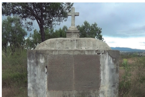
“Monumento de la Unidad”, San Dionisio Yauhquemecan.