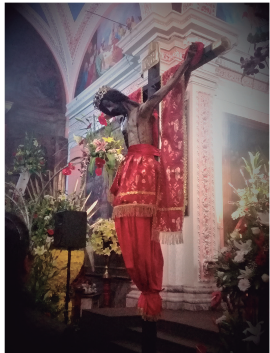
"La Preciosa Sangre de Cristo", imagen que se venera en la parroquia de Santo Toribio Xicotzingo.

Los primeros lugares en los que se presentó la gripe fueron Terrenate, Atlangatepec, Lardizabal, Tenancingo, Contla, Calpulalpan, Hueyotlipan, Españaíta, Huamantla, Zacatelco, Teolocholco, Amaxac, Tetla, Xaltocan, Tlaxco, Ixtenco, Tlaxcala, Totolac, Apetatitlan, Santa Cruz Tlaxcala, Xicotencatl, Alzayanca, Chiautempan, Nativitas, Tetaltlahuca, San Pablo del Monte, Panotla, Tzompantepec, Xalostoc, Zitlaltepec, Apizaco, Ixtacuixtla, Yauhquemecan, Tepeyanco, Cuapiaxtla y Tequexquitla. La mortalidad se dio principalmente entre el 9 de octubre y el 1.º de noviembre. Se ha podido saber que la etapa inicial de la epidemia fue del 9 al 20 de octubre, del 20 de octubre al 20 de noviembre fue la etapa más intensa y del 23 de noviembre al 31 de diciembre fue el ciclo terminal del virus, destacándose que el total de muertes que se tiene conocimiento en la entidad fue de 9,640.