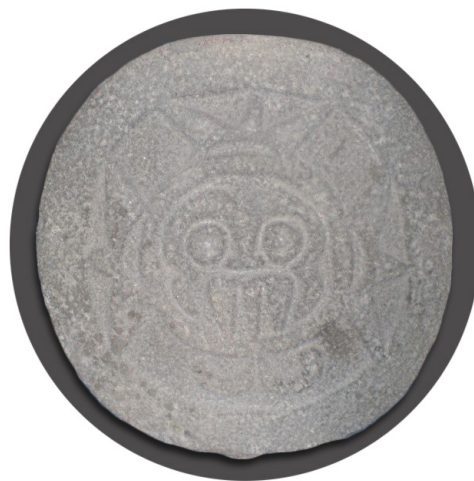
Disco con el rostro del dios de la lluvia

disco con el rostro del dios de la lluvia (Tláloc) y una escultura en piedra de una de las primeras deidades prehispánicas: el dios viejo del fuego (Huehuetéotl).