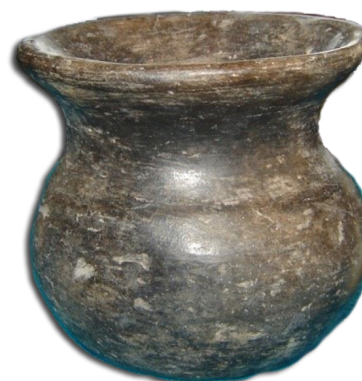
Ollita de barro teotihuacana, 200-400 n. e.