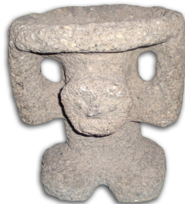
Escultura del dios viejo del fuego

Otro muy interesante espacio museográfico es sin duda el Museo Comunitario de Atltzayanca, el cual se localiza en un edificio construido exprofeso para tal fin gracias a las gestiones del presidente de la Asociación Civil Teotl. El museo se localiza a la entrada del Barrio de