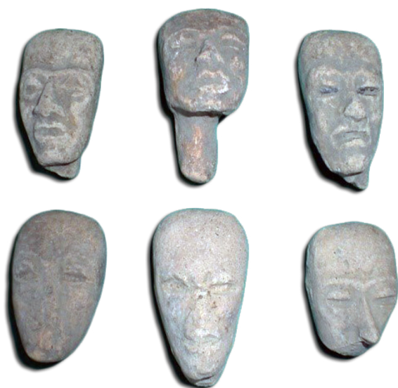
Caritas de figurilla teotihuacanas, 200-450 n. e.

Otro ejemplo, es el Centro Cultural del municipio de Nanacamilpa de Mariano Arista, donde se localiza una colección arqueológica que cuenta con más de 500 objetos, como cajetes de fondo plano, figurillas del tipo llamado “corazón” que nos muestran una fuerte relación cultural y económica con la cultura que habitó en Teotihuacan, entre los años 200 y 650 de nuestra era, que nos demuestran que en ese lugar había una colonia de habitantes de esa gran metrópolis, ubicada en el Estado de México. La influencia de esta urbe se extiende a todo lo ancho del territorio tlaxcalteca hasta Atltzayanca, donde toma dos rutas, una hacia Cantona, en el estado de Puebla y otro hacia el valle de Tehuacan, para llegar al actual estado de Oaxaca, al cual se le ha llamado el Corredor Teotihuacano. También interesante, es la presencia del dios mofletado que nos muestra relaciones con el área totonaca del estado de Veracruz.