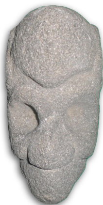
Escultura en forma de cara humana denominada hacha

El Museo Regional Mixcoatecutli se ubica en los cuartos anexos a la antigua casa cural del templo situado en la población de San Bartolo Matlalohcan, municipio de Tetla de la Solidaridad. En este pequeño museo pueden apreciarse tanto materiales arqueológicos y paleontológicos procedentes del área cercana, así como una interesante colección de vestimentas y objetos religiosos antiguos.