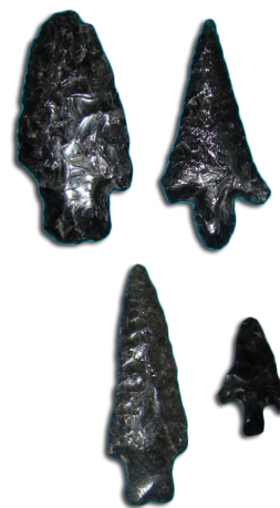
Puntas de proyectil de obsidiana, fecha sin determinar

El Museo Regional Mixcoatecutli se ubica en los cuartos anexos a la antigua casa cural del templo situado en la población de San Bartolo Matlalohcan, municipio de Tetla de la Solidaridad. En este pequeño museo pueden apreciarse tanto materiales arqueológicos y paleontológicos procedentes del área cercana, así como una interesante colección de vestimentas y objetos religiosos antiguos.