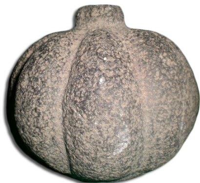
Escultura de piedra en forma de calabaza, cultura totonaca, 200-1300 n. e.

Señor Santiago, dentro de la cabecera municipal, y cuenta con una colección de más de 500 piezas. Resulta interesante ver que en ella se encuentran algunas piezas provenientes de la cultura totonaca que antiguamente habitó en los estados de Puebla y Veracruz y, probablemente, también en la porción norte-oriente del estado de Tlaxcala, así tenemos, una escultura de piedra en forma de calabaza muy bien lograda, así como una palma en forma de cabeza humana.