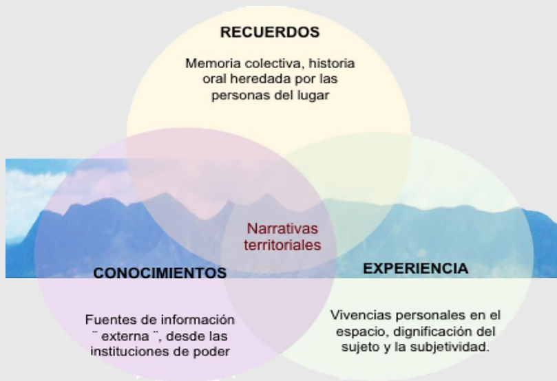
Figura 1. Narrativas y prácticas territoriales. Con base en Gerardo Damonte, Construyendo territorios... , y modificado de Sandra Luz de la Luna Fuentes Blancas, Las narrativas territoriales...

Por ello, las narrativas territoriales regulan o determinan las dinámicas y modos de vida, por lo tanto son partes constitutivas de los territorios, pero no constituyen territorios por sí mismas. 27