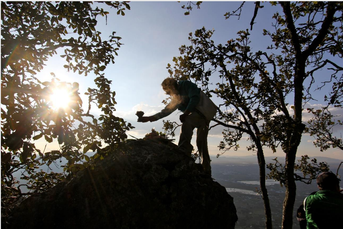
Figura 1. Trabajador del rayo ( mēfi ) del Divino Rostro, laborando en lo alto de los cerros.

Con esta frase el sacerdote del curato de Huixquilucan se refería, hacia 1786, al incierto sitio donde los infieles e idólatras otomíes de su parroquia ascendían para conjurar granizos y ofrendar flores, copal y gallinas a oscuras divinidades pidiendo por la buena marcha del ciclo estacional. Los curas de ese y otros pueblos de la región denunciaban tal situación un año tras otro, y sus insistentes cruzadas evangelizadoras sólo recibían, o bien la burla o el desprecio de los indios, cuyas almas y mentes —según declaraban sus impotentes pastores— se encontraban nubladas por Satanás. 1 En esos mismos cerros de la sierra de las Cruces y Montealto 2 el sistema ritual que procura y regula el buen temporal se mantiene saludable y en funcionamiento bajo la responsabilidad de los especialistas rituales (llamados mēfi , “peones”). Tal es su importancia que durante los años 2020 y 2021, en sus cimas se erigieron trincheras chamánicas contra el covid-19 y desde ellas, los mēfi enviaron nzaki , “fuerza”, a los científicos que bregaban por encontrar una vacuna. 3