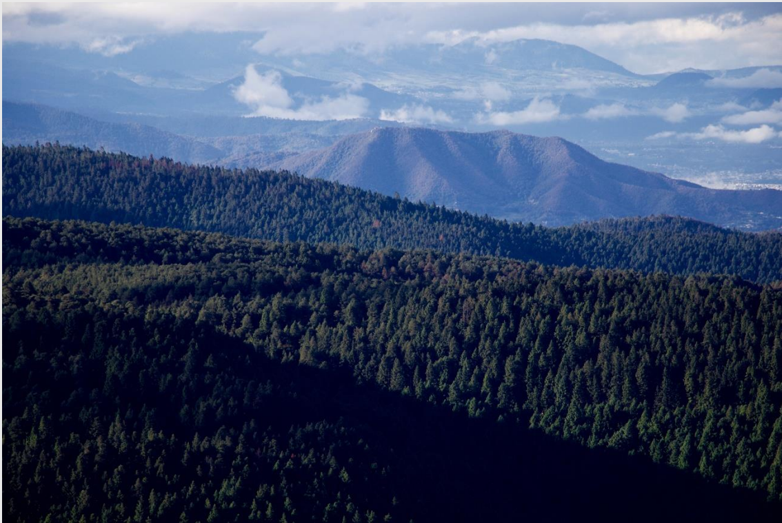
Figura 2. Vista de la sierra de las Cruces y Montealto, vista desde las alturas de Temoaya, Estado de México.

carencias de seguridad y de abasto de agua potable. Estos hinterland de élites enfrentados a pueblos y colonias populares ofrecen una curiosa versión de la segregación urbana aplicada por una lógica discriminatoria, selectiva y que divide a la región entre unos pocos espacios con servicios privilegiados y una enorme capa urbana marginada. 7 Esta gentrificación de la naturaleza también está disfrazada de fines turísticos: en la segunda mitad del siglo XX los bosques y valles de La Marquesa (municipio de Ocoyoacac) se declararon “parque nacional”, destinado a la explotación de un turismo de tipo rural que no necesariamente acarrea beneficios integrales a las comunidades de la zona.