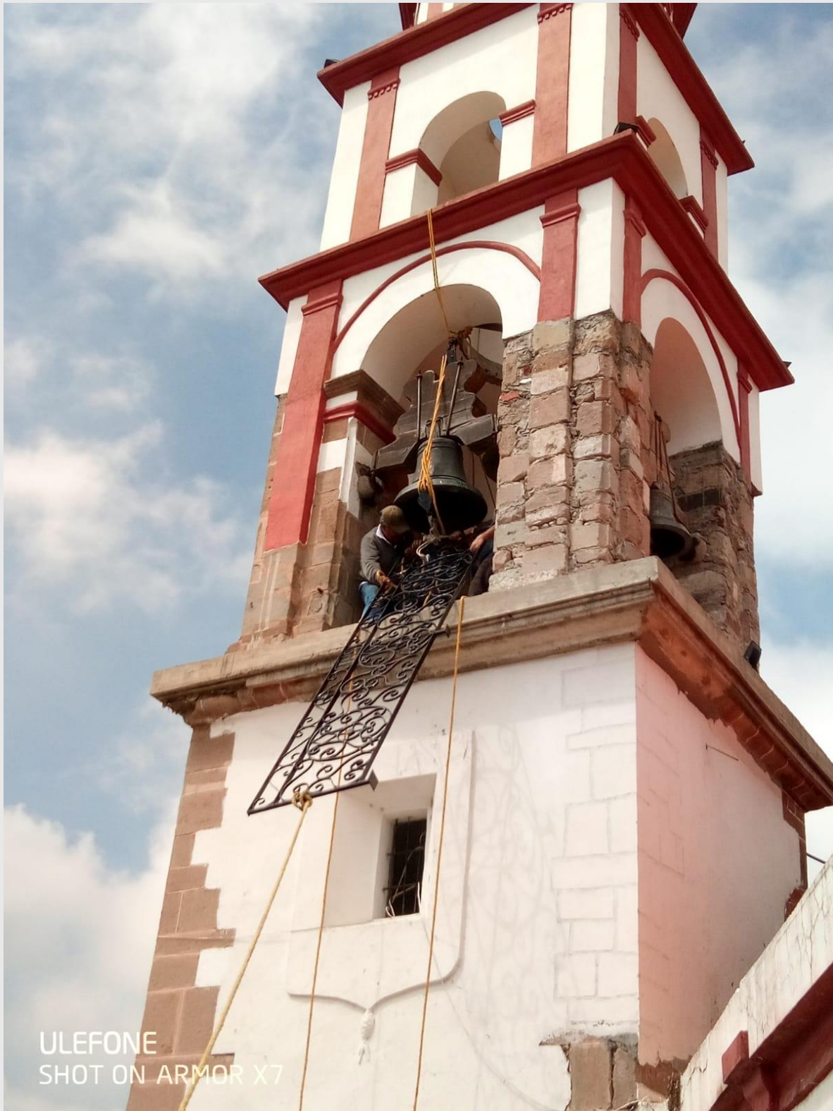
Figura 1, Trabajos de mantenimiento en la iglesia del Señor del Sacromonte. Fotografía: ACSC, 2010.