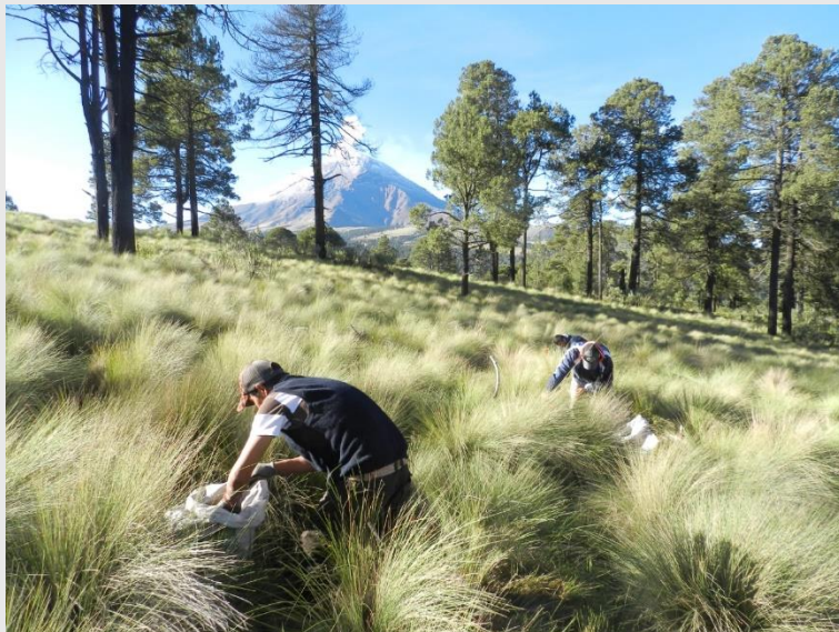
Figura 5. Reforestación en el Paso de Cortés.