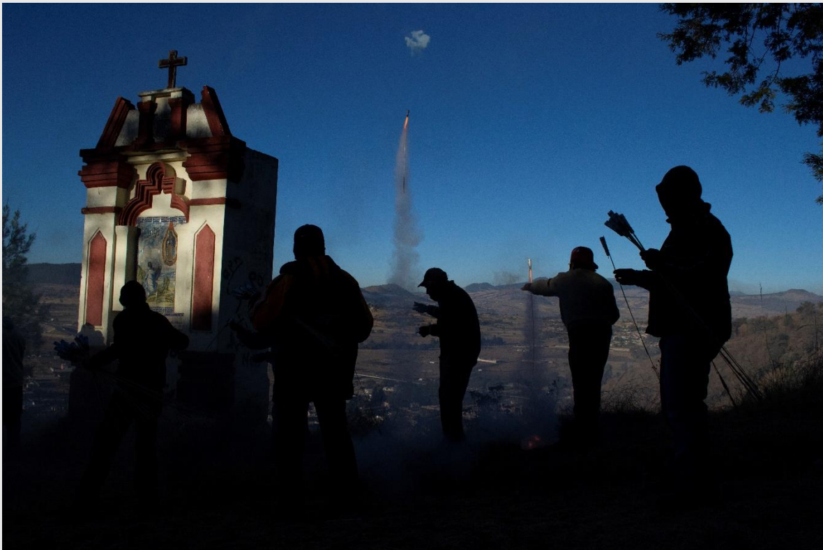
Figura 2. Quema de la salva. Fotografía: Ramsés Hernández Lucas, 2013.