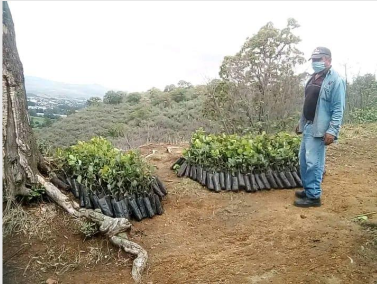
Figura 4. Reforestación en el cerro del Sacromonte.