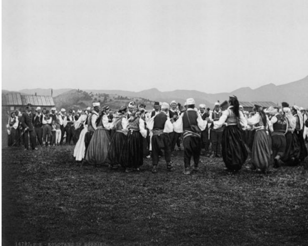
GRUPO DE BOSNIOS, DÉCADA DE 1890.

En esta época los Estados nacionales tuvieron un papel protagónico y destacado, pues adoptaron la tarea de definir la identidad de la nación y los objetos que la representaban cabalmente.