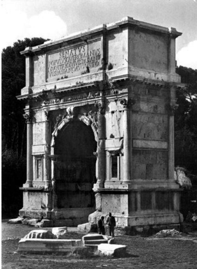
ARCO DE TITO

A la par de estas intervenciones se manifiesta una crítica severa a muchos de estos trabajos. Es a partir de los llamamientos de Ruskin, Morris y la Society for the Protection of Ancient Buildings (SPAB), que la discusión de los alcances de la disciplina y de sus principios adquiere un protagonismo nunca visto, debido a que las querellas ya no se hacen en un ámbito cerrado, sino que empiezan a ser públicas, lo cual dirige la atención de la gente hacia las tareas de la conservación.