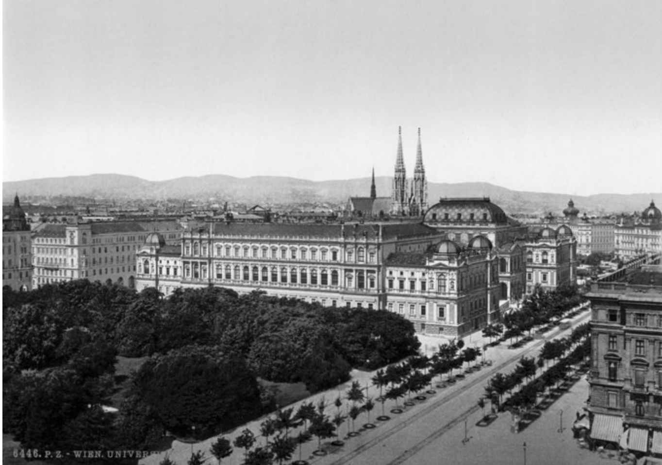
UNIVERSIDAD DE VIENA, 1900.

Por último, en 1902 Riegl preside la Comisión Central Imperial y Real de Monumentos Históricos y Artísticos de Austria, misma que le solicita el proyecto de ley para la reorganización administrativa de la tutela de los monumentos. Como fruto de esta relación se publica El culto moderno de los monumentos , el cual fue el prelude del plan legislativo. En el mismo año publica Das holländische Gruppenporträt . 9 Muere en 1905, a los 47 años de edad.