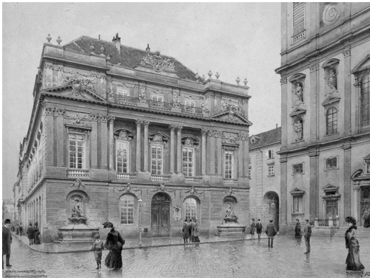
PLAZA DE LA UNIVERSIDAD DE VIENA, ACADEMIA DE LAS CIENCIAS. Richard Moser, 1905. Acuarela.

De esta manera, Riegl propone frente a los valores nacionales, uno universal humano basado en el valor de edad, que puede ser aprehendido por todos los sujetos mediante una experiencia emotiva. Como se ha señalado, el valor de edad tiene una fuerte carga escatológica, a la cual Riegl le añade una dimensión ontológica en tanto que los monumentos “nos parecerán como una parte de nuestra existencia, pero no de la existencia nacional, sino de aquella humana” (Riegl, 2018: 65).