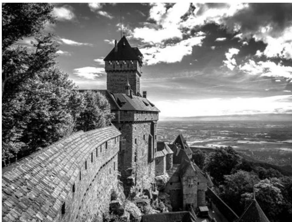
CASTILLO DE HAUT-KOENIGSBOURG.

Lo que es inventado recientemente no puede ser considerado como histórico, y por eso tampoco puede pretender evocar en nosotros una imagen fiel del pasado. Y de hecho el individuo moderno, intelectual y emocional, mirará con un resto de invencible desconfianza cada reconstrucción de un castillo medieval (Riegl, 2018: 74).