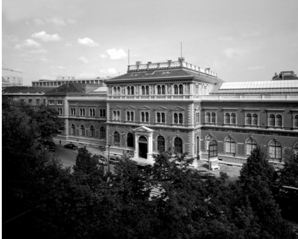
MUSEO DE ARTES E INDUSTRIAS.

Riegl y las instituciones culturales austrohúngaras vivieron una especie de relación simbiótica que logró producir estudios e ideas que beneficiaron a ambas partes. Gran parte de la obra desarrollada por el autor se debe a su íntima participación en las políticas culturales estatales, en las que es notoria una completa imbricación entre los postulados de Riegl y el contexto en el que desarrolló sus ideas. Una breve revisión de su biografía lo demuestra: Riegl nace en 1858. En 1881 comienza sus estudios en el Instituto para la Investigación Histórica de Viena. Anteriormente, Rudolph von Eitelberger funda el Museo de Artes e Industrias en Viena en 1864, donde Riegl, después de egresar de sus estudios, comenzó su carrera profesional, ostentando el cargo de conservador de textiles en 1886. Esta experiencia seguramente le inspiró en la redacción de sus dos primeras obras: Altorientalische Teppiche 5 y Stilfragen 6 publicados en 1891 y 1893, respectivamente. En Stilfragen estudia el fenómeno de la ornamentación, y entre otras cosas disuelve la distinción entre artes mayores y menores, y empieza a configurar su concepto de Kunstwollen .