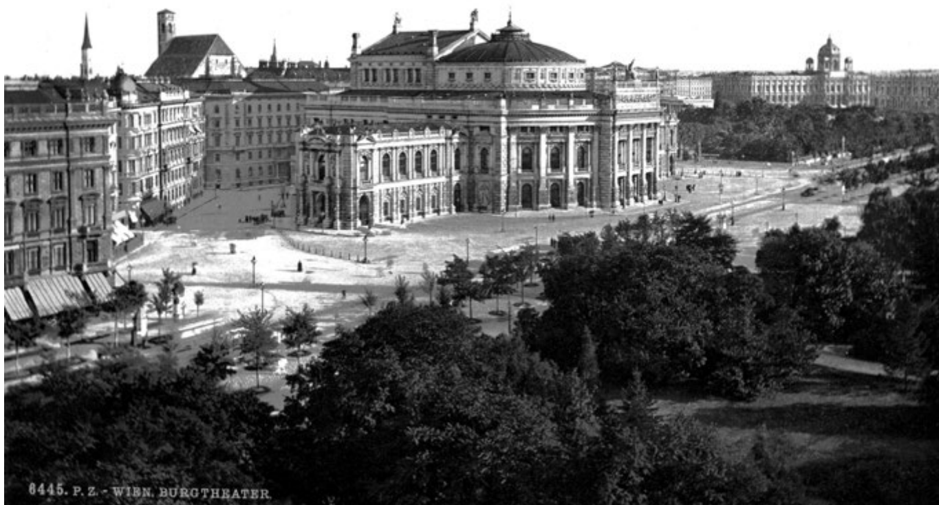
BURGTHEATER, VIENA, 1900.