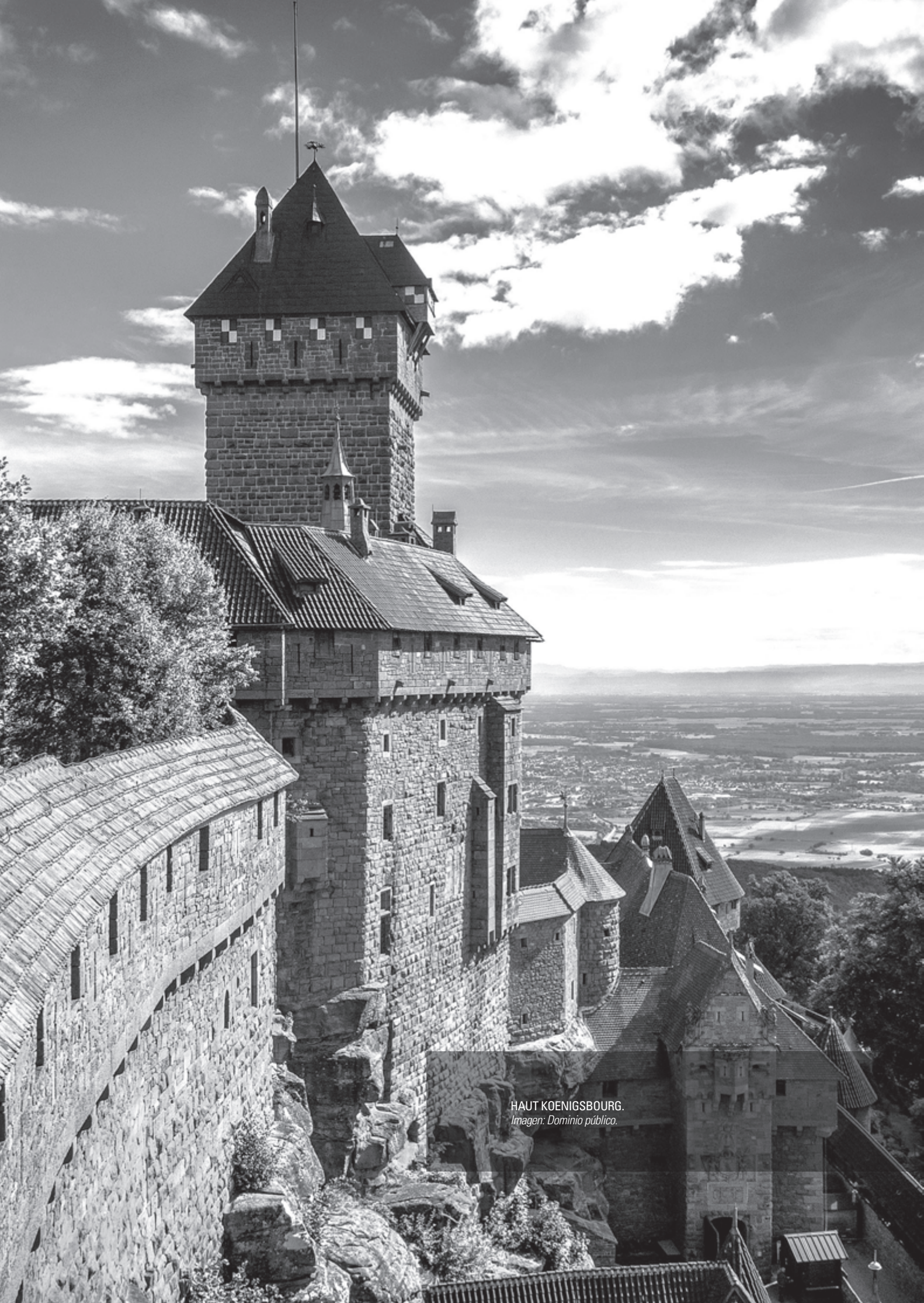
HAUT KOENIGSBOURG.