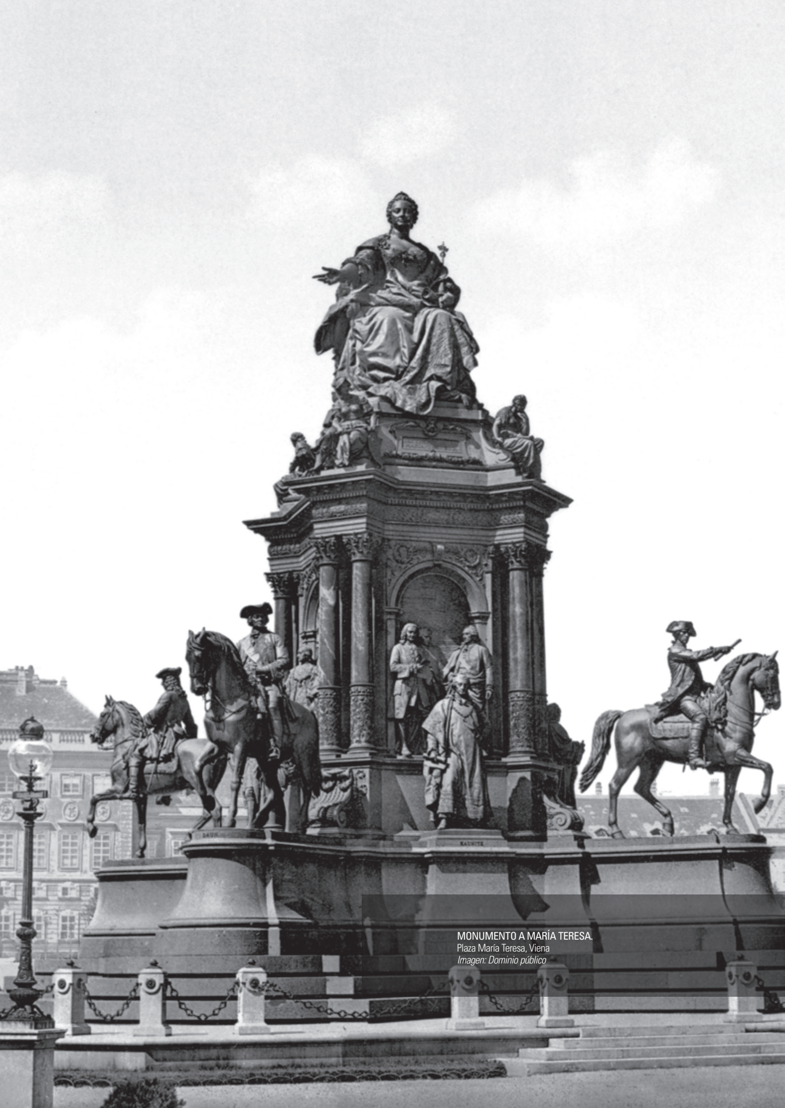
MONUMENTO A MARÍA TERESA. Plaza María Teresa, Viena