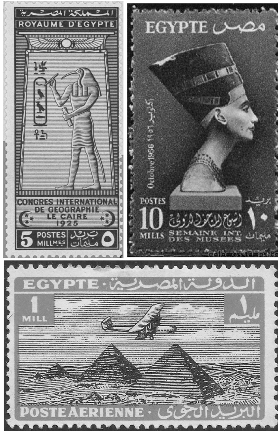
TIMBRES POSTALES QUE UTILIZAN PATRIMONIO FARAÓNICO. Imagen: Dominio público.