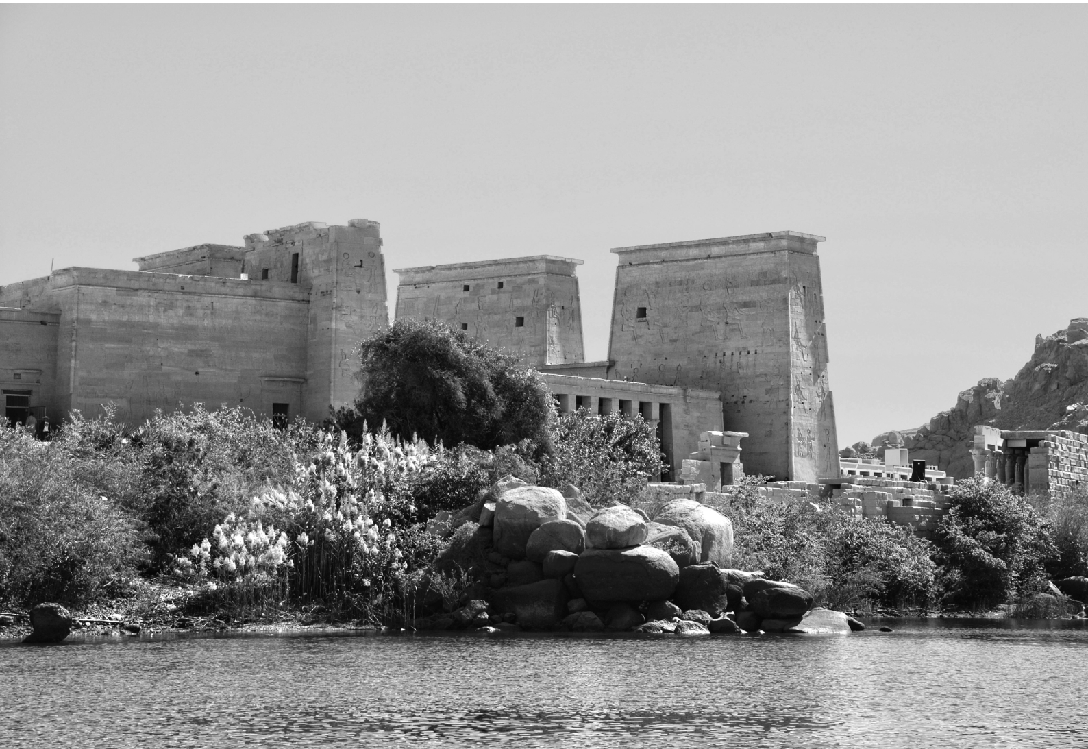
TEMPLO DE PHILAE.

El acercamiento por agua es bastante hermoso. Vista desde el nivel de un pequeño bote, la isla, con sus palmeras, sus columnatas, sus torres, parece surgir del río como un espejismo. Las rocas apiladas la enmarcan a ambos lados, y las montañas moradas cierran la distancia. 13