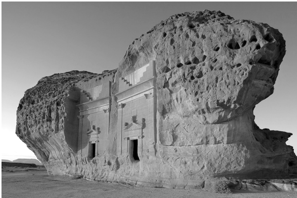
SITIO ARQUEOLÓGICO DE AL-HIJR, ARABIA SAUDITA.

El Profeta ordenó a sus compañeros, mientras pasaban por las ruinas arqueológicas de al-Hijr, que se abstuvieran de ingresar al sitio a menos que lloraran y reflexionaran sobre el destino de aquellos que alguna vez vivieron allí. Al hacerlo, estableció una etiqueta para los musulmanes con respecto a visitar los sitios de ruinas antiguas, que es similar a la etiqueta islámica de visitar los cementerios: con respeto, humildad y reflexión (Al-Bukhari, 846).