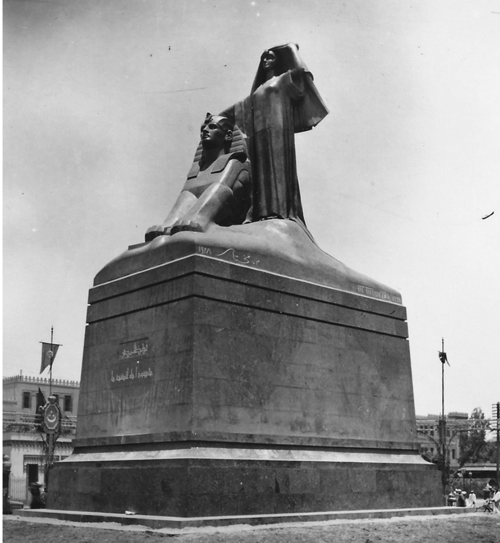
DESPERTAR DE EGIPTO, POR MAHMOUD UKTAR, CAIRO.

Los movimientos nacionales árabes durante el periodo colonial, así como los gobiernos nacionales después de la independencia, siguieron el ejemplo europeo del siglo XIX al establecer su identidad nacional basada en su historia antigua (Bernhardsson, 2010: 61-62). 6 Siguieron el ejemplo europeo de utilizar ruinas antiguas como evidencia material y representación visual de la historicidad y autenticidad de sus identidades nacionales recientemente establecidas (Reid, 2002 y 2015).