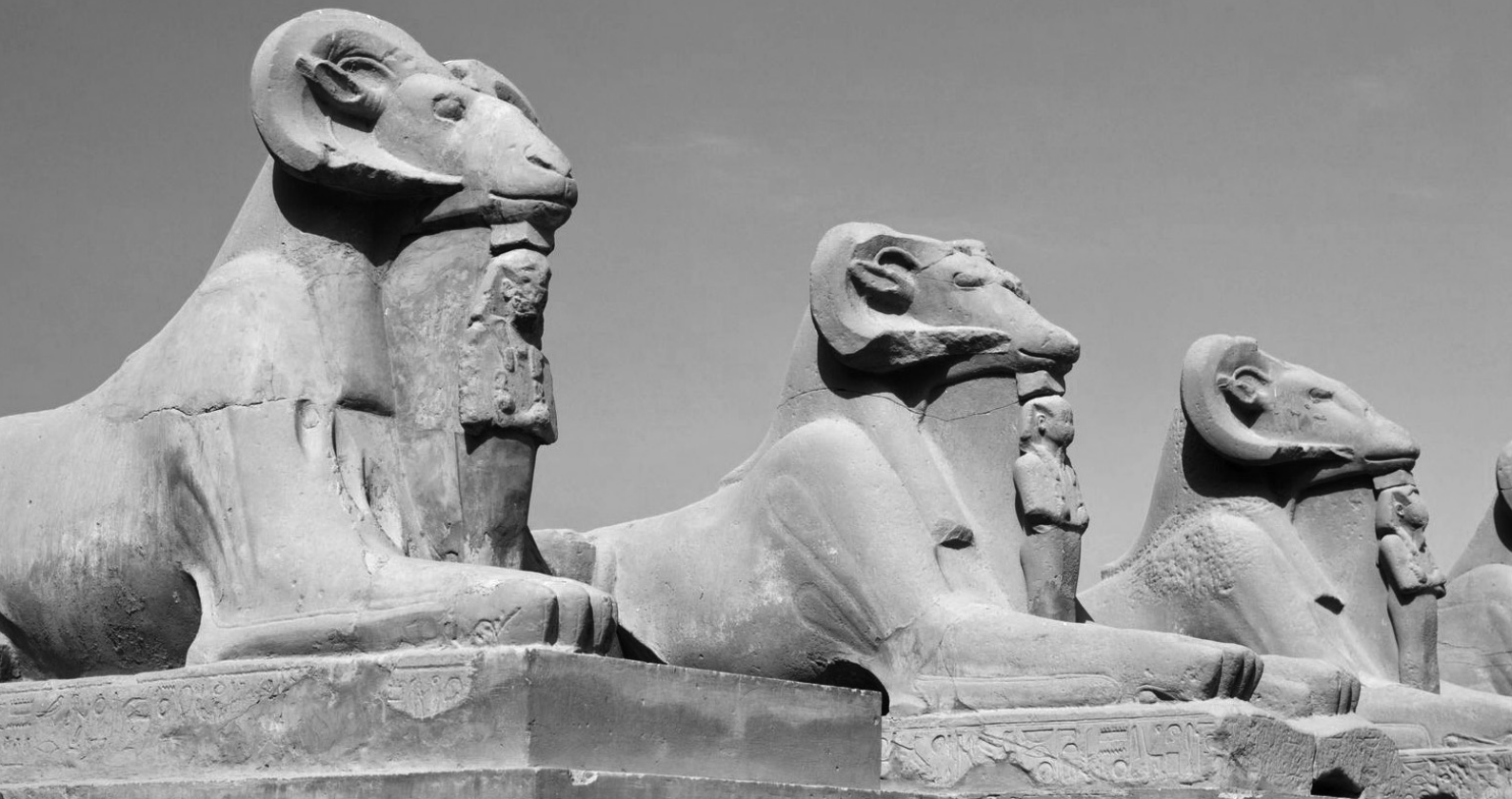
CORREDOR DE ESFINGES, LUXOR.

restauración y reconstrucción. Lo más importante es que una actitud inclusiva garantizaría la participación proactiva de las comunidades locales en la conservación y gestión de las ruinas antiguas. Desafortunadamente, sin embargo, las autoridades formales y los responsables de la toma de decisiones en la Región Árabe no están cerca de respaldar tal reconciliación, ya que continúan descartando las actitudes tradicionales. Además, los conflictos armados en curso y los disturbios cívicos que destruyeron y están destruyendo grandes sitios, edificios y ciudades en toda la región generan gritos patrióticos para reconstruir las ruinas, como un aspecto incuestionable de la reconstrucción de naciones y comunidades de la posguerra.