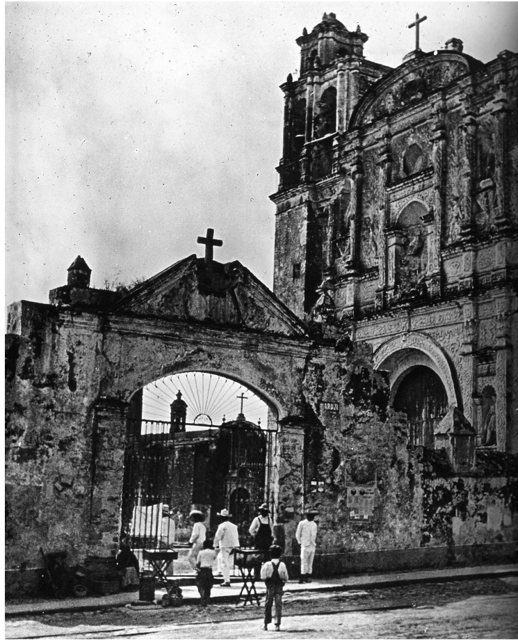
CATEDRAL DE CUERNAVACA, CA. 1907.