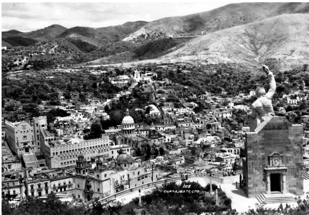
GUANAJUATO, CA. 1952.