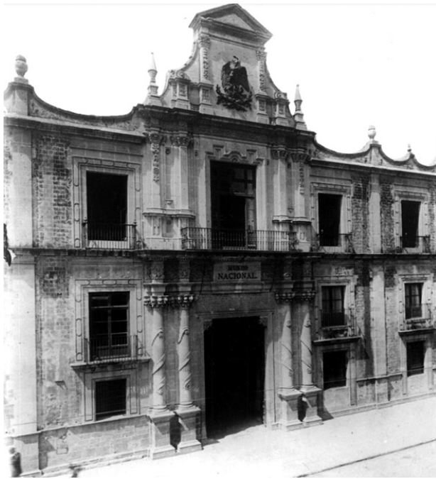
MUSEO NACIONAL EN LA ANTIGUA CASA DE MONEDA, MÉXICO.