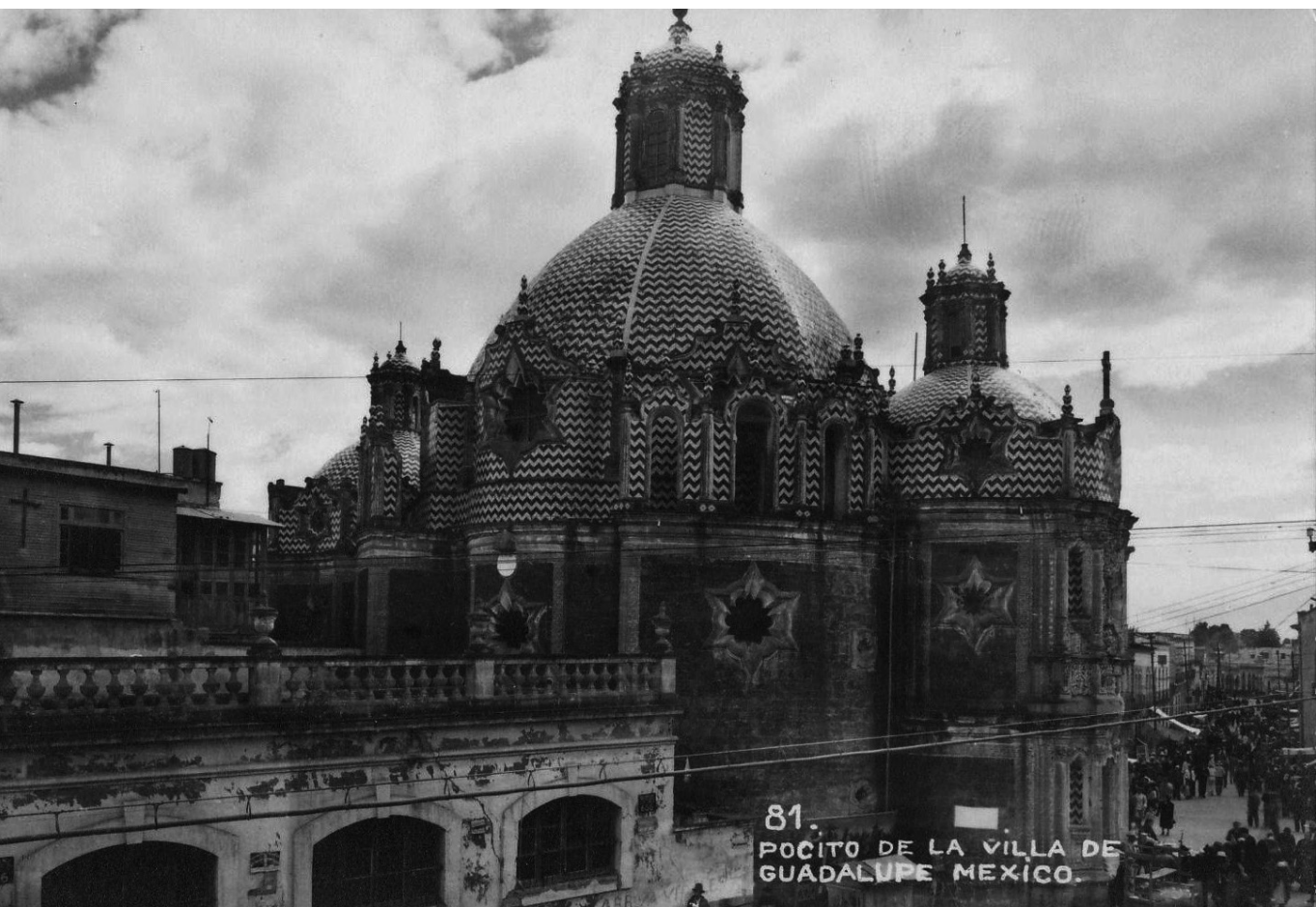
CAPILLA DEL POCITO.

3) Cimentación de la iglesia denominada "El Pocito", en La Villa de Guadalupe, Distrito Federal, siglo XVIII. Teniendo un desplome bastante considerable, se recimentó con una cadena perimetral y, posteriormente, mediante pilotes de control, fue enderezada a su posición original.