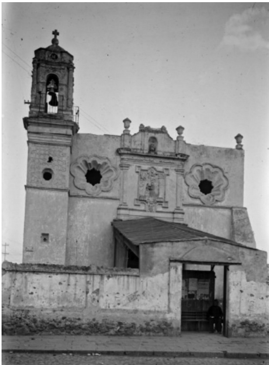
SAN ANTONIO TOMATLÁN, CA. 1910-1920.

3) Liberación total de los adosamientos alrededor del convento de Yuriria, Estado de Guanajuato, siglo XVI. Dentro de la regeneración urbanística llevada a cabo en esta ciudad, una parte muy importante lo constituyó este convento, al que le fueron suprimidas las construcciones que lo rodeaban, permitiendo apreciar en toda su magnitud este convento-fortaleza.