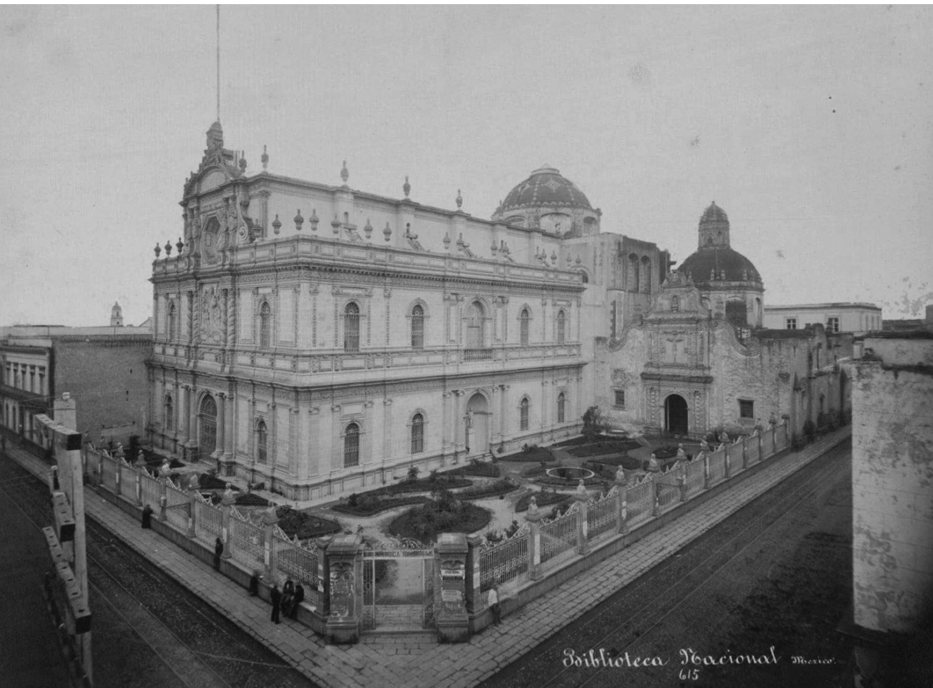
TEMPLO DE SAN AGUSTÍN, CONVERTIDO EN LA BIBLIOTECA NACIONAL.