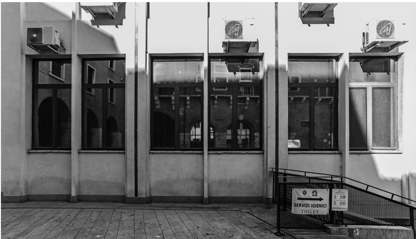
VICENZA (ITALIA) CORTE DEI BISSARI. Reflejo de la 'Domus Comestabilis' de la Basílica Palladiana en el edificio de oficinas del ayuntamiento de Vicenza. Imagen: Irene Ruiz Bazán.