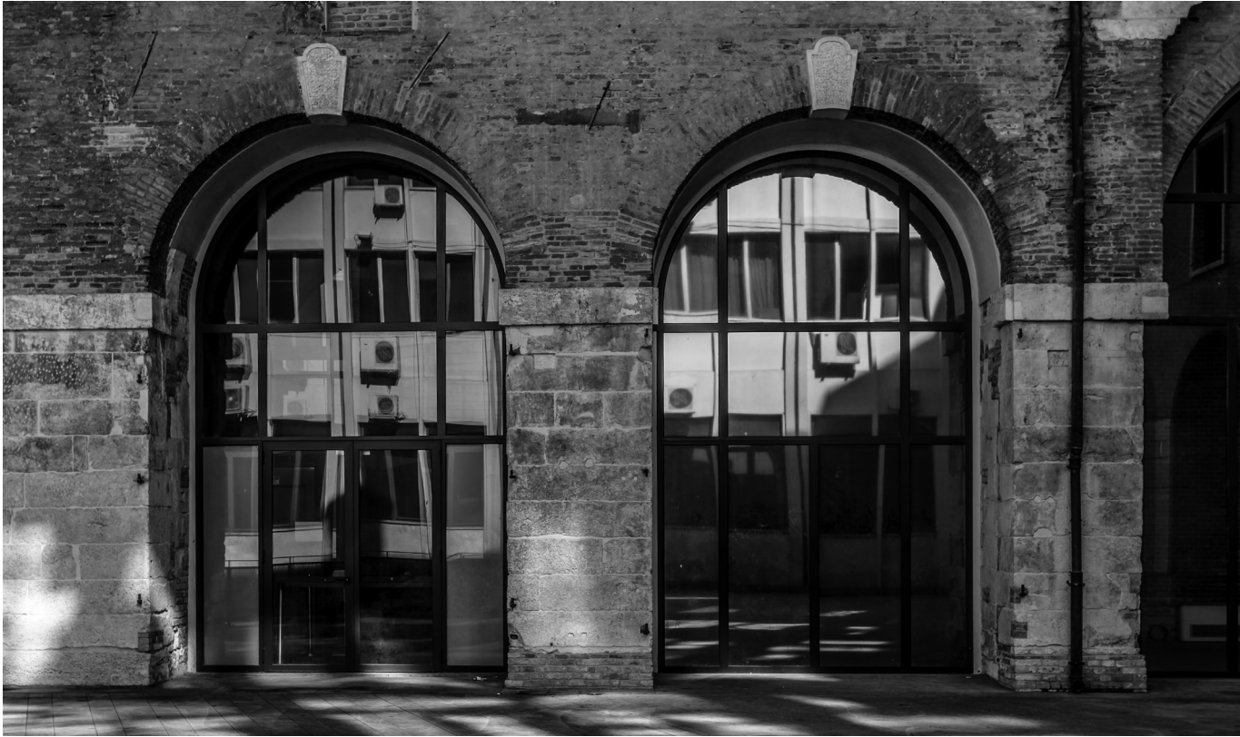
VICENZA (ITALIA) CORTE DEI BISSARI. Reflejo del edificio de oficinas del ayuntamiento de Vicenza en la 'Domus Comestabilis' de la Basílica Palladiana.