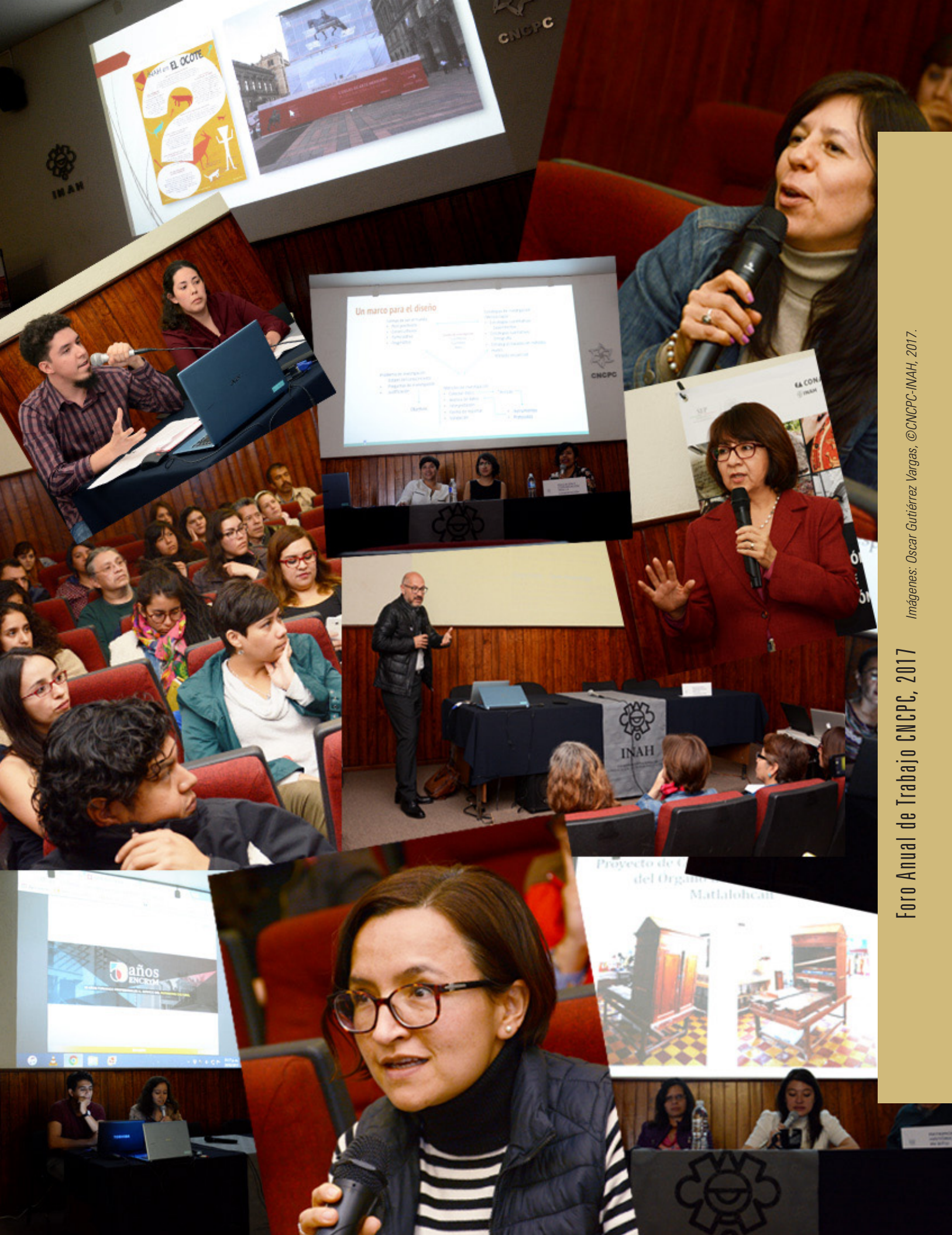
Foto Anual de Trabajo CNCPC, 2017