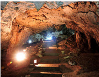
Balamcanché Zonas arqueológicas