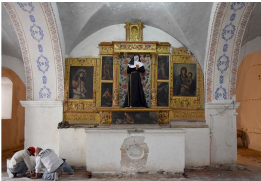
◀ Figura 1. Retablo con la imagen de santa Gertrudis, antes de la intervención, San Pedro y San Pablo Teposcolula, Oaxaca.

Información: Irlanda Fragoso Calderas, Arturo Sebastián Casasola Bustersos, Christian Alberto Chávez González y Pablo Vidal Tapia