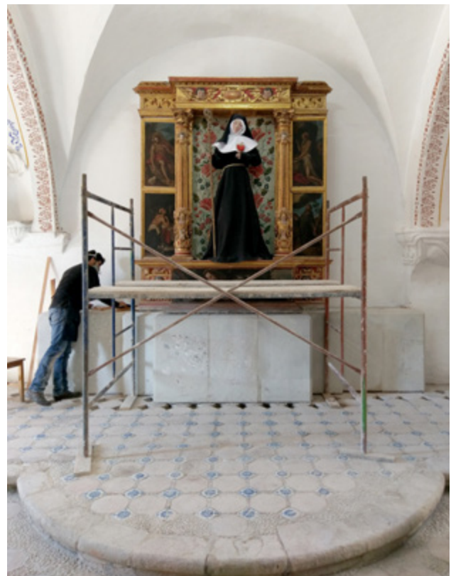
► Figura 3. Retablo con la imagen de santa Gertrudis, después de la intervención, San Pedro y San Pablo Teposcolula, Oaxaca.