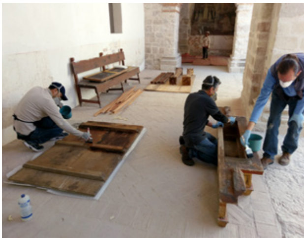
▲ Figura 4. Fumigación por impregnación de componentes del retablo de santa Gertrudis, San Pedro y San Pablo Teposcolula, Oaxaca.

La Coordinación Nacional de Conservación del Patrimonio Cultural prevé dar seguimiento al estado de conservación de los bienes artísticos e históricos que resguardan los tres grandes conventos dominicos de la Mixteca Alta oaxaqueña: San Pedro y San Pablo de Teposcolula, Santo Domingo de Yanhuitlán y San Juan Bautista de Coixtlahuaca, a través del área de Conservación de bienes inmuebles por destino en madera, con el apoyo de un equipo interdisciplinario donde habrán de incluirse otros especialistas del INAH. Los trabajos incluirán un diagnóstico del estado de los bienes, recopilación y procesamiento de información referente a intervenciones, obtenida a partir de archivos y fototecas del Instituto así como otros fondos externos, registro y valoración de las intervenciones practicadas, elaboración de un levantamiento 3D de bienes seleccionados, entre otros. Lo anterior permitirá la elaboración de un plan de trabajo donde quedarán definidas las prioridades de actividades a realizar en cada uno de los conjuntos conventuales, con miras a gestionar recursos, revertir alteraciones producto de recientes intervenciones, y prevenir daños en materia de conservación del patrimonio cultural.