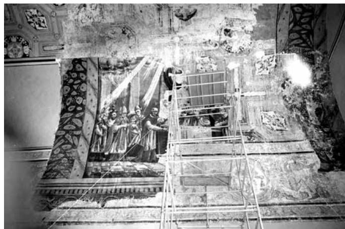
▲ Foto en el momento de eliminar la decoración del siglo XIX para descubrir la original del siglo XVI. A los lados, pintura falsa reciente.