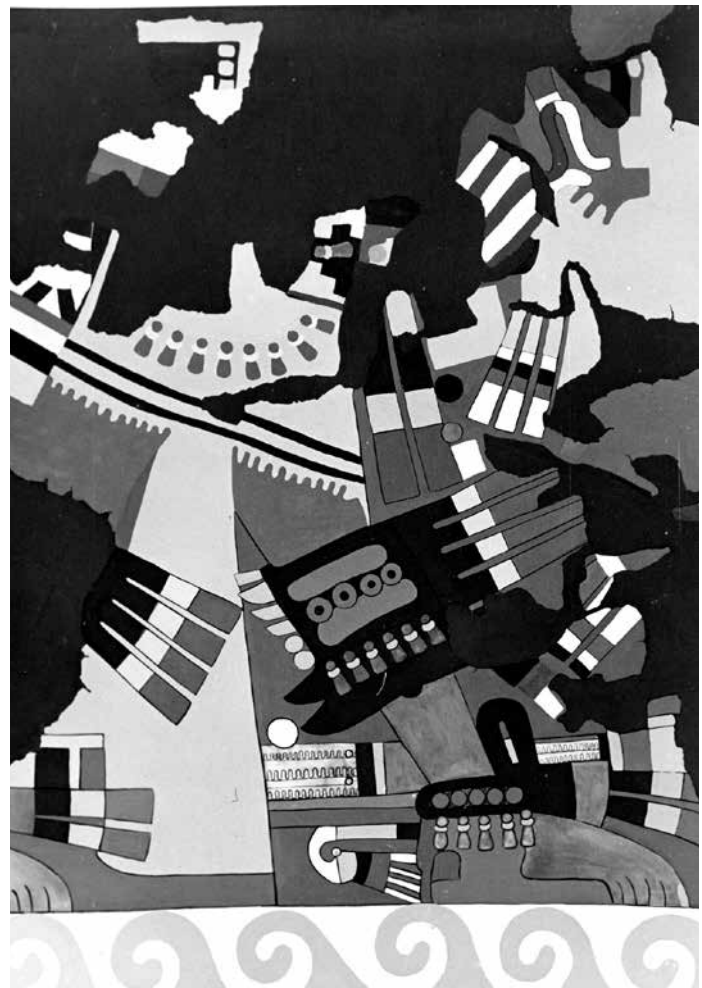
▲ Copias del original. Figura ritual fragmento, muro oriente, aposento A, friso alto, elemento 2.