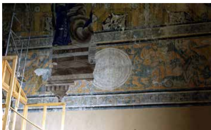
▲ Ixmiquilpan, coro.