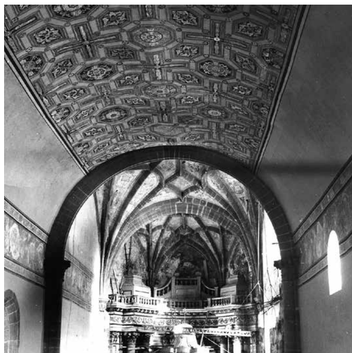
▲ En primer término, decoración falsa reciente que cubre la original del siglo XVI en la bóveda y muros. Al fondo, presbiterio y ábside en el momento de descubrir la decoración original.

Y aunque gracias al descubrimiento de esta capa pictórica podamos apreciar a sorprendentes caballeros águila y jaguar que se batían entre grutescos, grifos y decapitados (testimonio de las guerras que durante la colonización se desarrollaban en tantos planos de lo humano y lo divino), se ha perdido para siempre el programa pictórico que reemplazó esta decoración inicial y que también fue, en su momento, original.