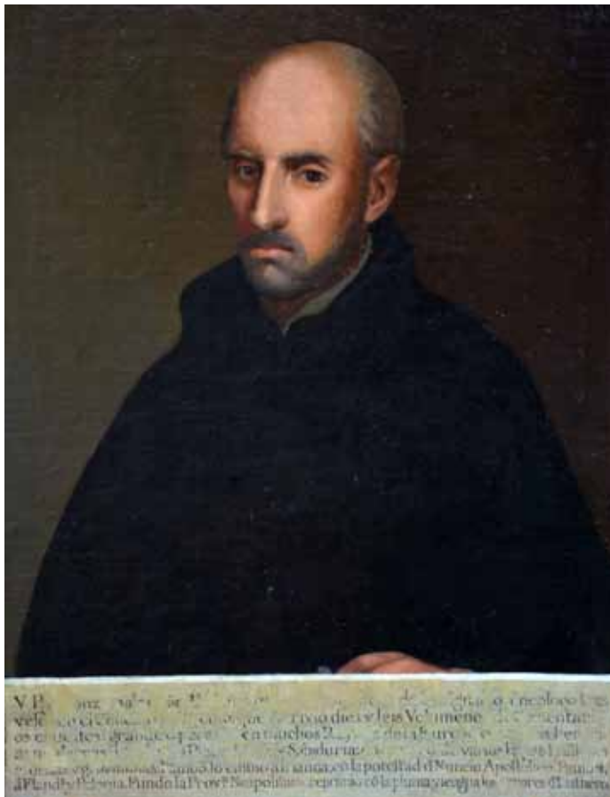
▲ Alfonso Salmerón