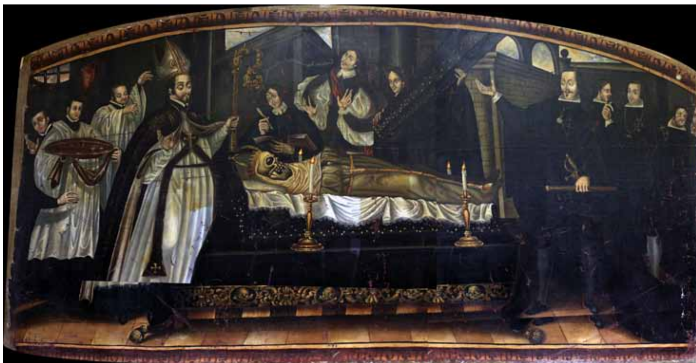
▲ La conversión de San Francisco de Borja