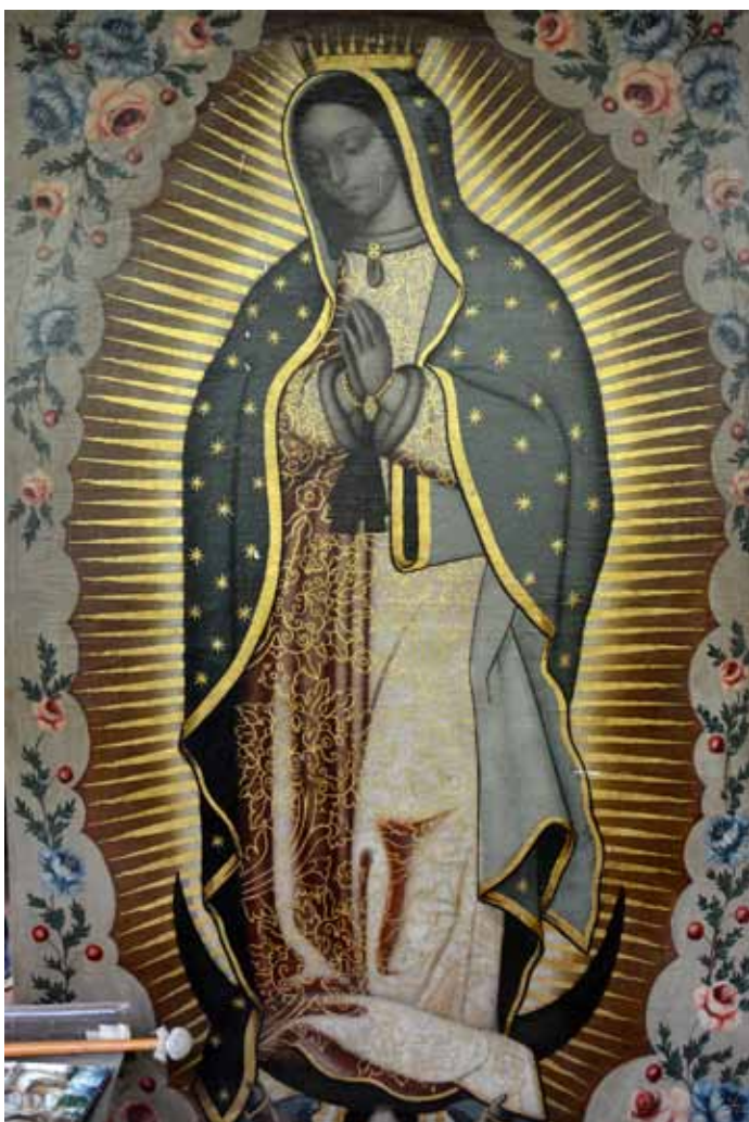
◀ Virgen de Guadalupe