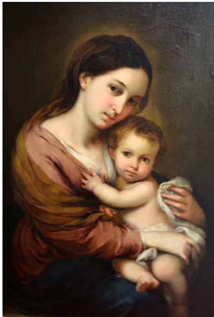
▲ Virgen de Belén | © INAH, 2014

Esta pieza del siglo XVIII (171 por 102 cm), en la que se personifica a la Virgen del Tepeyac, presentaba desprendimientos de pintura en varias zonas y sobre todo en la parte inferior. Además, tiene agregados para cambiarla de una forma oval a una rectangular.