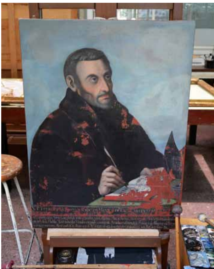
◀ Pintura del Fraile Pedro de Velasco durante el proceso de restauración en el Taller de Pintura de Caballete de la CNCPC

Los cuadros de Alfonso Salmerón y Claudio Jayo (ambos de 78 por 58 cm), pertenecientes al siglo XVIII se encontraban intervenidos previamente con reentelados mal aplicados, empastes que cubrían la capa pictórica original y repintes que invadían la imagen, así que los especialistas volvieron a reentelar sus soportes. Luego corrigieron los resanes y la reintegración cromática, que afectaban la lectura de las obras.